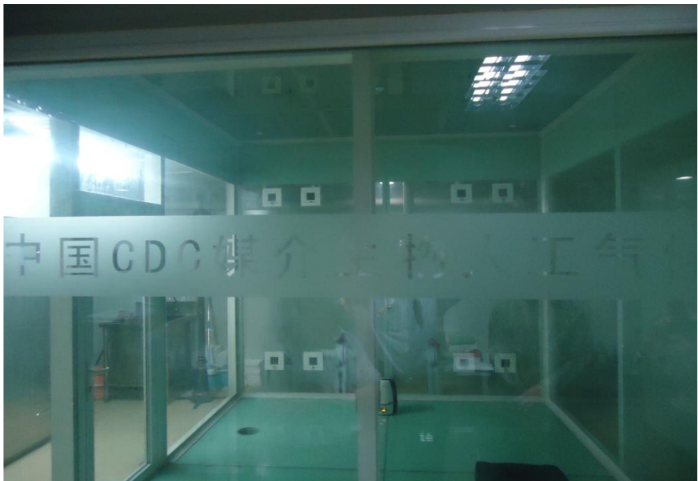
大陸地區中國疾病預防控制中心(CDC)病媒生物生態模擬實驗室