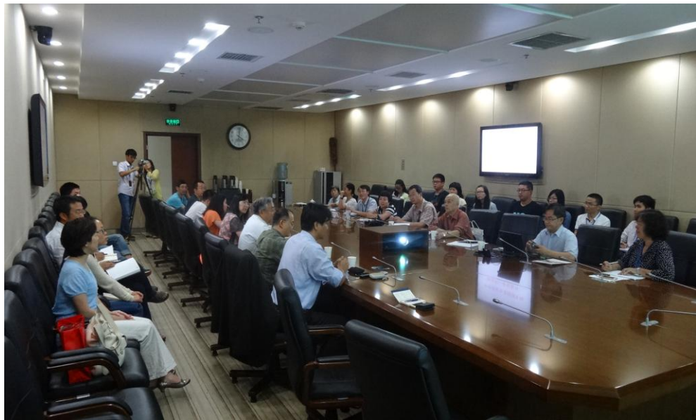
與大陸地區中國疾病預防控制中心(CDC)座談會情形