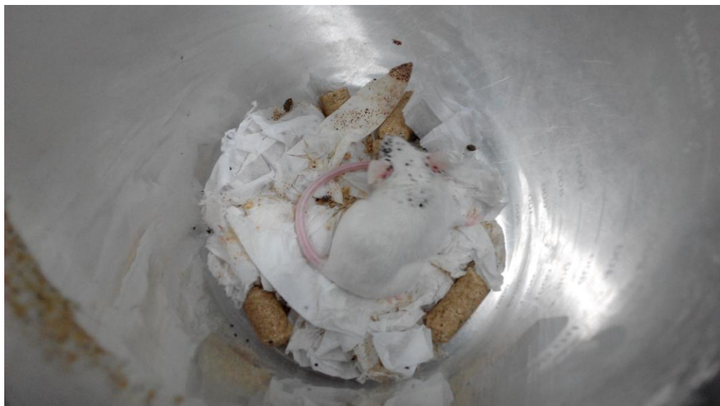
大陸地區軍事科學研究院以大白鼠養病媒生物