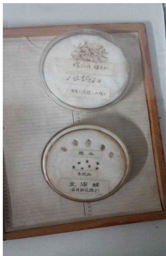
大陸地區軍事科學昆蟲標本館及病媒生物的標本