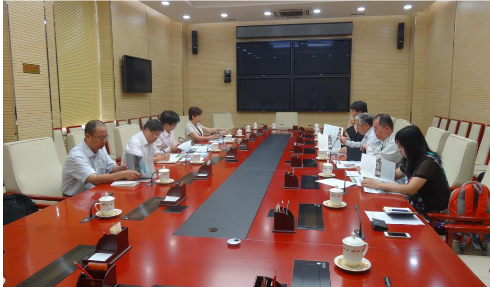
與大陸地區農業部環境用藥主管人員座談會情形