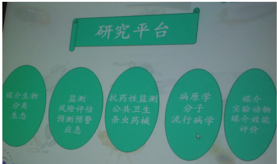
大陸地區中國疾病預防控制中心(CDC)簡報媒介控制研究室研究項目