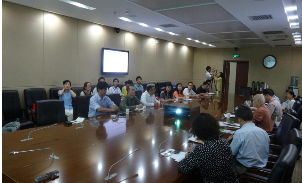
與大陸地區中國疾病預防控制中心(CDC)座談會情形