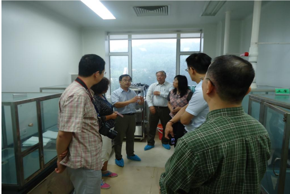
大陸地區中國疾病預防控制中心劉起勇所長介紹環境用藥藥效實驗室