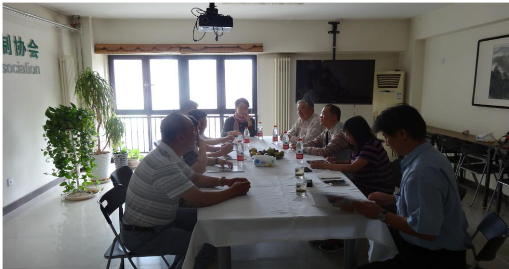
與中國衛生有害生物防治協會座談情形