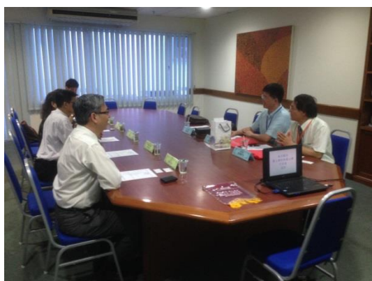
▲新紀元大學學院與本校交流座談會