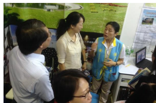
▲本校同仁介紹學校系所與特色