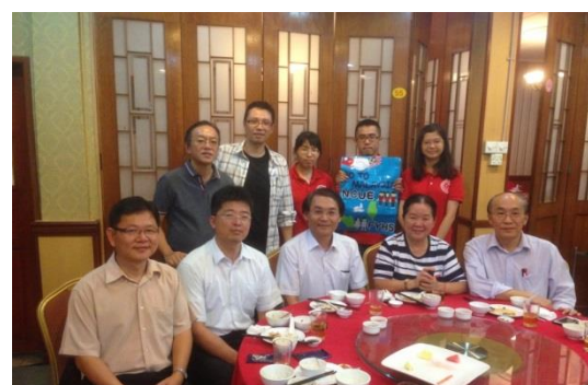
▲新山寬柔中學師長宴請本校師長及國際志工