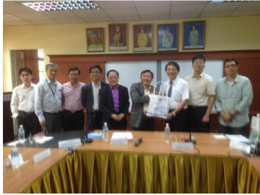
▲南方大學學院與本校互贈紀念品