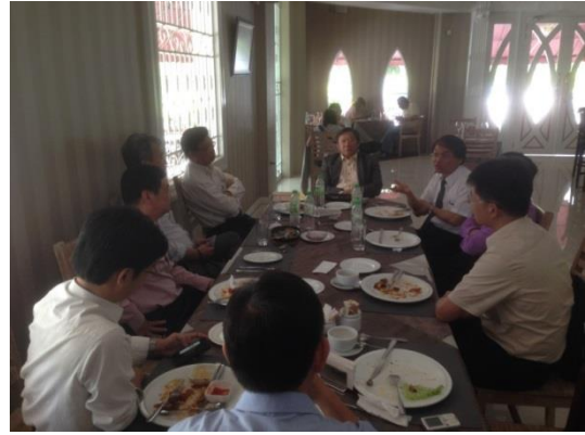
▲南方大學學院師長宴請本校師長