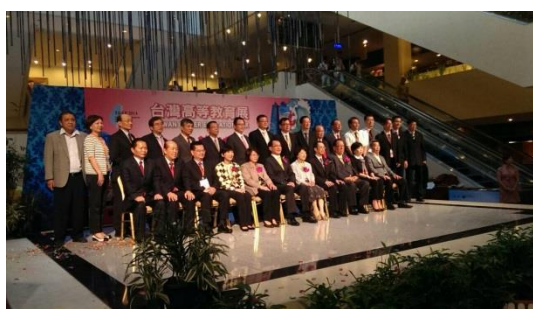
▲馬來西亞臺灣高等教育展開幕式貴賓合影