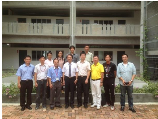
▲笨珍培群中學師長與本校師長合影