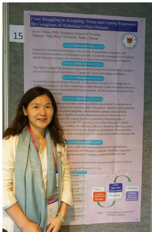
圖三 海報發表會場(一)