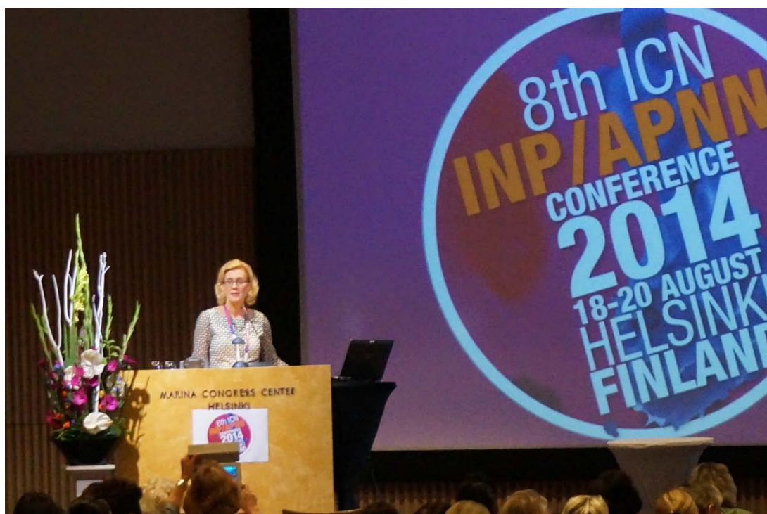
圖一 會場演講現況