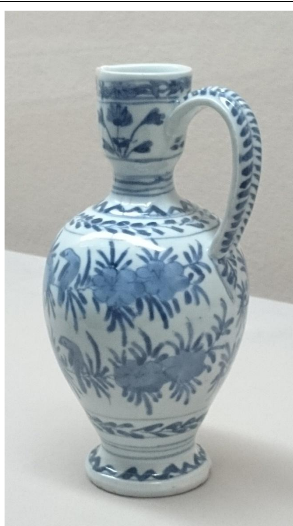
圖八、近距離參觀展品，並紀錄佈置與固定方式，圖為借展品之一：〈青花花鳥紋壺〉