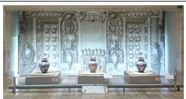
圖六、該展特別闢一展品區，供觀眾照相留念。