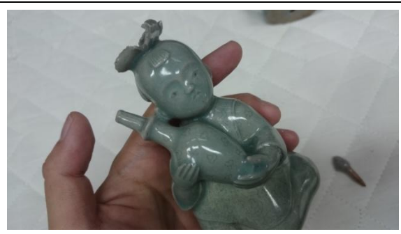
圖四、報告人手持該館著名藏品〈高麗青瓷女童水滴〉作詳細觀察