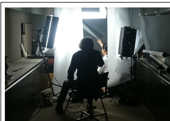
圖一、攝影師六田知弘先生（左）為高麗青瓷拍攝照片，館方鄭銀珍學藝員（右）協助調整燈光。

此次預計與該館商借高麗青瓷共 175 組件，其中絕大部分作品尚未有數位圖檔建置。為利「尚青：高麗青瓷特展」圖錄編纂，並考量先前數位照片色差等原因，最後重新拍攝所有展件 173 件。該館特別邀請日本著名攝影師六田知弘先生，從東京赴大阪協助拍攝高麗青瓷圖片，全數已於 8/23 拍攝完畢。將於十月底將整理後照片數位檔寄送故宮，並附上印出之相片以供色差等參考，六田先生願意親自協助校色。