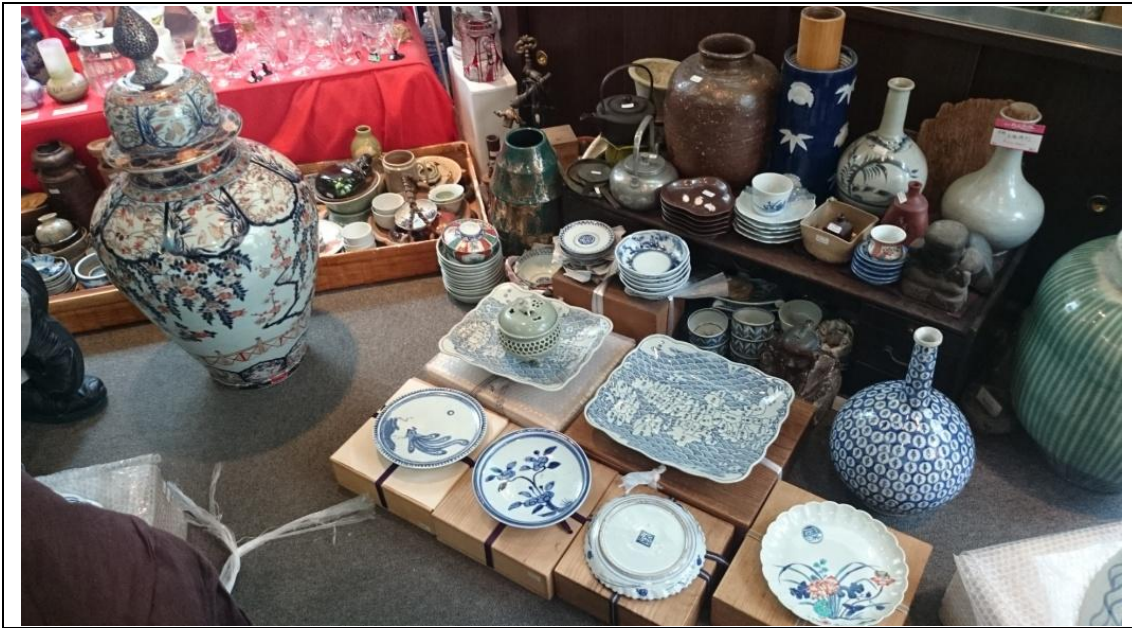
圖十二、大阪文物商所藏伊萬里瓷器乙批