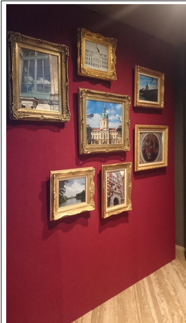
圖七、展覽入口處，擺設許多收藏有伊萬里瓷器的歐洲宮殿照片，帶領觀眾進入華麗的宮廷氛圍。