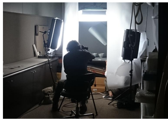
圖二、攝影師六田知弘先生拍攝該館著名的〈高麗青瓷溫碗〉一對