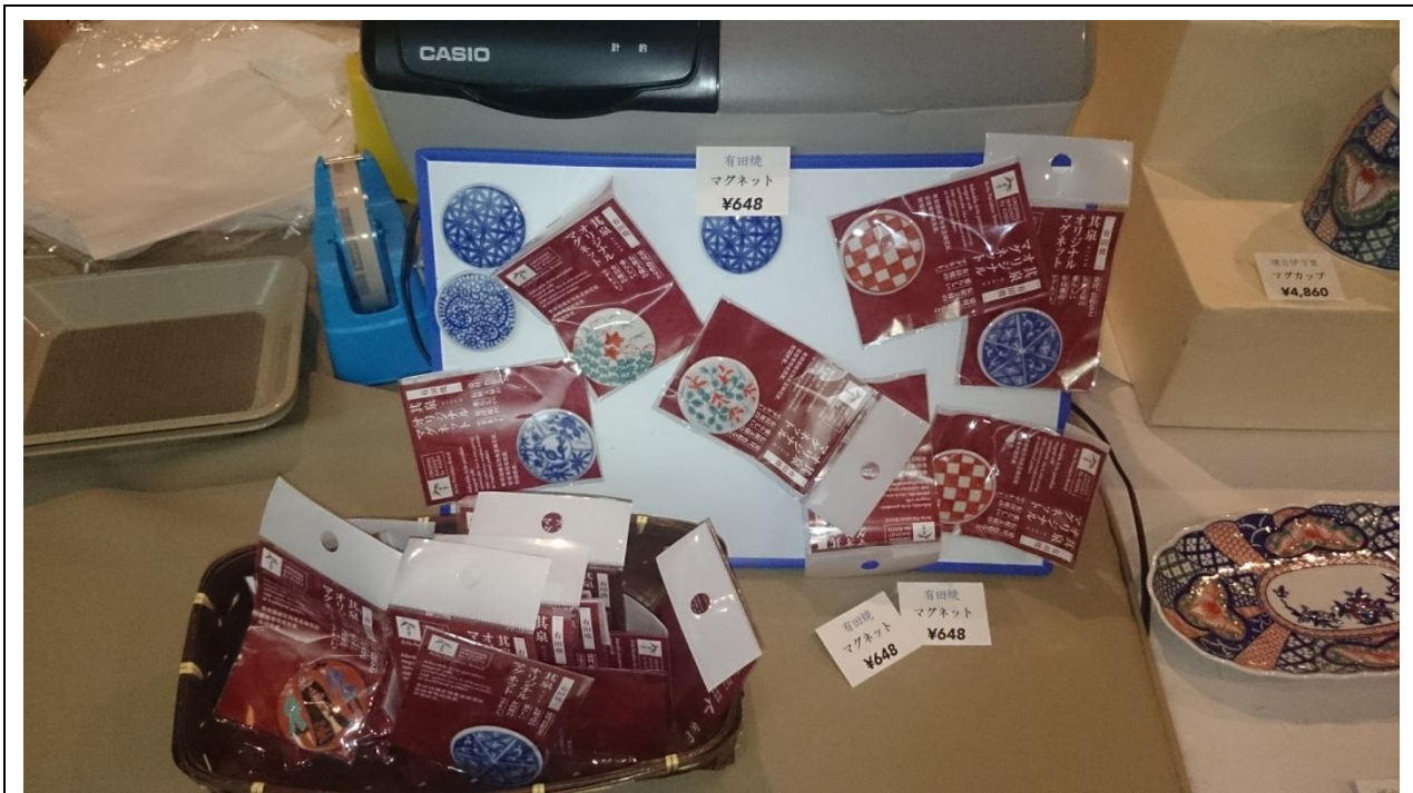
圖十、十一 該展的文創商品