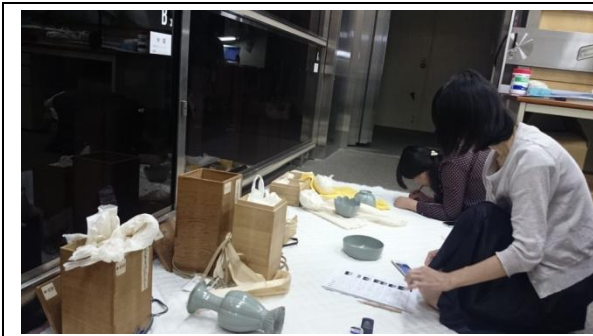
圖三、報告人於庫房一角目驗高麗青瓷