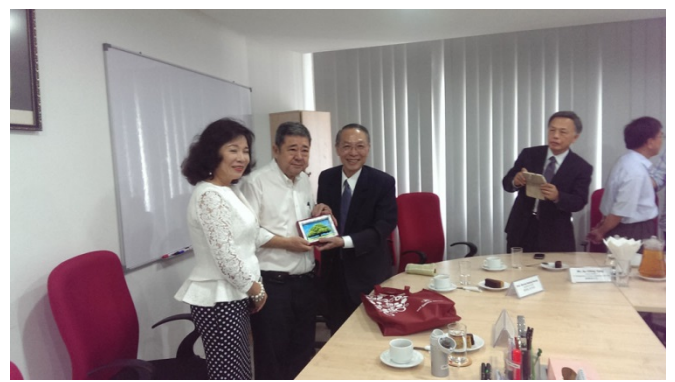
與陳唱集團陳總裁合影