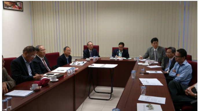
出席拉曼大學座談會