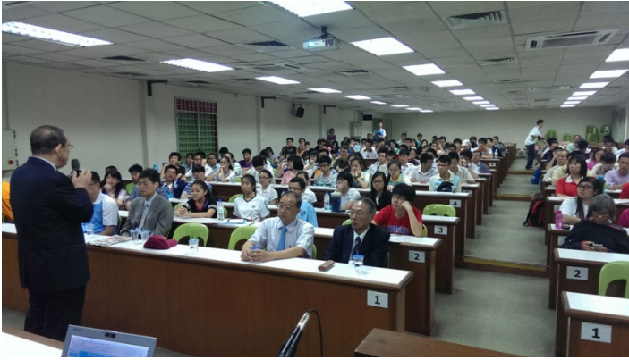
代表團於中華獨立中學招生說明會