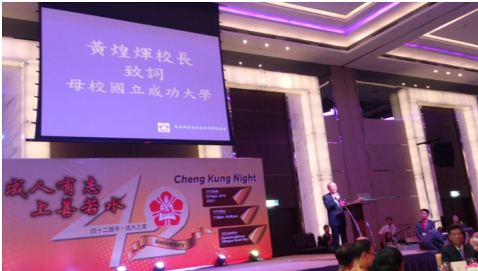
黃焯輝校長於第 42 屆馬來西亞校友年會致詞