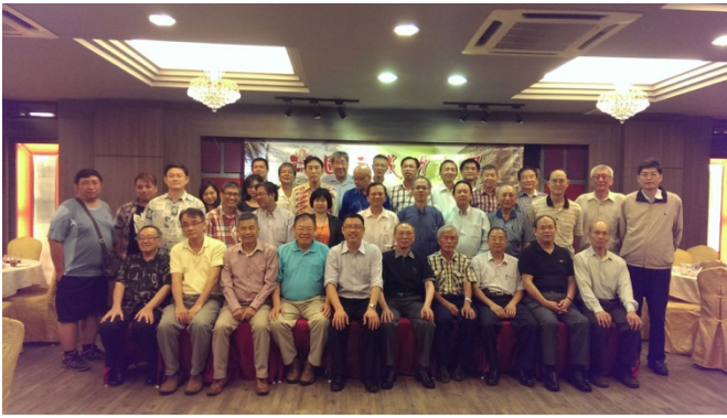
出席霹靂州校友聚會