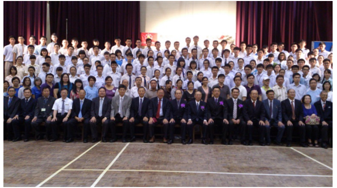
成大代表與華文獨中數理學識比賽參賽學生合影