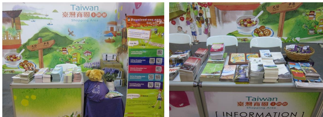
圖 5 展館整備完成圖(1)