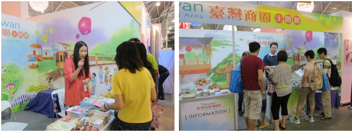
圖 7 展館中商圈旅遊諮詢實況

臺灣商圈之美，推廣 16 處商圈座落地理位置、交通路線、觀光旅遊特色，特色民宿、美食小吃、伴手禮品及客製化的遊程規劃建議等，參展期間本館攤位人潮絡繹不絕，當地民眾反應甚佳。