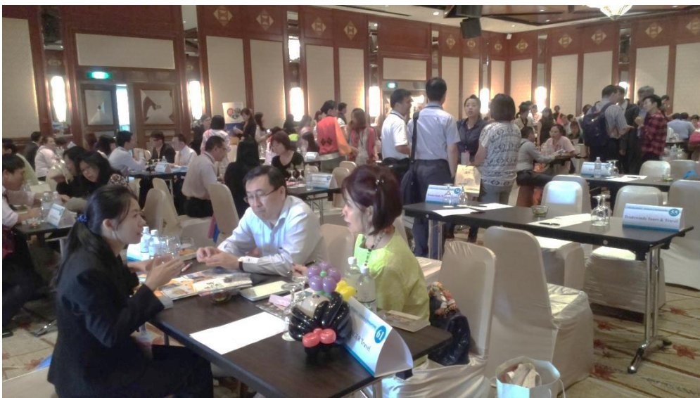
圖 10 推廣會現場交流實況