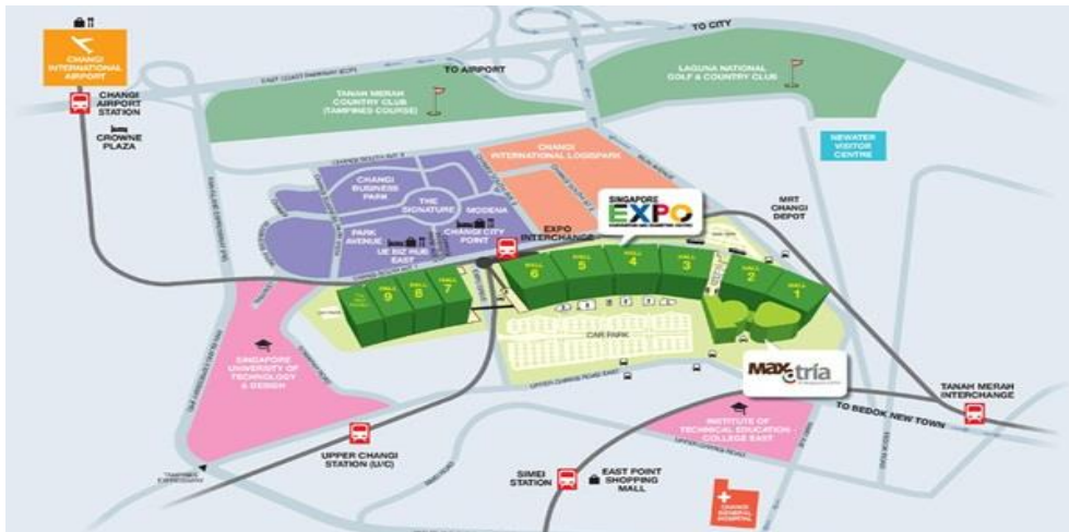
圖 2 Singapore Expo (新加坡展覽中心) 平面圖