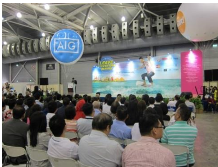
圖 1 2014 新加坡秋季旅展現場舞台區

「2014 新加坡秋季旅展」於 103 年 8 月 29 日至 8 月 31 日，於新加坡展覽中心 Hall 4,5,6A 辦理，本年度以「拋開乏味生活」為主題，邀請各國家（區域）旅遊產業，介紹各項旅遊優惠配套措施，共邀集 165 個參展商，包括新加坡當地旅行社、航空公司、旅遊保險、信用卡公司、旅行用品，以及多個國家和地區的旅遊局代表（包含臺灣、澳大利亞、捷克、義大利、香港、印度、日本、韓國、澳門、墨西哥、南非、泰國、紐西蘭、印尼等）、海外旅行社、酒店、渡假村、汽車出租公司等，共設置 1,226 個展攤。（各參展單位詳如附錄）