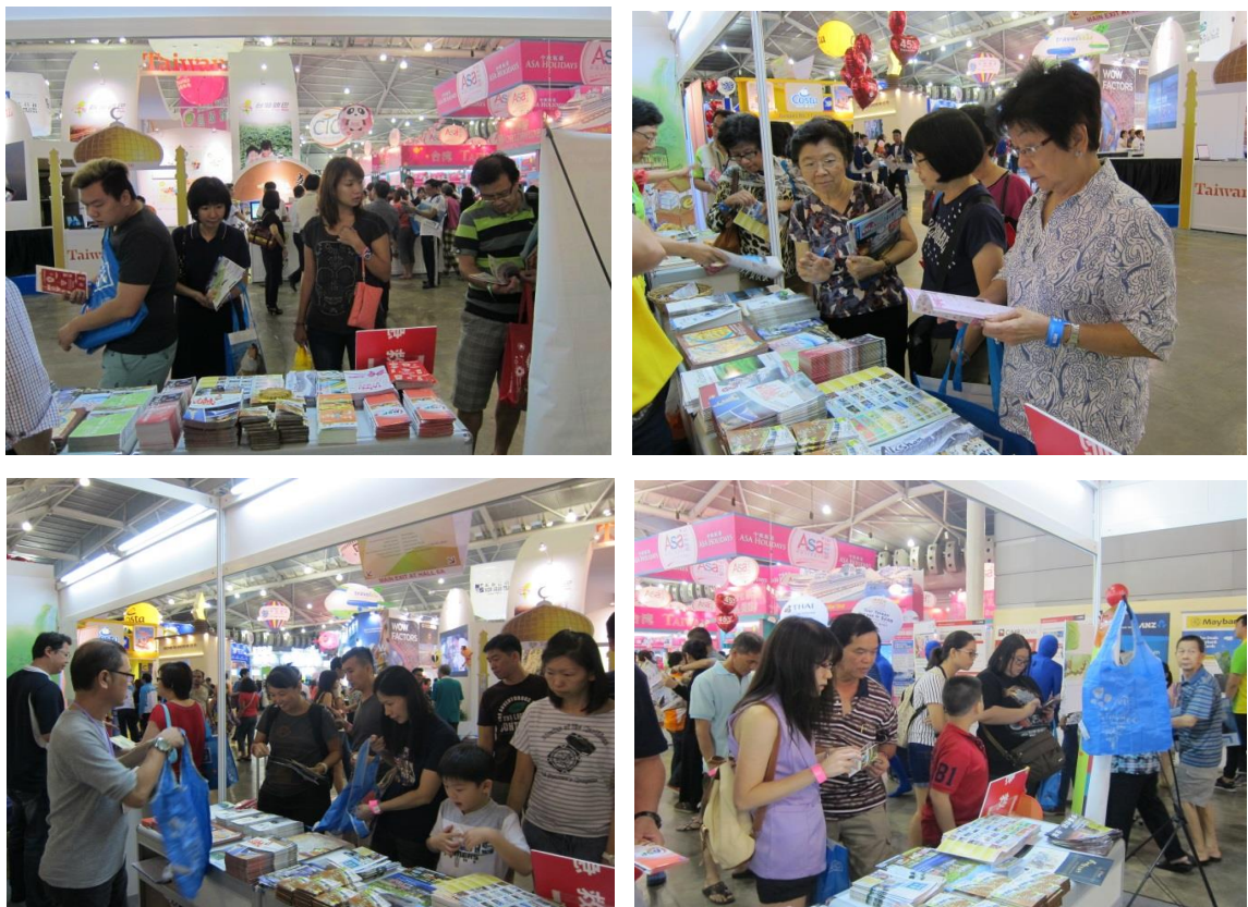
圖 9 民眾索取商圈文宣品實況