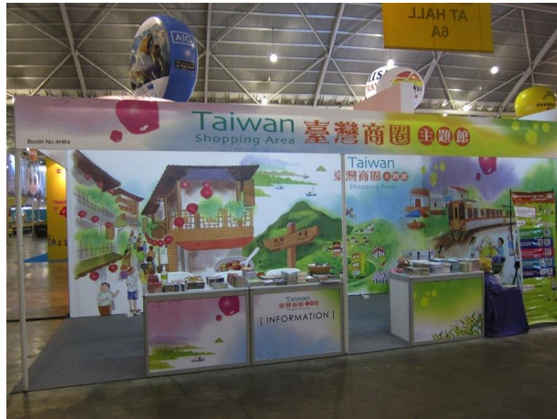
圖 4 展館施工完成圖

本（103）年度參與新加坡秋季旅展展覽目的為臺灣商圈主題旅遊形象宣傳，以介紹臺灣商圈和旅遊指南為主軸，為呈現商圈主題意象，採獨立承租展館展位並搭設商圈主題館，共承租二個標準攤位大小，總計 18 平方米，兩面臨走道，座落於臺灣觀光局展館對面，展館設計採取以商圈特色景點的圖像襯托出臺灣商圈旅遊環境的感覺，吸引觀展民眾之目光，展館結構設計上以開放式為原則，並以「臺灣商圈主題館」作為宣傳主軸。