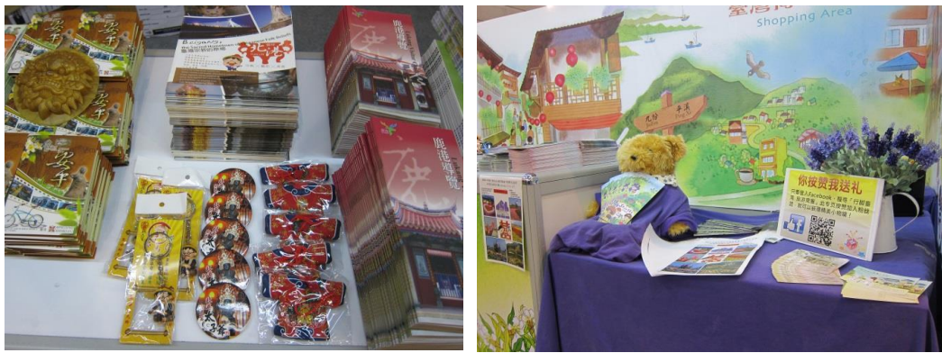
圖 6 展館整備完成圖(2)