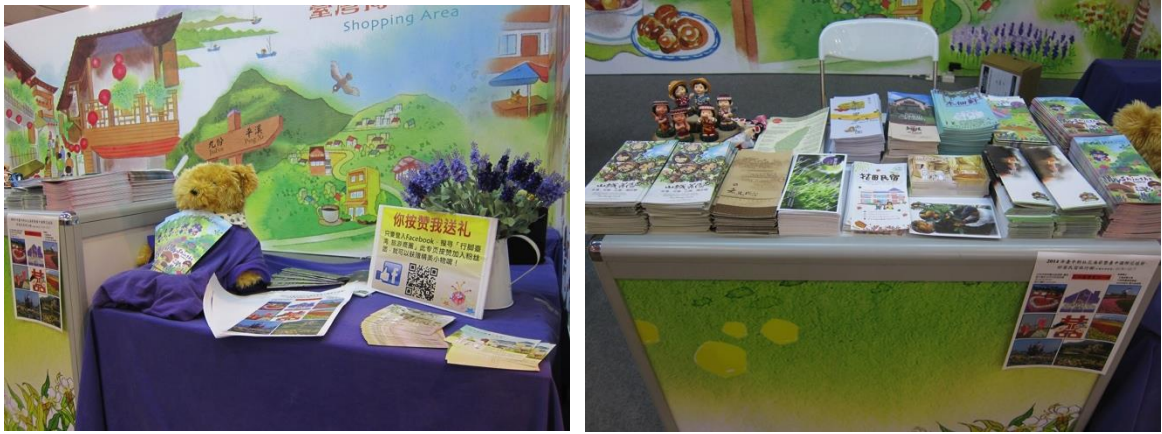
圖 8 商圈文宣品及現場互動遊戲區展示圖