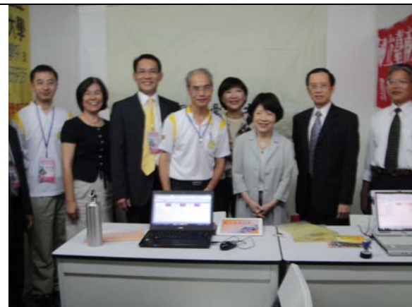
教育部黃碧端次長在本校攤位合影