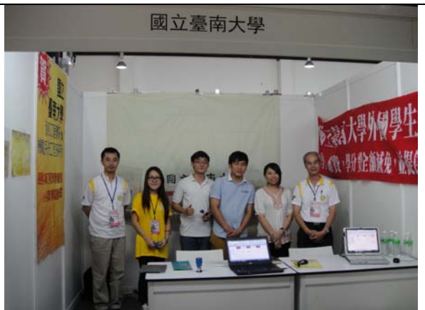
本校參展代表與吉隆坡工讀生