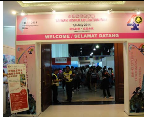
吉隆坡世界貿易中心展館 會場入口