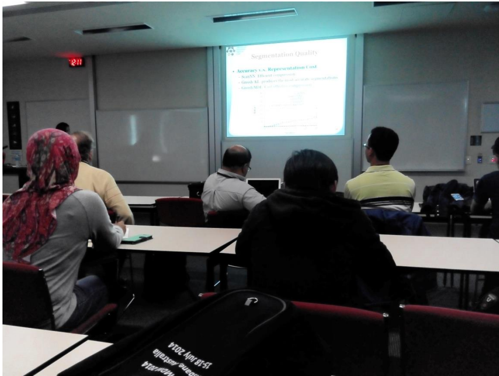
聆聽國際學者發表研究成果