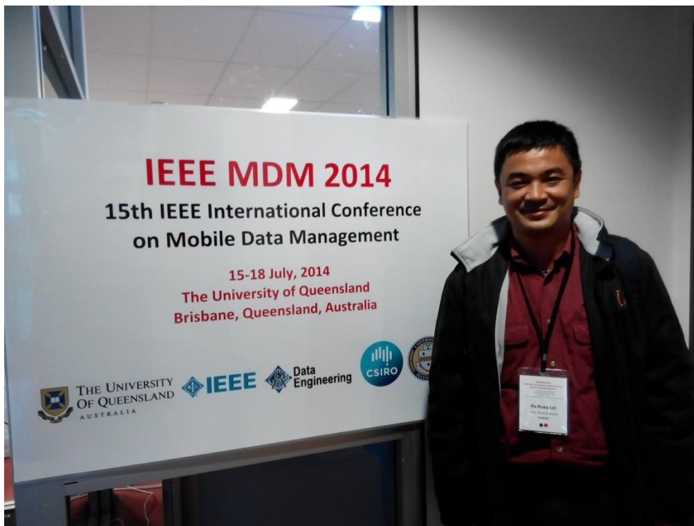
IEEE MDM 2014 會場