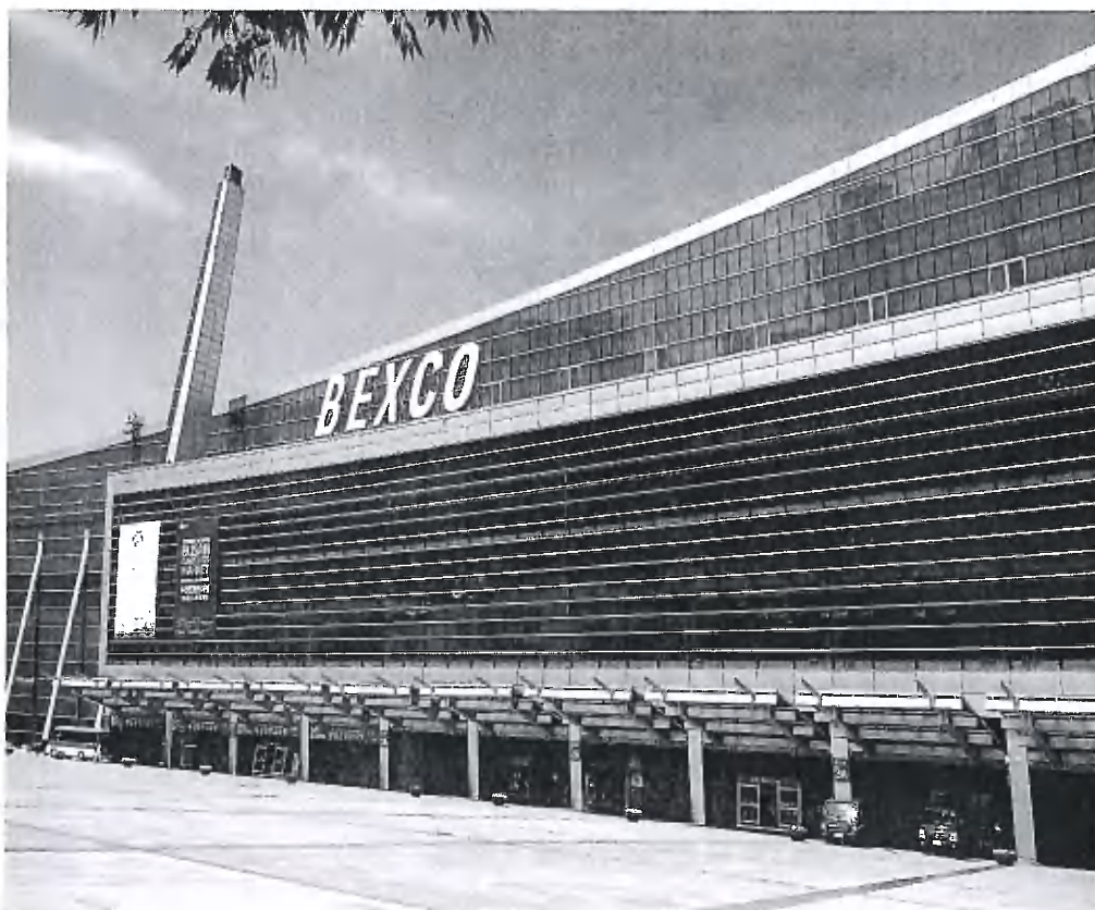
附錄八、釜山會展中心（BEXCO）外觀