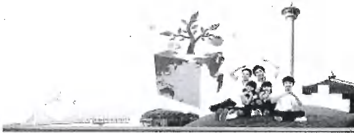
附錄四、第七屆亞洲區安全社區研討會手冊封面