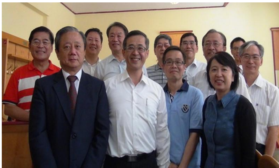
訪團與駐奧地利代表處陳大使連軍（左前一）及教育組簡任一等教育秘書王湘月（右前一）合影

本訪團於出發前與參訪學校的相關聯繫事宜，因為有兩代表處的積極協助得以順利進行。為感謝兩代表處的協助，本訪團特別安排拜會行程，並就促進與奧地利及匈牙利高等學府間之合作交流交換意見。駐奧地利代表處由大使陳連軍及教育組簡任一等教育秘書王湘月、駐匈牙利代表處由大使高青雲及組長曾三訊盛情接待。