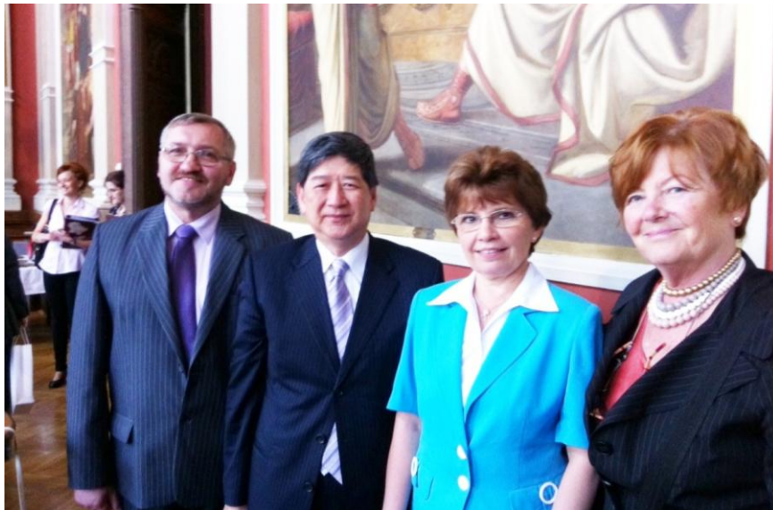
國立高雄餐旅大學容校長繼業與該校主管合影