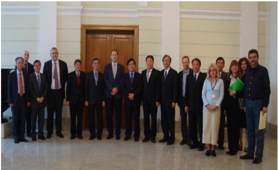
訪問團與該校校長及主管合影