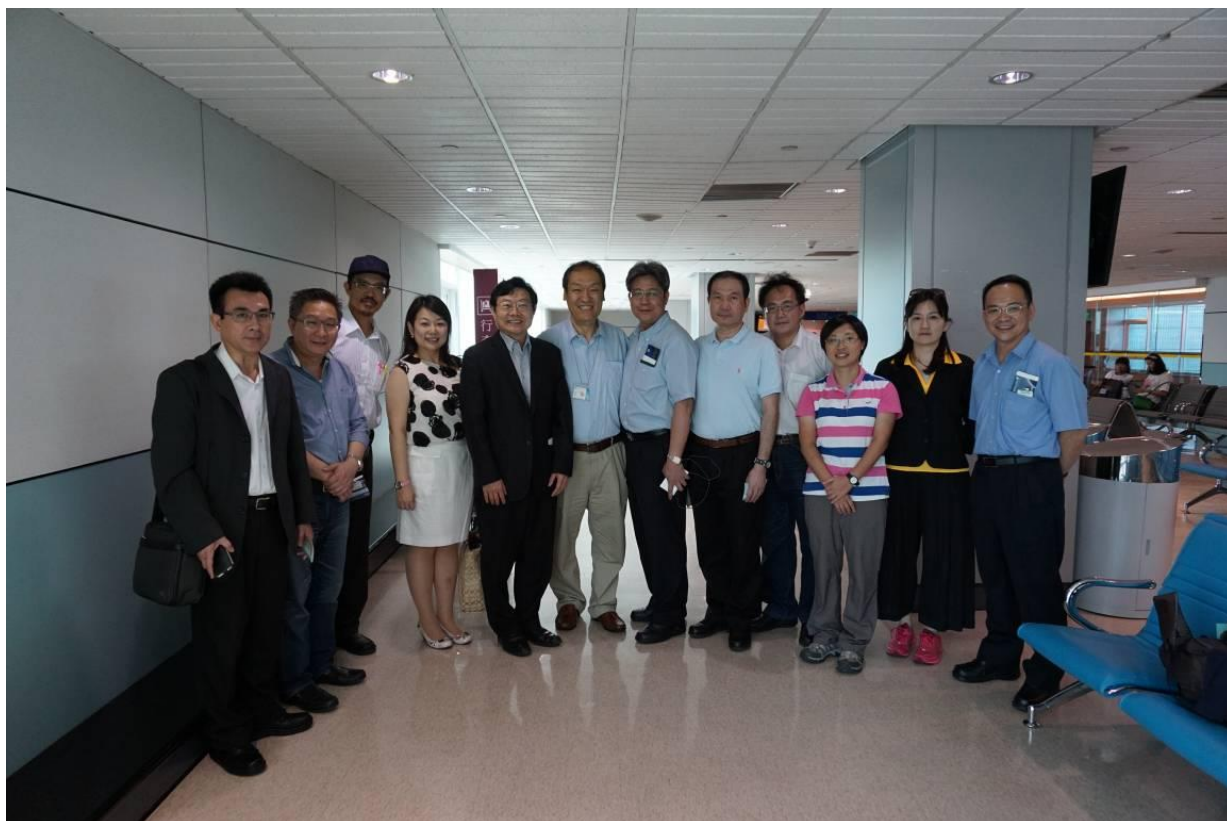
本次臺灣醫療團成員出發前與本處海中雄處長合影