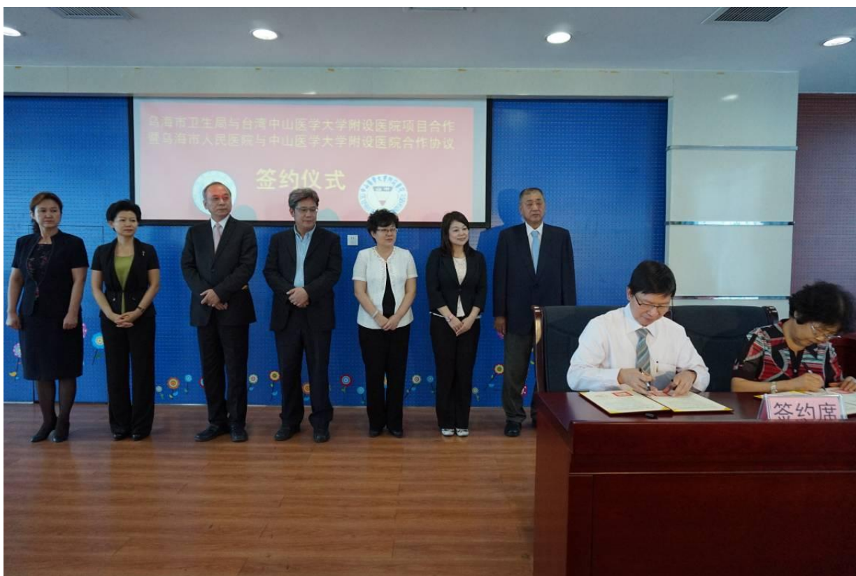
中山醫學大學附設醫院與烏海市人民醫院簽署合作協議