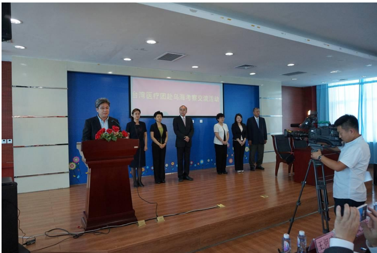
衛生福利部醫管會林慶豐執行長在烏海市婦幼保健院交流活動開幕式致辭