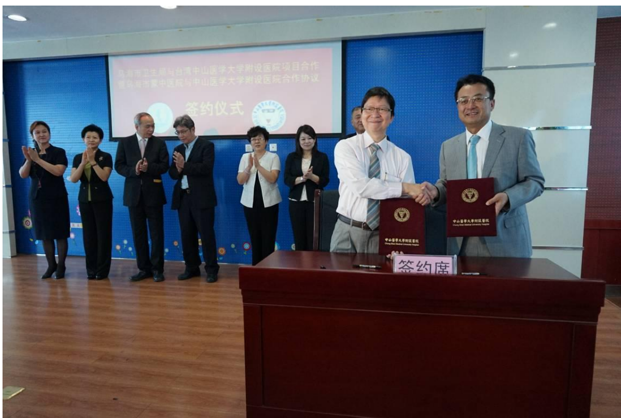
中山醫學大學附設醫院與烏海市蒙中醫院簽署合作協議