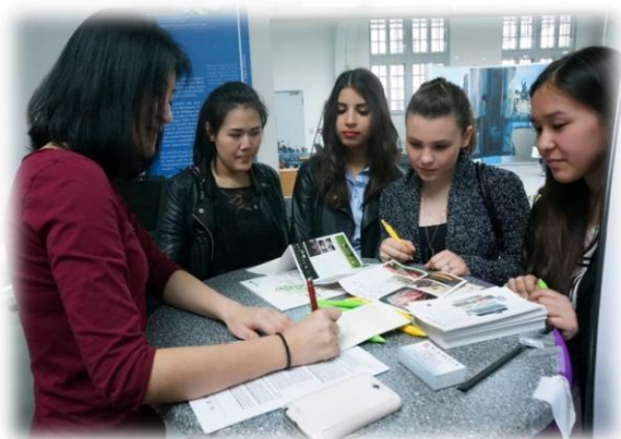
圖十一【本校人員進行招生實況-3】