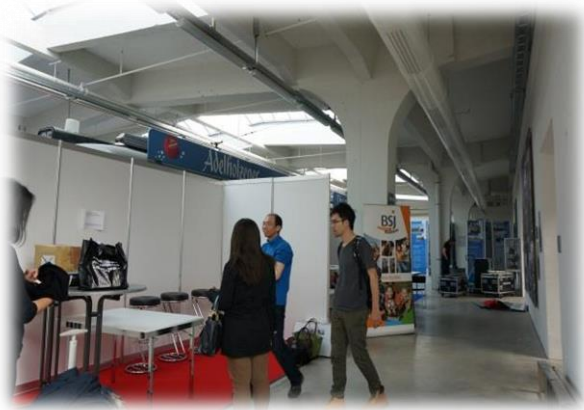
圖五【臺灣攤位準備狀況】