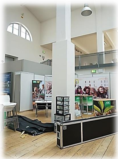
圖三【開展前各攤位準備狀況】