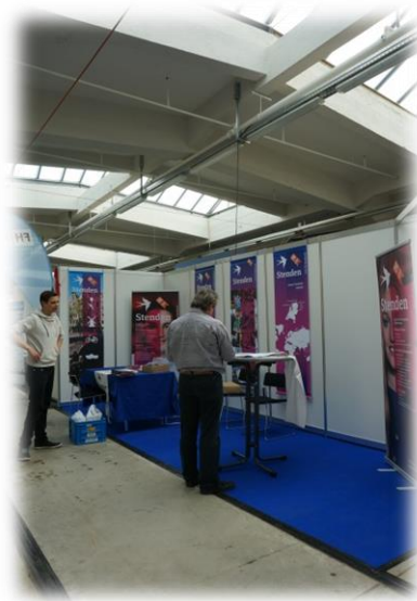
圖四【開展前各攤位準備狀況】