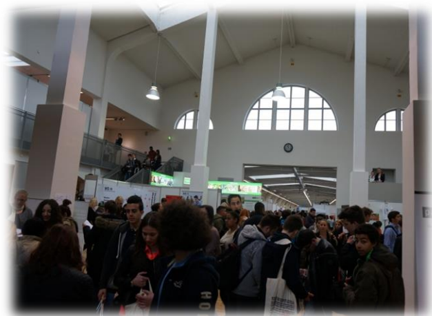
圖八【教育展首日場內盛況】