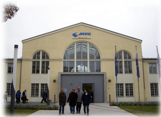
圖一【2014 德國教育展入口處】

本次 2014 德國教育展於 4 月 8 到 4 月 9 日在德國慕尼黑 MVG 地鐵博物館(MVG Museu)舉行。本校人員於 4 月 6 日傍晚自臺灣桃園機場飛往德國慕尼黑市，抵達時間因沿途轉機及時差因素約是德國當地 4 月 7 日早上 6 點。因抵達時間相當早，參展宣傳相關物品如展架、文宣等眾多，便選擇搭乘大眾交通工具前往飯店休憩片刻，等待約下午時間與駐德代表處人員會面。抵達飯店安頓好後，約下午兩點鐘，代表處二位人員即親自至台灣參展校下榻飯店會面接待。在進行簡單的寒暄並相互介紹所有參展人員後，隨即帶領參展人員搭乘當地地鐵至會場進行場勘及初步布置。沿途透過列車窗外欣賞德國優美街景，也和所有參展人員討論教育展相關事宜，特別感謝德國代表處人員於教育展籌備期間不間斷地協助提供當地相關重要生活資訊以及展務聯繫等事宜。