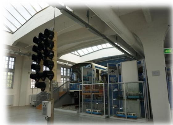
圖二【2014 德國教育展內部狀況】