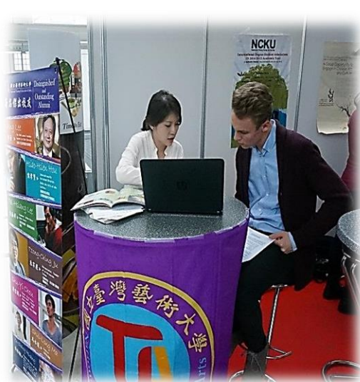
圖十【本校人員進行招生實況-2】