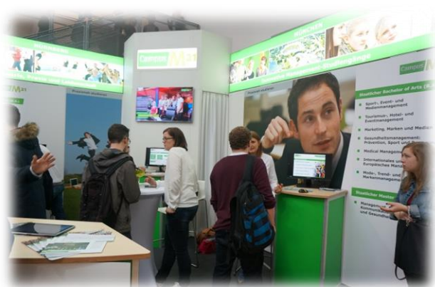
圖十六【德國校院招生攤位】