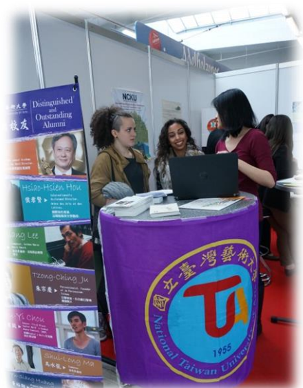
圖九【本校人員進行招生實況-1】