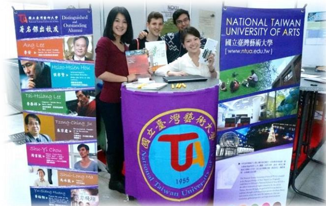
圖十二【本校人員進行招生實況-4】

本日除時間內原預約之學生人數已額滿，亦有不少臨櫃造訪的德國學生對於本校尤其是表演藝術、設計與傳播相關科系感到興趣而前來詢問。參觀學生主要為高中生，升學仍以學士課程為主流，多數學生希望瞭解學校獎學金以及住宿等資訊，熱門諮詢科系包括表演學院的舞蹈學系及戲劇學系；美術學院之美術學系及書畫藝術學系；設計學院之工藝設計學系、視覺傳達學系及多媒體動畫藝術系；傳播學院之電影學系、圖文傳播藝術學系以及廣播電視學系。鑑於來訪學生人潮不斷，更意外感受到德國學生對於藝術領域之興趣與熱忱。