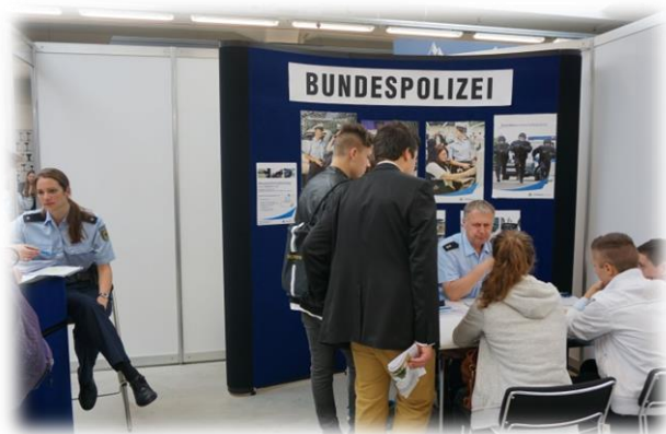
圖十五【德國警校招生攤位】