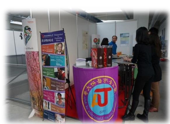
圖六【本校攤位準備狀況】