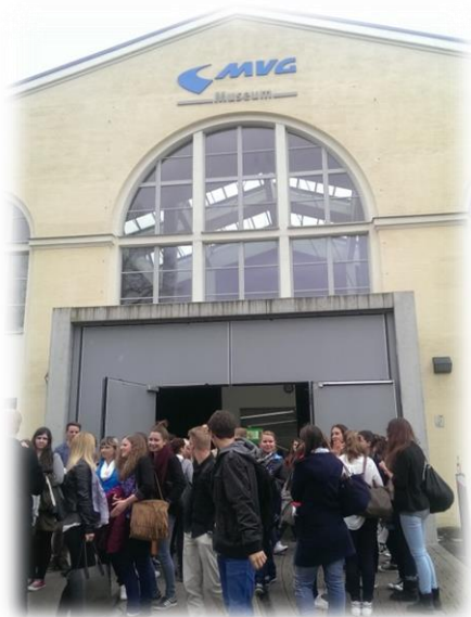
圖七【教育展首日場外盛況】

本校攤位值班時間主要為4月8及9日共計二天自上午8時30分至下午2時30分。第一日活動開放入場，展場隨即湧入眾多人群，學生們分別選擇自己有興趣的攤位前往詢問相關資訊。本次德國教育展有別於以往他國之規劃，代表處人員採用學生預先登記報名方式來依序安排會面時間，並將預約學生希望詢問的臺灣校院系所資訊進行彙整列表；如此使本次教育展於攤位開放時間內能做更有效規劃，也利於臺灣學校代表能事先針對學生各項需求，提供更完備的資訊提供當日前來詢問的學生。