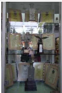
中華獨中曾多次獲得陳嘉庚杯全國獨中統考成績優秀獎