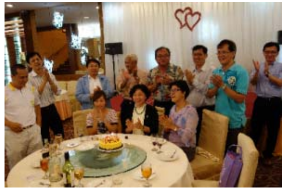
獲邀與臺北大學參展人員一起參加校友會所舉辦慶生及聯誼餐會