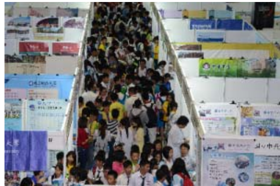
吉隆坡教育展參觀人潮，右下角為本校攤位