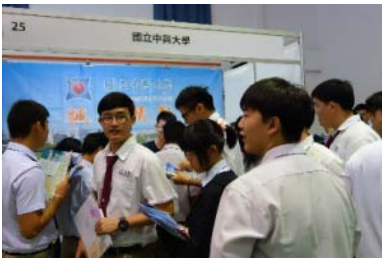
古晉參觀人潮，參觀同學在本校攤位前等著索取資料