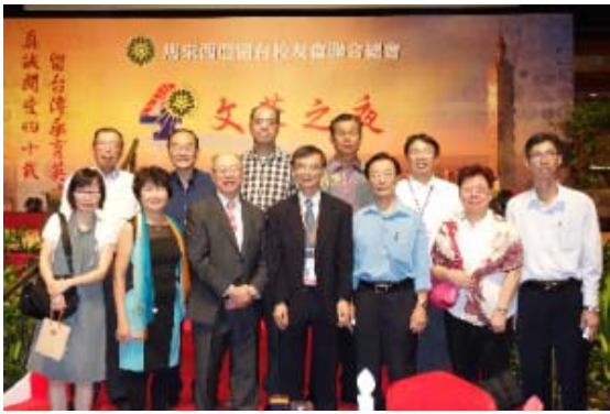
受邀參與留台聯總 40 週年文華之夜，與香港及馬來西亞校友於舞台前合照