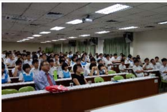
本校在中華獨中舉辦升學講座，約 200 位同學參與講座