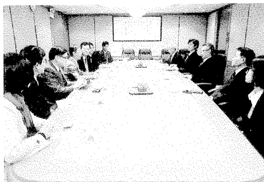
拜會香港事務局（台北經濟文化辦事處）