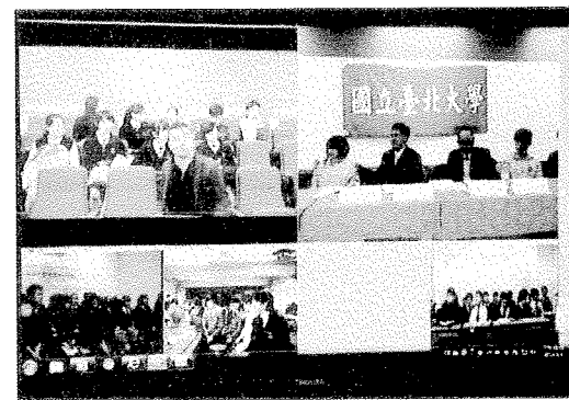
香港恒生管理學院蒞校洽談學術合作