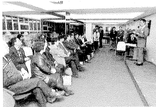
海華服務基金-臺北大學說明會