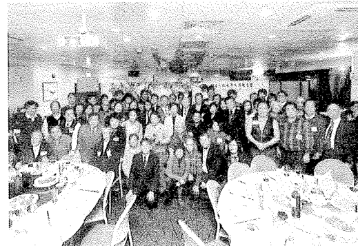
國立臺北大學香港校友會成立