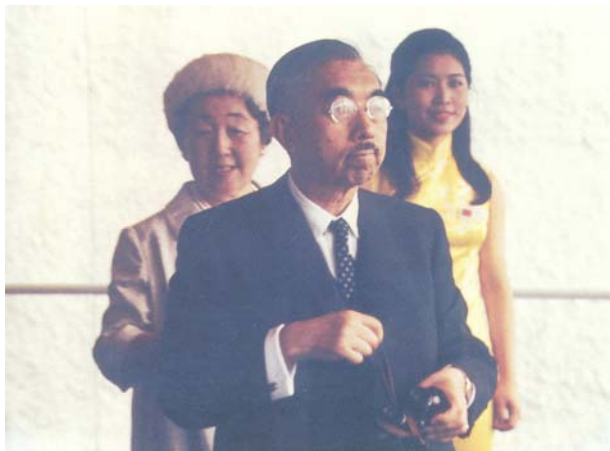
日本裕仁天皇伉儷參觀一九七〇年大阪萬國博覽會中華民國館故宮文物展出，由張臨生小姐導覽

「臺北 國立故宮博物院神品至寶」特展（以下簡稱「神品至寶」）係本院藏品第二次赴日展出，參展文物計歷代書畫、器物、圖書文獻二三一組件，俱屬院藏名寶上珍，足為華夏民族文化藝術表徵。案一九六一年故宮博物院與中央博物院籌備處選提遷臺文物赴美國五大城市舉辦「中華文物（Chinese Art Treasures）」巡迴展覽前後，日本前內閣總理大臣岸信介及經濟新聞社圓城寺次郎社長等即曾倡議向我國商借兩院藏品，前往展出。 1 一九六五年十一月，政府將故宮博物院與中央博物院籌備處合併，恢復國立故宮博物院建制。一九七〇年三