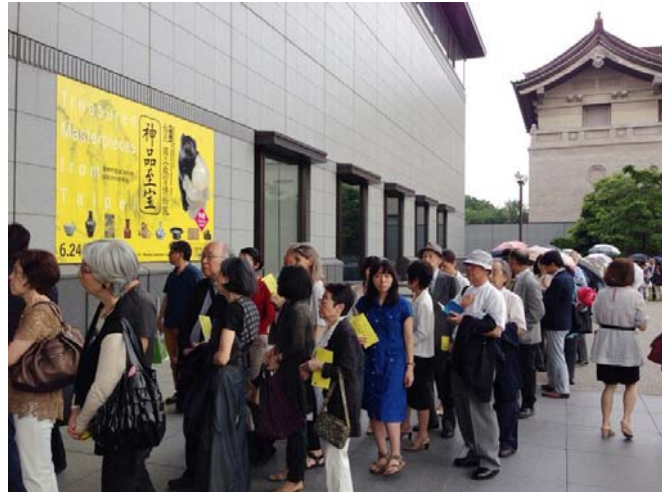
來賓持邀請函排隊入場，參加開幕儀式

十時迄下午一時，東博特為日華議員懇談會會員及新聞媒體各安排一場預覽會，為時九十分鐘。預覽會甫結束，受邀參加「神品至寶」展覽開幕儀式之各界來賓，即陸續抵達報到。平成館一樓典禮會場空間不大，腹地有限，本院代表團入座前，會場已人潮洶湧，氣氛熱烈，