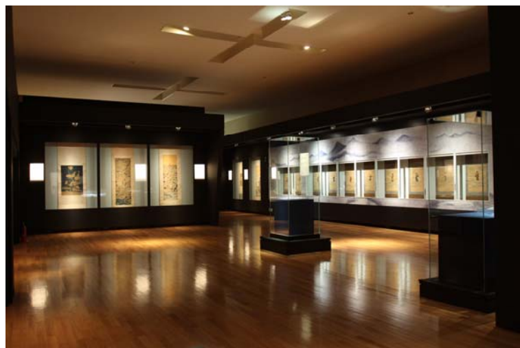
「神品至寶」陳列室一景

今年六月中下旬，正值本院與東博專業同仁忙於文物佈陳，展覽即將開幕之際，日本各贊助媒體於文宣海報及預售門票略去故宮全銜「國立」兩字之作為，引發我國朝野高度關注，咸認我國國格橫遭矮化。馬英九總統甚且發表嚴正聲明，強調「國家尊嚴絕對優先於文化交流」。在本院要求確實遵循借展合約條文規定，否則不惜停止展覽的強烈抗議之下，東博依限完成文宣及票券錯誤改正，使各項活動終得依既定期程進行。對於贊助媒體之所為，東博雖以事涉新聞言論，無從干預為由，畢竟難辭監督不周之咎。兩字之差，幾使中華民國與日本之文化合作盛事付諸東流，亦幾使日本民眾盡攬本院藏品菁華之殷望化為幻影。揆諸雙方於風波驟起之後為解決問題所展開之冗長協商，為改正錯誤所投注之大量人力，中國俗語所謂「好事多磨」正是