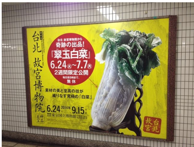
東京地下鐵車站內略去本院全銜「國立」二字之文宣看板

六月十六日，本院接獲關切「神品至寶」展覽友人提供之照片資料，顯示東京出現未載示「國立故宮博物院」全銜之文宣海報。馮院長立即與李玉珉處長聯繫，要求速洽東博相關人員，瞭解詳情。李處長洽詢東博執事同仁，獲悉原委後回報：凡東博所製作，張貼於館區內之文宣品皆載示「國立故宮博物院」全銜；其他以「故宮博物院」稱之，略去「國立」二字者，皆贊助「神品至寶」展覽之讀賣新聞、朝日新聞、產經新聞、每日新聞、東京新聞，以及日本放送協會、富士電視台等新聞電視媒體所為。 17 馮院長以日方未完整揭示本院全稱，事涉「雙方合約之執行，關係重大」，即於十七日以正式信函電傳東博錢谷館長，請其「詳予瞭解並協助處理，以維護本院應有之尊嚴及權益」。信函正本則由十八日押運翠玉白菜赴日之器物處蔡玫