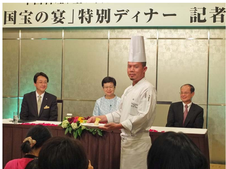
馮院長、沈代表、東急凱彼德大酒店總經理但馬英俊（左）出席「國寶宴」晚宴商品記者會

中午，馮院長與沈代表受邀赴東急凱彼德酒店，參加故宮晶華「國寶宴」晚宴商品記者會。案故宮晶華配合「神品至寶」於東博的展出，特別與東急凱彼德酒店合作，於六月二十四迄二十八日期間，推出「國寶宴」晚宴套餐，期使日本