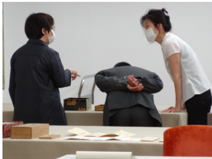
本院代表團進行特別提件參觀情形

矚目，尤以「肉形石形肉」包裝食品最獲日本觀眾青睞。案東博館內文創精品銷售專區之設置，係本院首次配合海外借展，同步辦理文創產品展銷之創新作為，旨在具體呈現本院「形塑典藏新活力，創造故宮新價值」的文創開發成果，並彰顯臺灣發展藝術文創產業的多元面向。此次向日本觀眾介紹的內容，除本院自行設計開發之創意商品與編輯出版之書刊，尚包括法藍瓷、八方新氣、朱的寶飾、富御珠寶，以及興台印刷、藝拓公司等國內知名文創商家之精製雙品牌產品。依本院規劃，文創精品銷售專區亦將於十月、十一月間移師