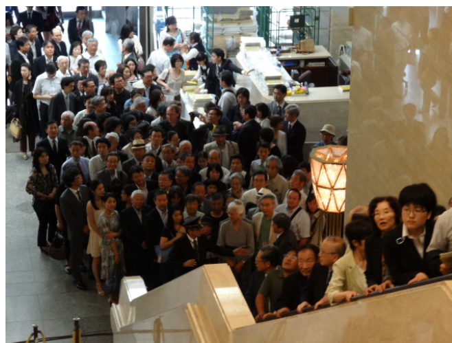
來賓排隊入場參觀情形

久文化」。為期「廣泛介紹中國文化的特性與精采內涵」，東博特將展覽分為「中國皇帝典藏之淵源—禮之起始」、「徽宗典藏—東方之文藝復興」、「北宋士大夫之書法—超越形式的魅力」、「南宋宮廷文化之輝煌—永遠的古典」、「元代文人之書畫—理想的文人」，以及「中國工藝之精華、天與人之競合」、「帝王與祭祀—玉與青銅」、「清朝皇帝的真面目—不為人知的日常生活」、「乾隆皇帝典藏—中國傳統文化的再編」、「清朝宮廷工房之名品—多文化的交流」十大自成統緒，而又彼此銜接的單元。各單元