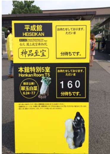
東博於館區入口設立之等待時間告示

示，博物館辦理展覽與電影院推出新片不同；電影票房高峰常在上映後數週，博物館展覽會參觀人數則逐日增加。錢谷館長指出，「神品至寶」正式對外開放首日，觀眾非常踴躍，估計達六千人次以上，排隊平均近三小時始得入場；就陰雨不斷的平常工作日而言，已屬最佳成績。因此，他對於展出成功充滿信心。