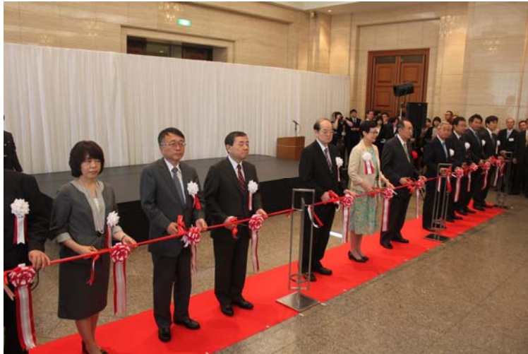
「神品至寶」展覽開幕剪綵儀式

致詞結束，東博錢谷館長、本院馮院長、日華議員懇談會平沼會長，以及其他八位文化界、媒體界重要人士，共同主持剪綵儀式。禮成，東博特別舉辦「神品至寶」內部觀覽會，開放到場來賓入內欣賞。日本人重