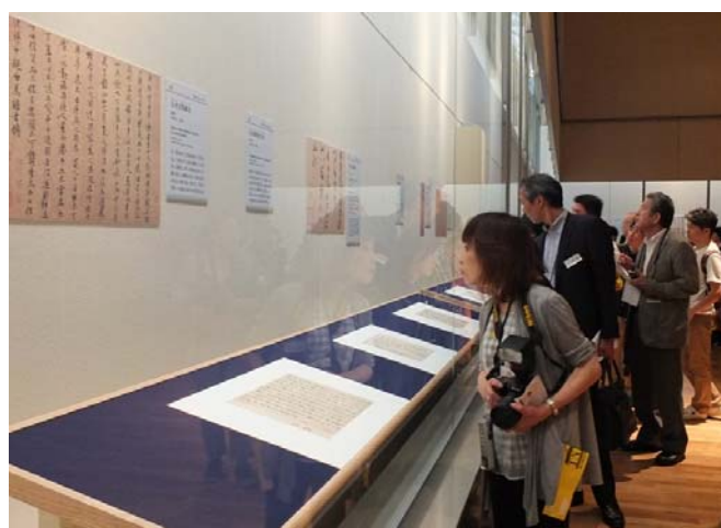
來賓參觀展覽情形

所展陳的文物，俱為本院器物、書畫、圖書文獻最具代表意義的藏品，在東博精緻的美工設計與調和的燈光照明中，益顯典雅莊重。日本觀眾置身其間，每為中國古代藝術家之設計巧思與精絕技法所震懾，驚豔讚嘆之聲不絕於耳。