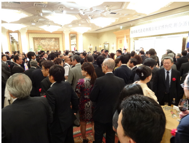
參加聯合酒會之各界來賓

觀眾於欣賞故宮文物展覽的同時，亦得親身體驗中華美食文化。馮院長致詞表示，故宮晶華座落於故宮院區，雙方自二〇〇八年起便緊密合作。所謂「國寶宴」，亦即由故宮晶華配合本院常設展覽內容，發揮文化創意，推出不同菜色，「將包括肉形石、翠玉白菜在內的文物，