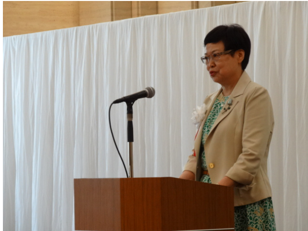
馮院長於開幕典禮致詞

「神品至寶」能在東京、九州展出，馮院長特別感謝日華議員懇談會諸君的努力，促成日本國會通