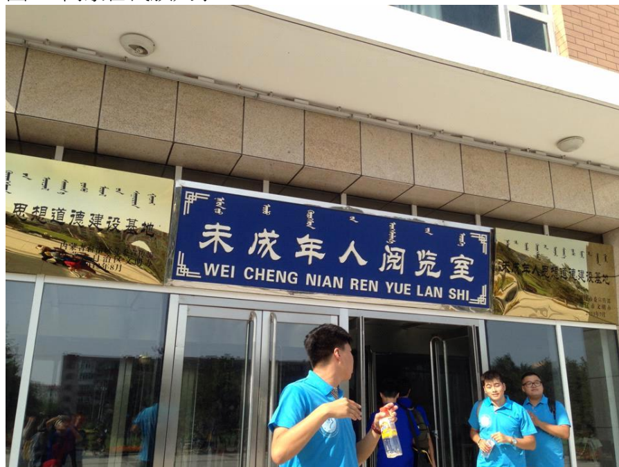
圖二 內蒙古民族大學