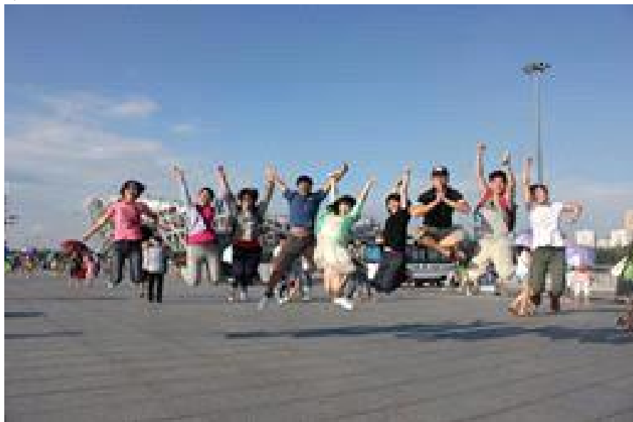
在趕趕趕北京鳥巢拍的跳躍照，我跳的最高！

還記得出國前，需要準備的文件都是在最後一刻才完成的，頗為害羞的我出國前也是抱著忐忑不安的心情，想著到底會遇到甚麼人會遇到甚麼事情，畢竟這是我的處女航！而如今八天中的點點滴滴直到現在還歷歷在目：想念蒙古遼闊的大草原，在草原上的奔騰、吶喊、騎馬、射箭，半夜星空下的鬼故事與流星，早晨裹著棉被差點凍死的美麗日出；想念搭上火車時雙眼帶著淚液的告別，火車上敞開心靈的談話，在能夠依賴的同伴身旁入眠；想念北京好逛的小街道，各個國家的奇異小吃看得眼花撩亂，雖然飲料很難喝，回去也狂拉肚子；想念每天和大家聊天吵成一片的時光；想念每天都期待不一樣的行程，期待著可以吸收到更多的知識與不同的文化；想念一抬頭就可以看到流星；想念蒙古認識到的夥伴們；想念那些敞開心靈的日子。