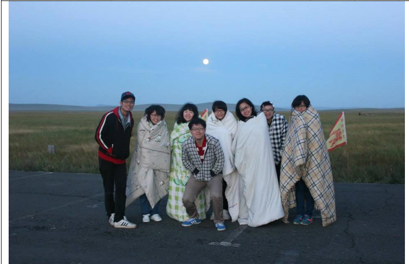
← 在大草原上裹著被子，從凌晨四點半等到五點多終於升起的日出