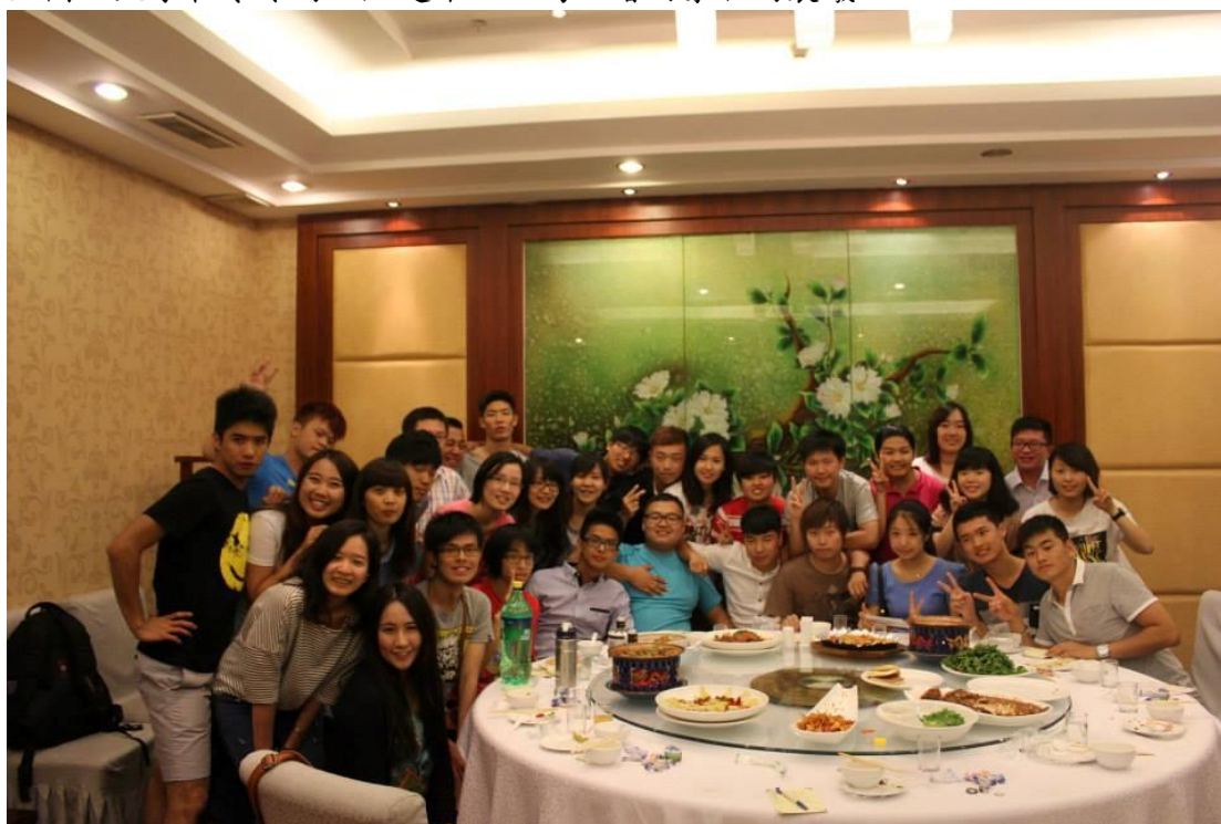
上圖：兩岸學生之間的友誼，在這個夏天譜下一段美好的回憶