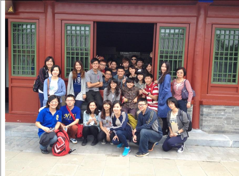
← 孝莊園 本次交流團的全體合照