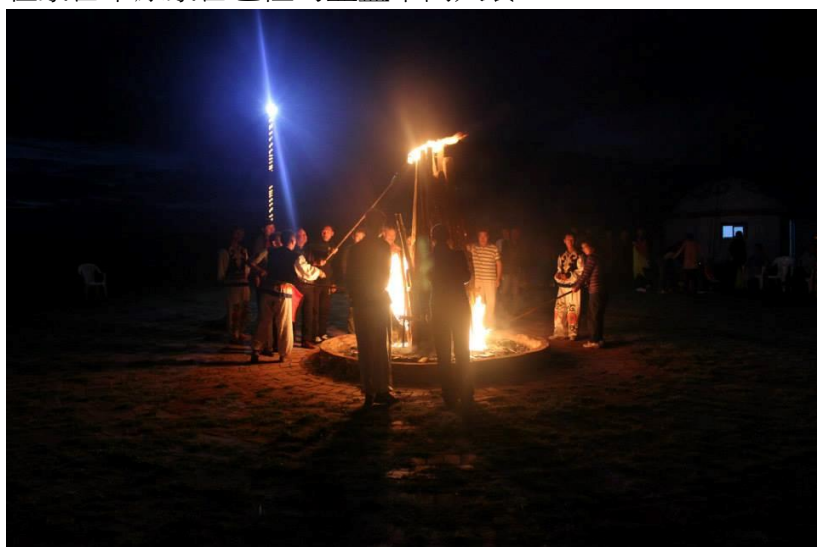
蒙古大草原晚上的晚會