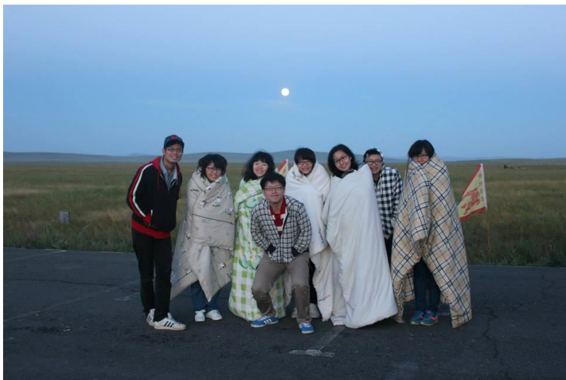
上圖：大家在寒冷的四點起床，只為一睹內蒙古的晨曦。