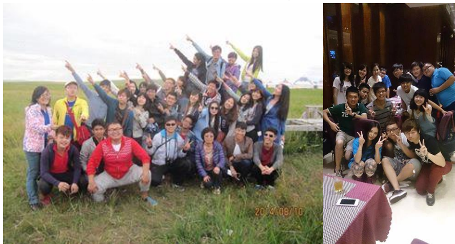
在遼闊的蒙古高原！彼一方是我的家鄉此亦是～ 吃完蒙古大餐的合照 我們大家都是好哥們好姊妹