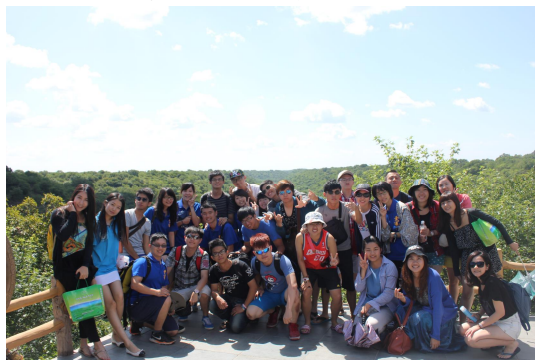
全團一起在大青溝自然保護區前所照的合影