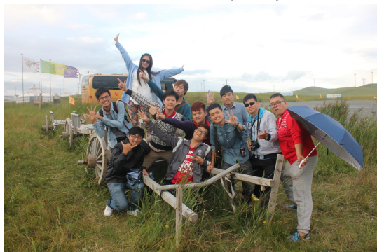
蒙古草原上交流團男生與當地學生合影

不論從蒙古到北京，從飛機上一下來便是交流的開始，不但沿途風光明媚，人文氣息與台灣明顯的不同。透過這次蒙藏委員會所舉辦的交流團，讓台灣的大學生能夠藉此機會探訪蒙古草原的壯闊，確實是一趟豐富身心靈的絕佳饗宴。在旅途的過程中，團長和領隊也盡全力的確保我們學員們的安全。在此還是特別感謝蒙藏委員會的籌備，才能致使這一次的蒙古交流團順利的完成，也使學員們對蒙古族能有更進一步的認識，也因為有這一次的交流團，才能在旅途當中認識到許多的新朋友。對這次的行程我也給予著相當高的評價，希望像這種營隊仍能繼續辦下去，使更多的大學生能了解塞外風光的美麗。