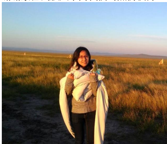
蒙古草原觀看日出

從過去的地理課本中所學，我一直都對蒙古的大草原有莫名的憧憬，而如今有幸達成了我的願望，一望無際黃澄澄而隨陽光射入的角度有所色彩變化的草原，這樣的景象依然深植我心。這次的旅程認識了許多蒙古與台灣各大專院校的朋友，每日的暢談也讓我們對世界與人生有不同的看法，短短的八天已經培養出濃厚的情感，也讓分離時刻特別令人感傷。最讓我印象深刻的草原生活，是在這次旅程中我最期待的一天，雖然因為氣候因素讓我得到小感冒，卻也無法抵擋住那種對深入與體驗蒙古族居民生活的興奮感，日夜溫差的確很明顯，但我們說好了一起在清晨四點欣賞日出。四點鐘到了，揉一揉朦朧的雙眼，走出蒙古包發現寒風刺骨，所以我們一個個都披上了棉被，站在草原的中央等著月亮與太陽交班，等了一個多鐘頭，我們看到一陣亮光從雲霧與山間灑落，那就是期待已久的日出，草原瞬間從夜幕中甦醒了過來，那一道曙光，是希望。多想由鏡頭來捕捉那美麗的剎那，但相機始終無法超越人的眼睛，那樣的美是怎麼拍也拍不出來的，只能把它收藏在記憶中。早晨的馬兒也起來幹活了，射箭、騎馬是體驗蒙古族生活所必須，所以在馬兒身上，我感覺到了在風中馳騁的滋味，是這麼樣的雄壯威武與瀟灑。而這天上午所攀爬的冰川遺跡也讓我難以忘懷，陡峭的山路伴隨小石子在滑動，這時就要發揮冒險犯難的精神，雖然路程不長卻感覺花了很久的時間，但登頂後一切辛苦都值得，看到的草原更遠更遼闊，那種心曠神怡的滋味，是無法用言語來形容的。隔天我們去大青溝旅遊區，漂流活動雖然在過程中衣服都玩濕了，但觀看周遭景色，林木參天，美不勝收，這片綠油油的景色，在小舟中瀏覽，別有一番風味。最後我們坐著臥舖火車前往北京，在與蒙古的朋友們分離時，無人不淚流滿面，也許要再見面不容易了，但這份情誼永存我們心中。在軟臥中一夜好眠，到了北京最讓我難忘的便是長城八達嶺，這是我第二次來這裡，人潮沒有上次多，走在上面又是另一種心情，想想古代的士兵身負厚重盔甲攀爬長城真是難如登天。回到台灣後剩下照片來重溫這些回憶了，點滴在心頭，感謝蒙藏委員會圓我一個夢，也謝謝蒙古民族大學對我們的熱情款待。