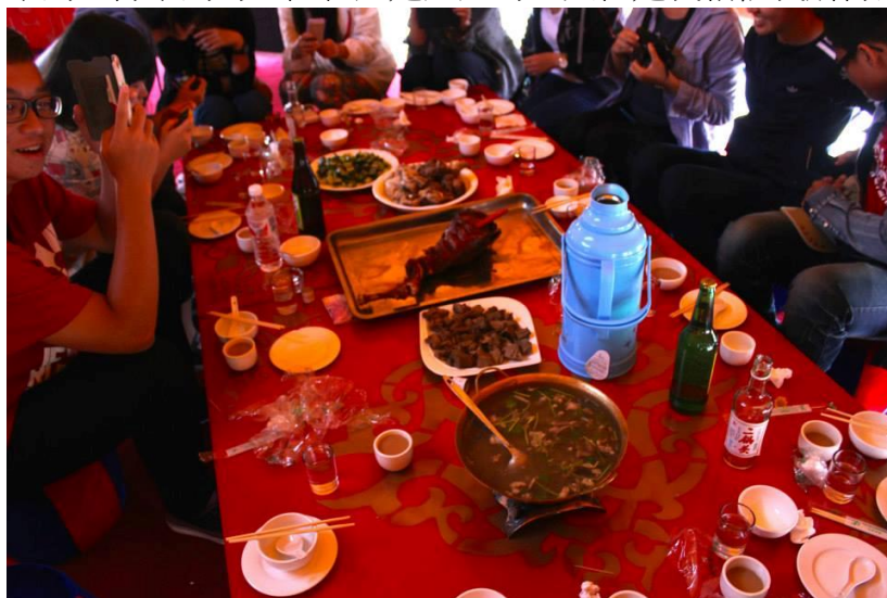
在蒙古草原蒙古包裡的豐盛羊肉大餐

這次的內蒙古旅程讓我見到了很多東西，而且也让我對中國的認知又多了一層。第一天到內蒙古的時候我其實蠻驚訝的，因為我以為內蒙會非常的落後，沒想到它竟然還有大潤發和渥爾瑪。通遼給我的整體感覺像是大自然融合成是產物，不會像大成是給你的壓迫感，可是同時你想要甚麼基本上取得都不會太困難。第三天我們去大草原的時候我更是驚訝，因為我從來不知道那些電腦裡的天空白雲和大草原會真的出現在我眼前，我終於體會到什麼叫做遼闊無邊，那些山丘和廣闊的草原還有那些有如藝術品般的白雲也有如鬼斧神工般的存在我眼前。這次去內蒙古我也學會了很多蒙古整體發展的歷史，並看到了很多古人的用的武器和衣物，我個人是非常喜歡讀歷史的所以能看到這些展覽對我來說是非常開心的。雖然這次去的景物和展覽都是非常新奇好玩的，但是這次讓我印象最深刻的就是民族大學招待我們的熱情，他們的熱情深深的打動了我的心，這勝過金錢也勝過任何稀奇珍貴的寶石。我想應該很少地方的人能跟你相處五天但在送行的時候能夠讓你感受到真正的不捨，這種感情用金錢是買不到也得不到的，儘管只是短短的五天但是我相信我所得到的超過了五個月。