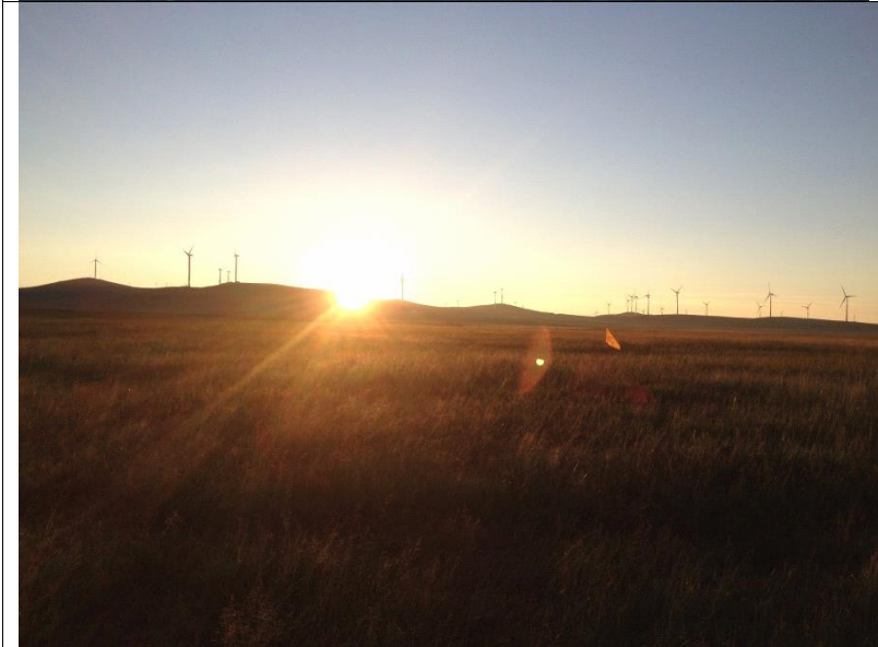
← 裹著被子從凌晨四點半等到五點多，終於升起的日出