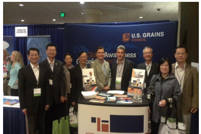
參加 2014 年出口交流會