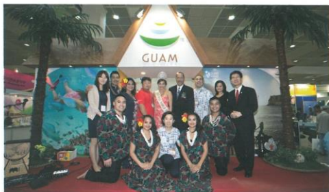
괌 정부관광청 임직원, 민속 무용단이 괌 관광청 부스에서 그동안 괌을 사랑해준 한국인 여행자 여러분에게 감사의 마음을 전하고 있다.