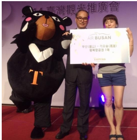
臺灣水晶龍造型高粱酒和釜山航空贊助 2 張釜山-高雄來回機票搭配住宿券，再 創午宴高潮