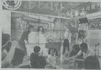
타이완 부스의 장원떡 DIY 체험 행사

관광객들은 줄을 서서 차례대로 요리사가 설명하는 대로 떡을 만들어 원하는 모양의 롤을 만들어 손수 가져간다. 만드는 방법이 단순하면 서도 재미있어 이국적인 취미를 느낄 수 있다. 이처럼 타이완을 대표할 수 있는 것이 음식문화다. 하카, 후난, 쓰촨, 일식, 한식 등을 모두 맛볼 수 있어 미식 왕국이란 별칭을 얻고 있다. 또한 채식, 아시안 먹거리, 샵샤브, 전통 마실거리들과 신선한 해산물요리, 열대과일 디저트, 전통 다과 등 모든 먹거리를 타이완에서 즐길 수 있다.