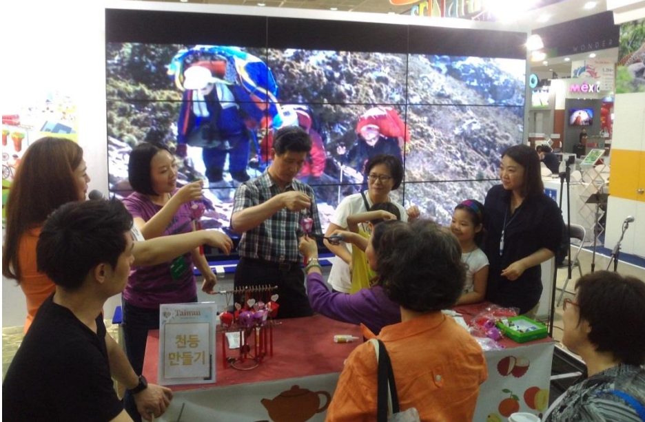
客家花布天燈 DIY，簡單又有祝福意義，大小朋友都喜歡