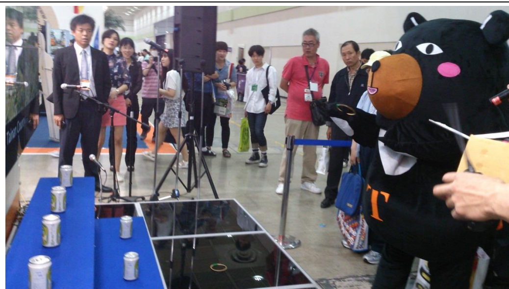
在臺灣館體驗臺灣夜市最熱門的套圈圈遊戲