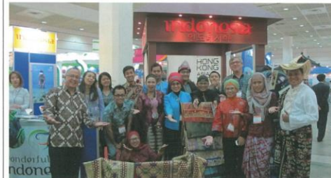
인도네시아 관광부 부스에서 인도네시아 KOTFA 2014 참가 대표단이 한국인 여러분을 아름다운 열대의 나라, 불가사의한 나라, 인도네시아로 초청하고 있다.