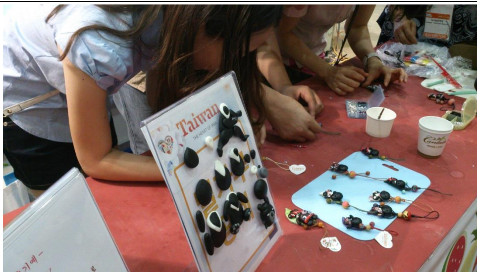
台灣喔熊捏麵人，老師一步一步指導參觀民眾做出獨一無二的喔熊