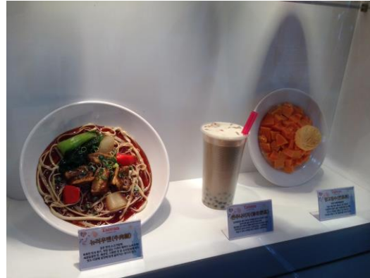
搭配觀光局「美食」的宣傳主軸，將臺灣美食模型陳列於臺灣館