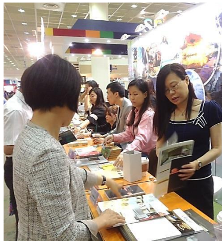
臺灣業者親切的和韓國民眾介紹臺灣