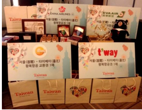
臺灣狀元糕、日月潭紅茶、文創茶杯組、臺灣陶塑、水晶龍造型高粱酒及 9 張機票搭配住宿券，創造活動高峰