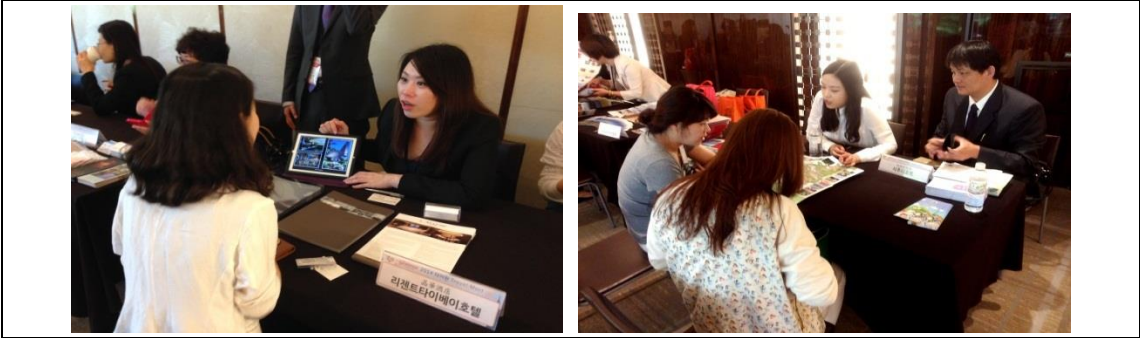
旅遊洽談會-臺灣業者與當地業者洽談甚歡