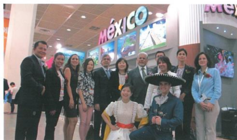
멕시코관광청 부스에서 Viva Mexico! 2014 WorldCup개최중, 날이 갈 수록 인기를 더해 가고 있는 남아메리카의 중심국가 멕시코! KOTFA에 참가한 멕시코 대표단이 반갑게 인사하고 있다.