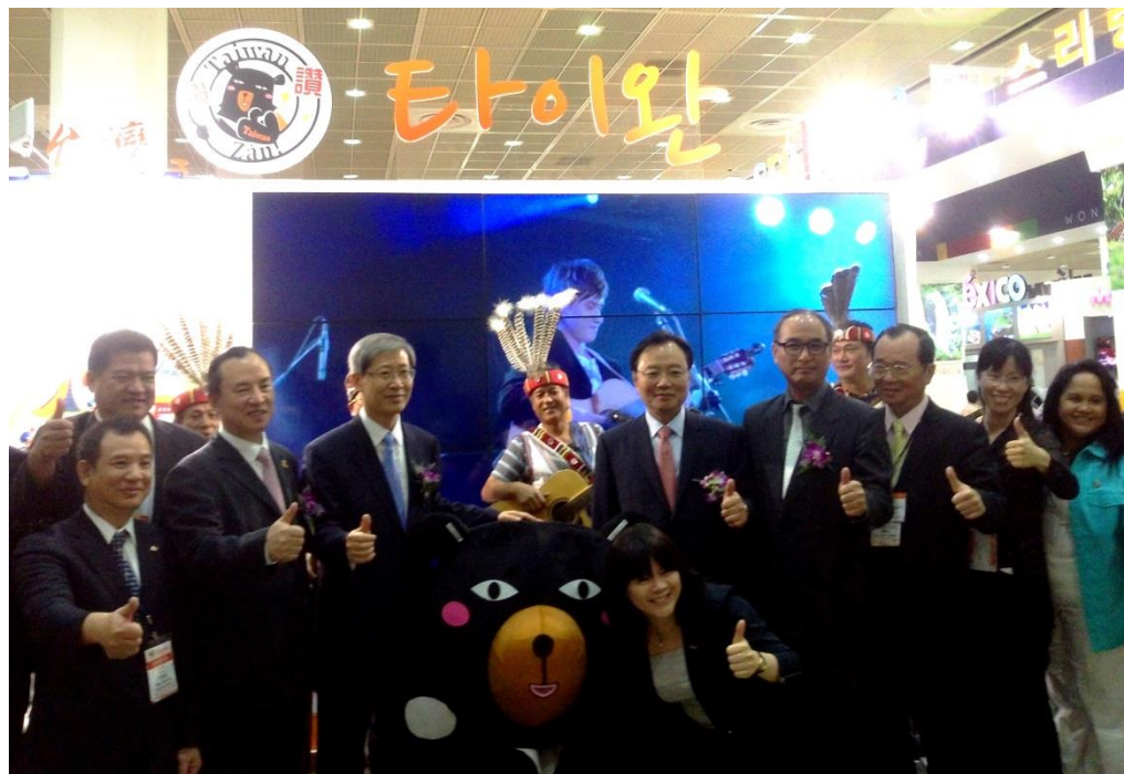
韓國文化體育觀光部第一次官趙顯宰、韓國觀光公社社長邊秋錫等貴賓前往台灣館與交通部觀光局國際組林坤源組長、駐首爾辦事處陳佩岑主任、台灣喔熊等合影