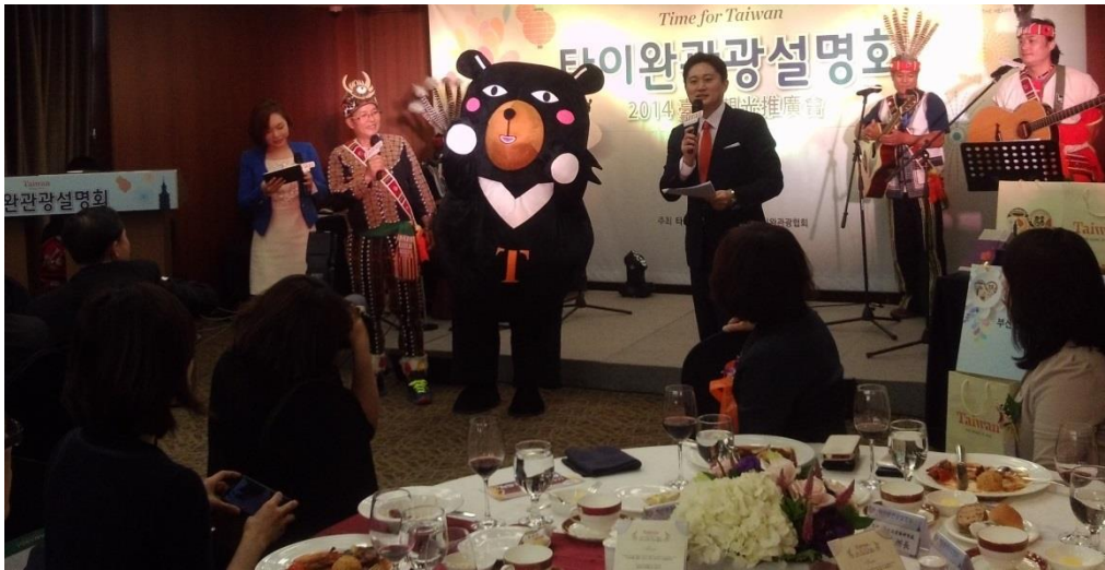
喔熊和檳榔兄弟介紹 11/9 在南投日月潭舉辦的自行車節