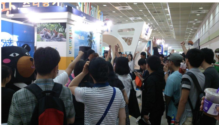
臺灣館舞台 Q & A 贈送台灣宣傳文宣和小禮品