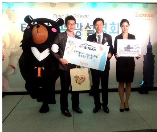
華航及釜山航空贊助 3 張機票搭配住宿券，創造活動高峰