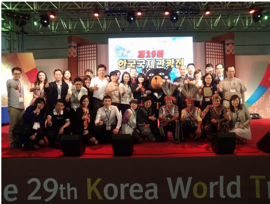
臺灣觀光代表團於韓國 KOTFA 旅展共同宣傳臺灣觀光