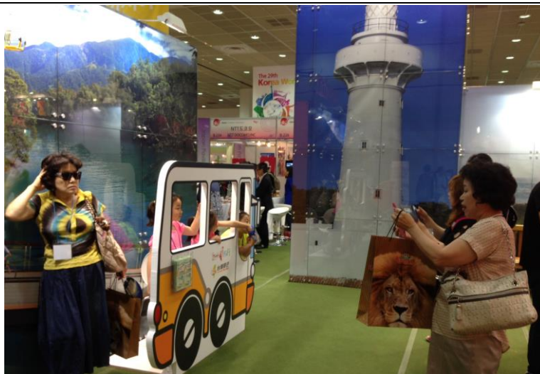
臺灣觀光巴士模型吸引大小朋友們排隊拍照，同時呼應「噗通噗通 24 小時臺灣 —與代言人趙正錫相約墾丁沙灘派對」於展攤設置墾丁燈塔