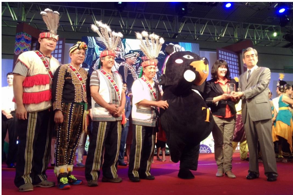
臺灣原住民檳榔兄弟和喔熊榮獲最佳表演團體獎