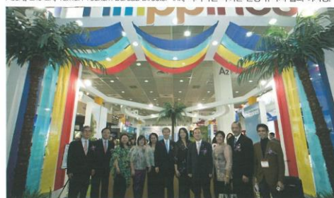
필리핀 관광청 부스: 지난해 1백만명의 한국인 여행자를 성공적으로 유치하여 회례를 모은 필리핀 관광청이 2백만명 유치를 위한 큰 회담을 다짐하고 있다.