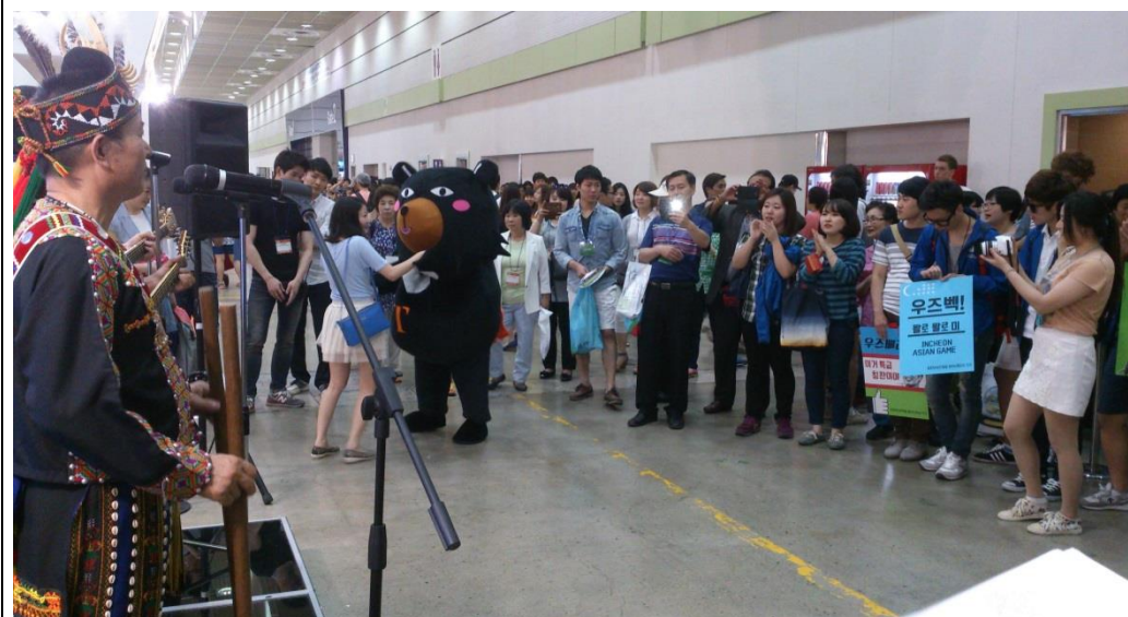
台灣原住民檳榔兄弟和台灣觀光代言人喔熊在台灣館演出，吸引大批韓國民眾圍觀