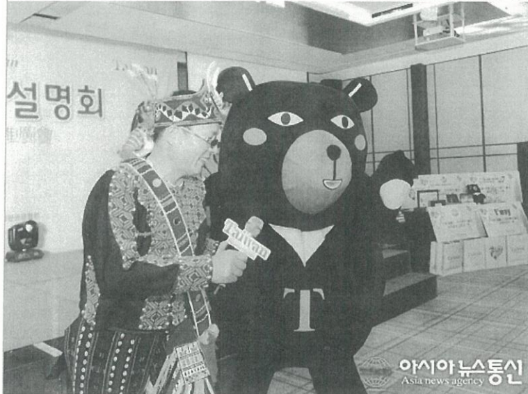
30일 오후 서울 소공동 웨스틴조선호텔에서 'Time for Taiwan 타이완 관광설명회'가 열린 가운데 타이완관광청 마스코트 오송 모습. 이 행사는 타이완관광청이 여행 성수기 시즌을 앞두고 한국 여행업계 및 미디어를 대상으로 B2B 트래블마트와 함께 최신 정보제공과 교류의 장으로서 개최했다.