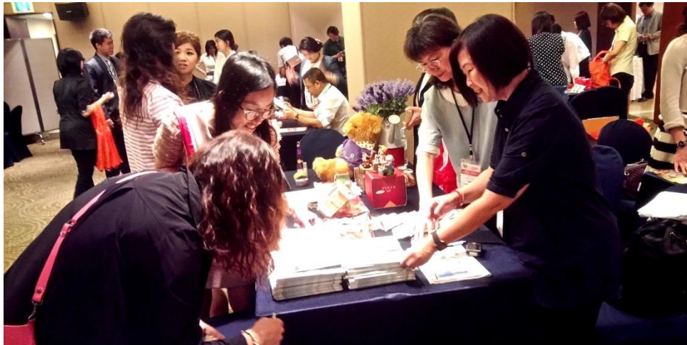
旅遊洽談會-臺灣業者與當地業者洽談甚歡