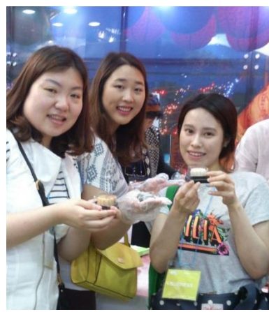
臺灣館規劃夜市美食區，鳳梨酥、綠豆糕 DIY 和現烤鳳梨酥大受歡迎