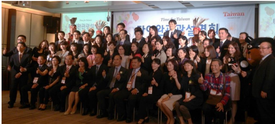
臺灣觀光代表團大合照