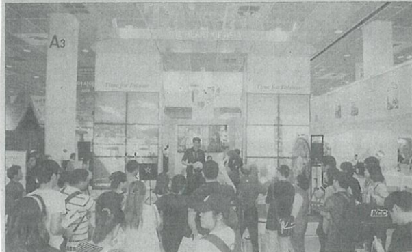
타이완관광청이 높은 성장세를 유지하기 위해 더욱 적극적인 홍보를 보이고 있다. 사진은 KOTFA에 참가한 타이완관광청 부스.