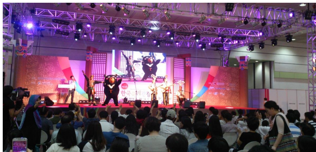
台灣原住民檳榔兄弟和台灣觀光代言人喔熊在大舞台演出，透過原住民歌曲和帶動唱，讓韓國民眾認識台灣