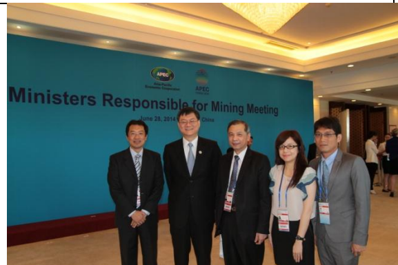
圖 7：我國代表團合影留念