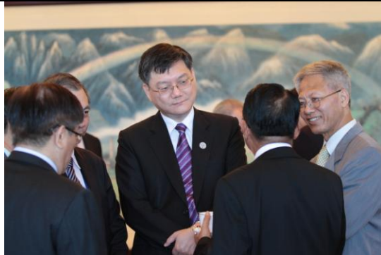
圖 3：杜次長與印尼礦業部長進行雙邊會談