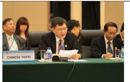
圖 2：我國代表杜紫軍次長於會中發言