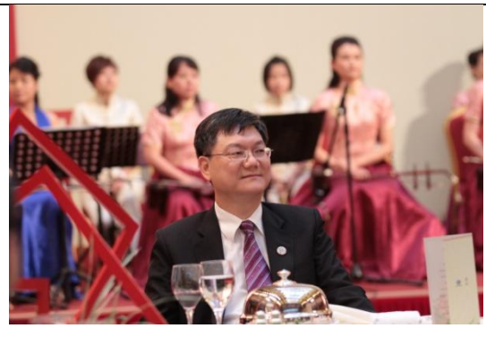
圖 6：杜次長參加部長會議晚宴