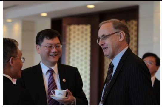
圖 4：杜次長與 APEC 秘書處執行長 Alan Bollard 會談