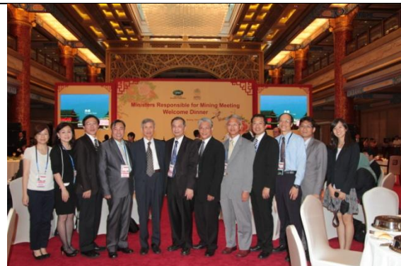
圖 5：我國代表團於晚宴合影留念