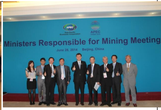
圖 8：我國代表團合影留念