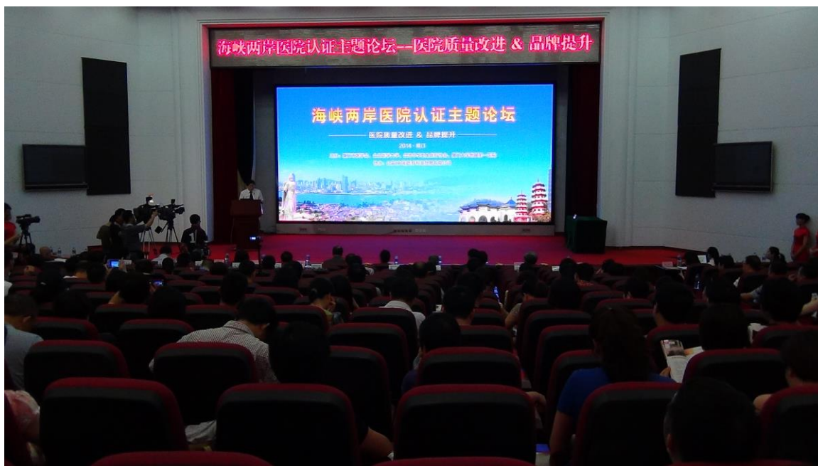
圖二、本案報告人向與會代表致意