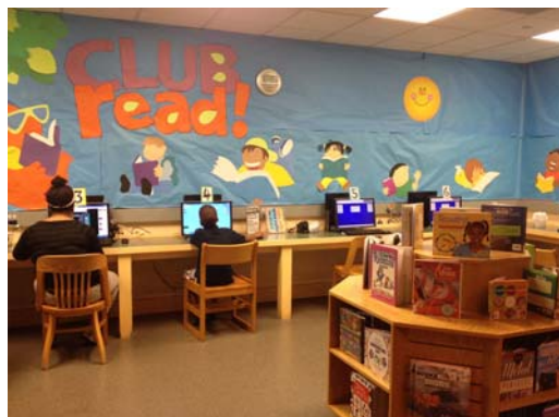
兒童資訊檢索專區