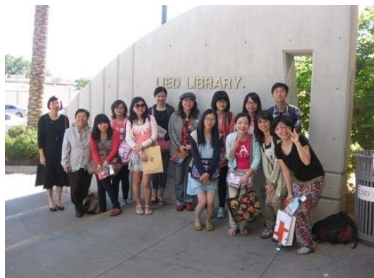
臺灣代表團於內華達大學圖書館合影