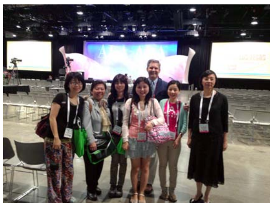
開幕式與 ALA 國際關係委員會