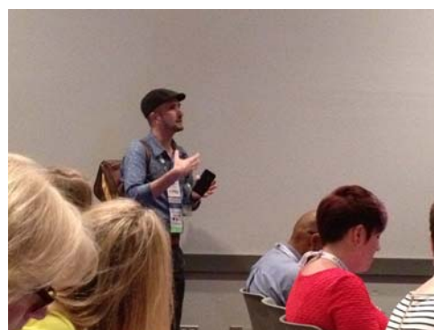
會場討論熱烈，發言相當踴躍