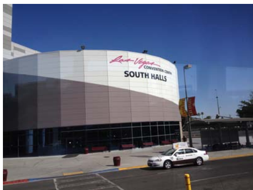
拉斯維加斯國際會議中心外觀