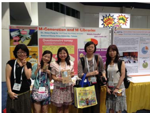
臺灣代表團海報合影