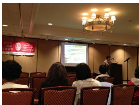
曾淑賢館長於 CALA 年會發表