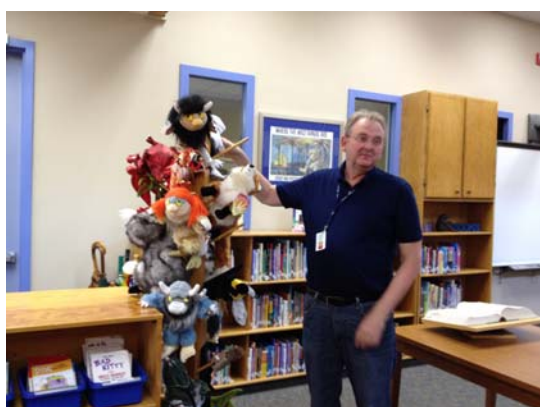
館員展示說故事時間的絕佳法寶