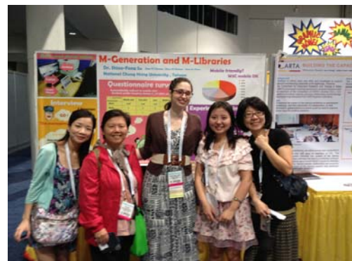
臺灣代表團與參觀者合影