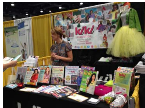
雜誌結合流行時尚衣物展示別具新意