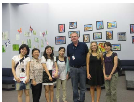
導覽館員與臺灣代表團合影