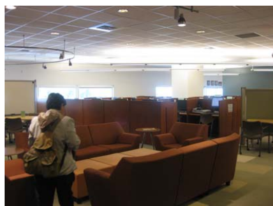
研究生資訊共享空間