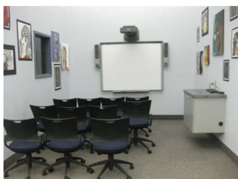
小型簡報暨研討空間