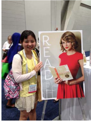
邀請明星 Taylor Swift 代言推廣閱讀