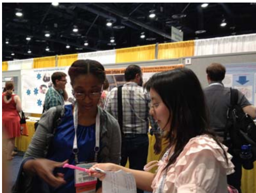
向紐約公共圖書館館員 行銷推廣本館服務