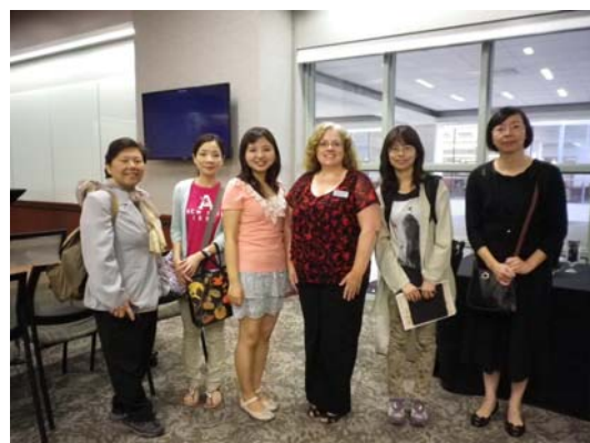
導覽館員與臺灣代表團合影