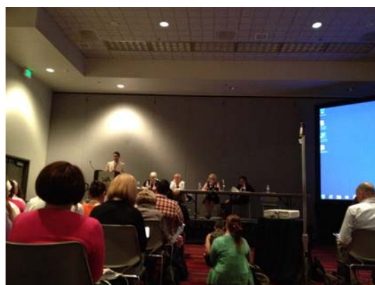
上課現場座無虛席，和大家席地而坐