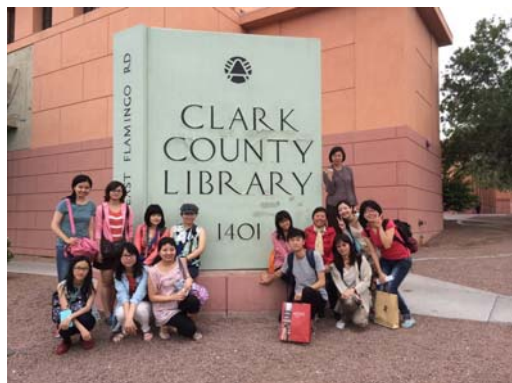
臺灣代表團於克拉克圖書館外合影