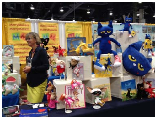
可愛的布偶童書區塑造活潑氣息