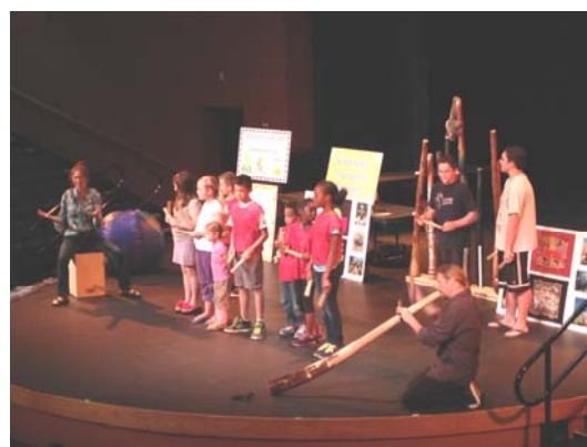
多元文化活動：澳洲原住民音樂表演