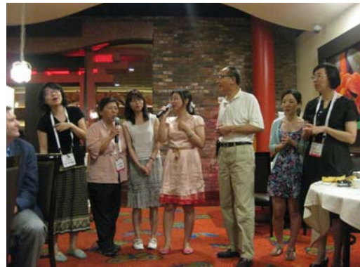
臺灣代表團於 CALA 晚宴唱歌表演