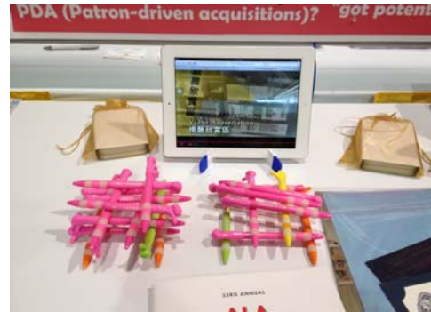
本館導覽影片及文宣品相當受歡迎