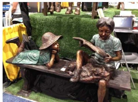
圖書館空間活用與公共藝術的體現