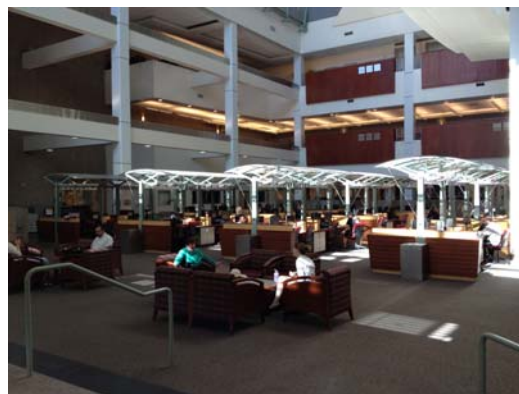
一樓大廳檢索區自然採光運用隔熱板 兼具美觀