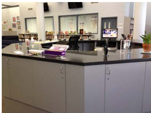
環狀開放式的櫃檯空間