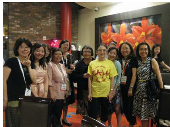
臺灣代表團與 CALA 重要成員合影