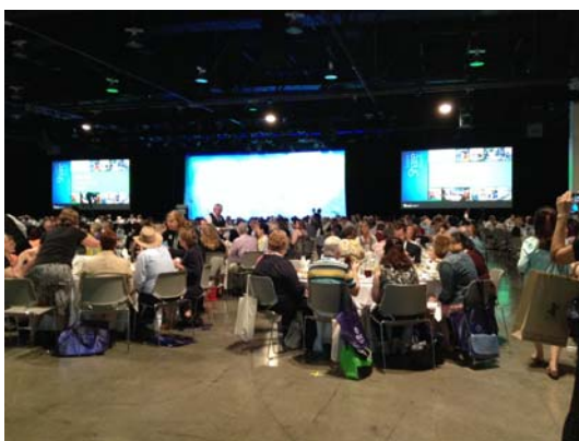
OCLC President's 午宴