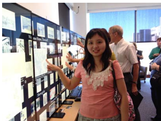
數位典藏實驗室運用推播螢幕展示藏品