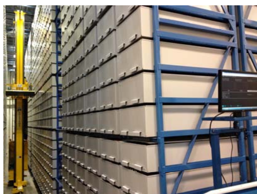
自動倉儲管理與特藏調閱服務