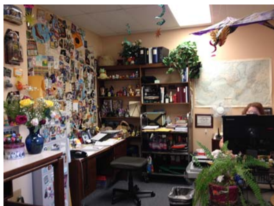
充滿創意與生機的館員辦公室