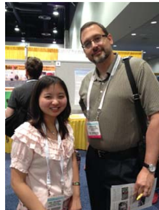
為哈佛大學教授解說海報