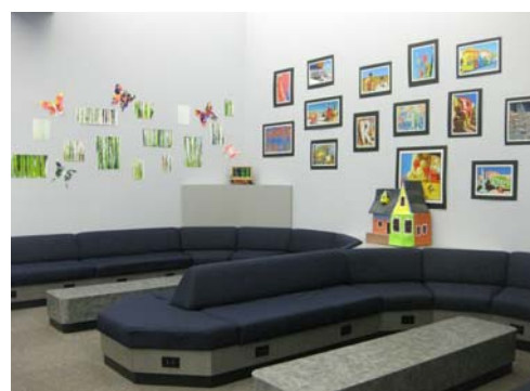
休閒閱讀區展示學生作品創意無限