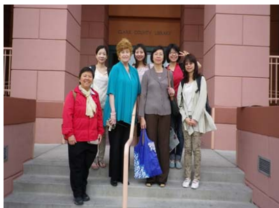
導覽館員與臺灣代表團合影