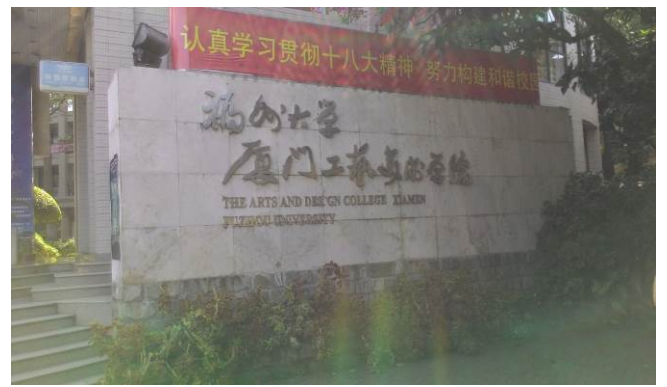
福州大學廈門工藝美術學院一隅