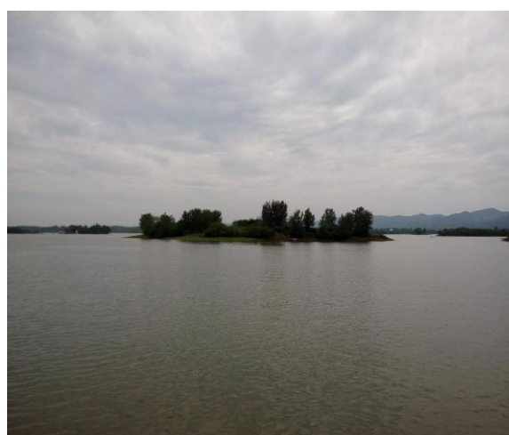
成都體育學院-新校區