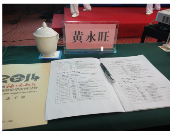
2014 海峽兩岸體育運動史研討會會場