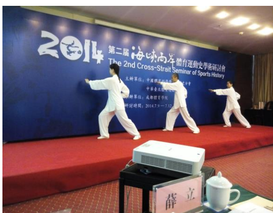
2014 海峽兩岸體育運動史研討會 -開幕典禮