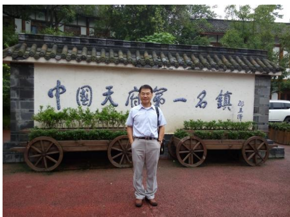
大陸天府第一名鎮-成都