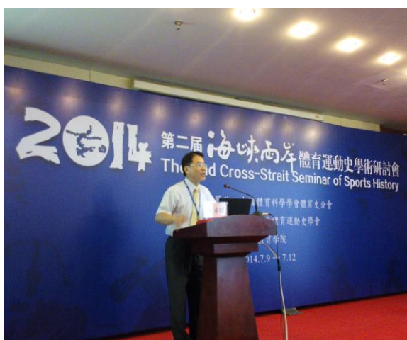
2014 海峽兩岸體育運動史研討會會場 -專題主持人