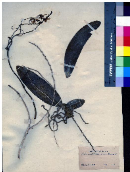
Segawa 採自小蘭嶼的：小蘭嶼蝴蝶蘭

此次在北海道也沒找到，似乎只剩下這裡了！所以直接去蘭科標本處，哇，真的在這裡，Yano 675 採自「紅頭嶼」！目前知道存在東京大學唯一一份矢野氏 1896~1897