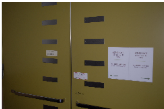
植物標本館—雙子葉植物