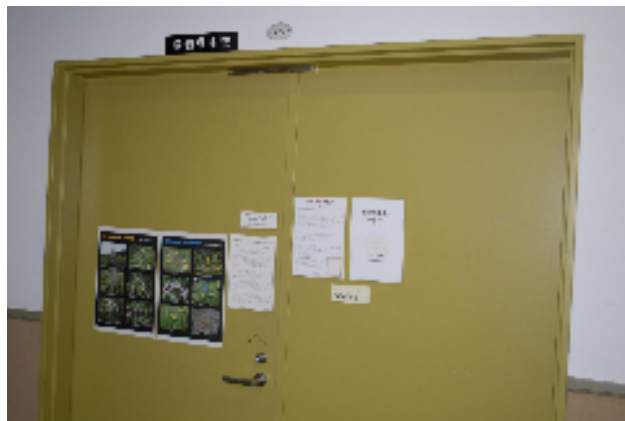
植物標本館—單子葉植物