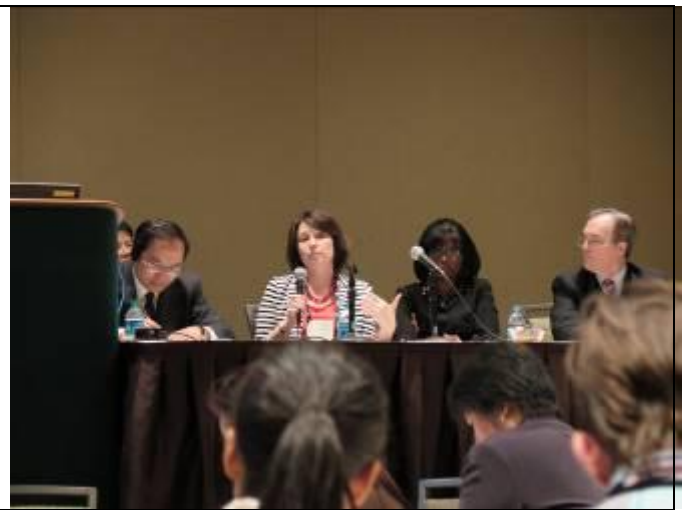
大陸及美方博物館產業代表