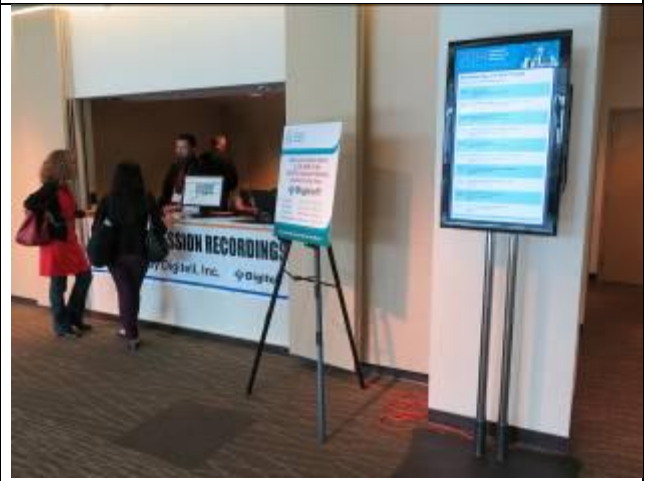
年會課程簡報及錄音洽購區