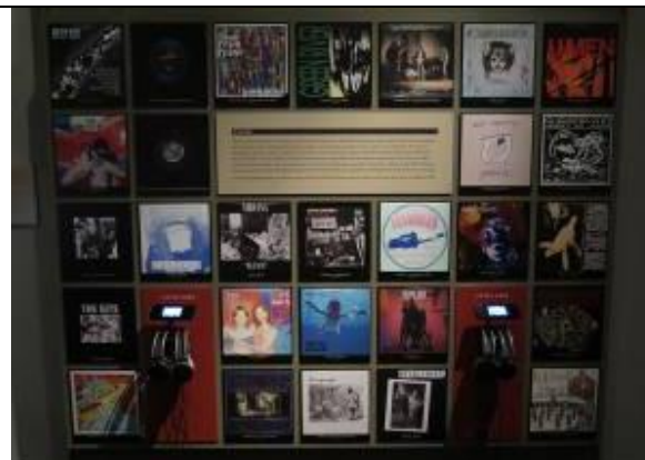
主題特展音樂視廳牆