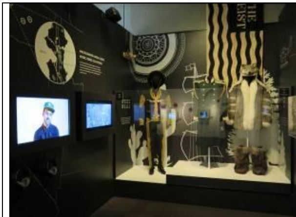
經典 MV 回顧區