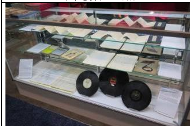
攤位展櫃陳列臺灣音樂館收藏史料