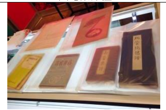
展櫃陳列南北管曲譜及重要出版品收藏