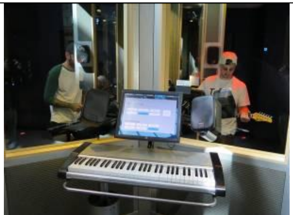
聲音實驗室之樂器體驗區