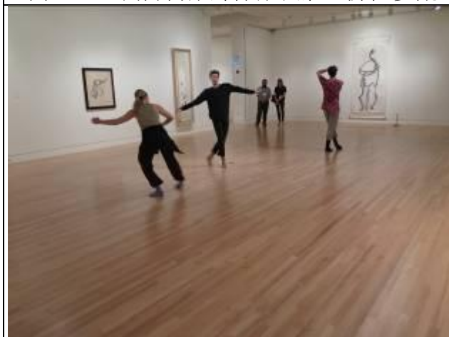
Frye 藝術博物館之夜安排舞者穿梭展間