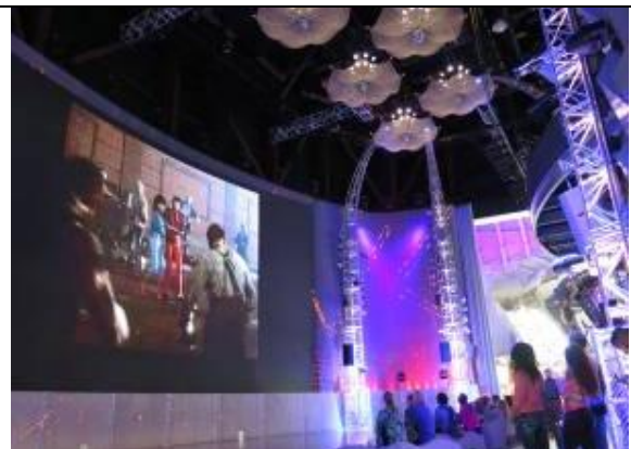
巨型 MV 輪播投影天幕