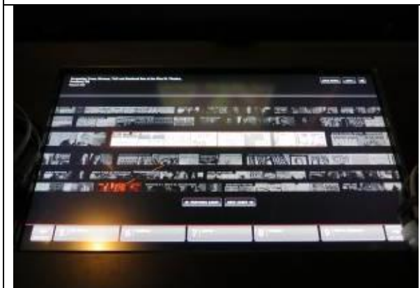
主題特展影音資料檢索機台