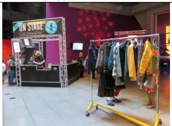
登台演唱體驗攝影棚