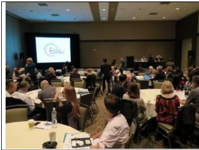
大陸及美方巡展交流會議現場

確的展覽描述文宣，內容需包含展品特色及件數、精美圖示、展區空間或坪數需求、展出價格等訊息，以利他國主辦單位評估是否邀展時，能有充份的資訊得以參研議。