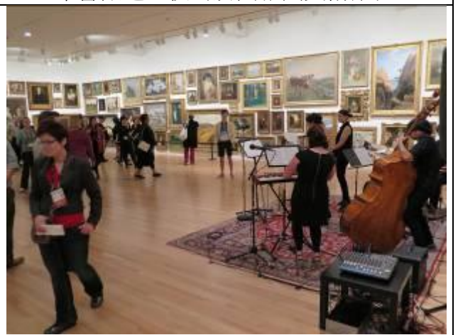
Frye 藝術博物館之夜安排爵士樂團演奏