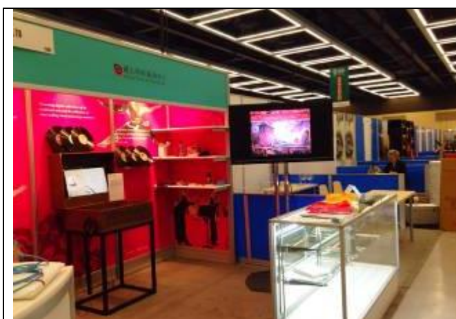
本中心攤位區外觀

本中心攤位展示重點包括三種媒介，包括：臺灣歌謠唱片數位體驗機台、臺灣音樂館典藏文物（手稿、曲譜、出版品）實體陳列，以及大型液晶螢幕不斷輪播本中心機關英文簡介、亞太藝術節及臺灣戲曲中心介紹影片，此外再加上印製紙本宣傳折頁，提供參觀者索取留存，透過多元方式建立本中心初次參展的機關形象。