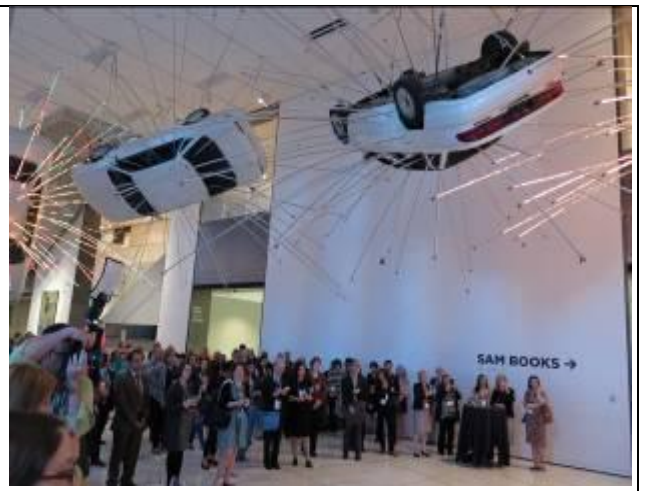
年會歡迎之夜（於西雅圖美術館）