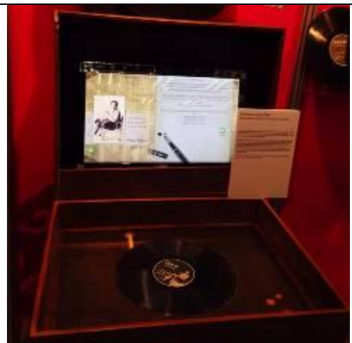
臺灣歌謠數位體驗機臺