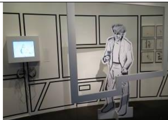
經典 MV 回顧區