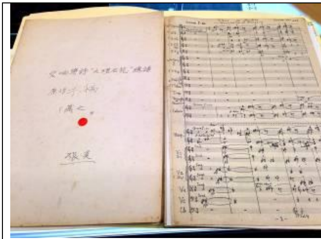
展櫃陳列臺灣重要音樂家手稿