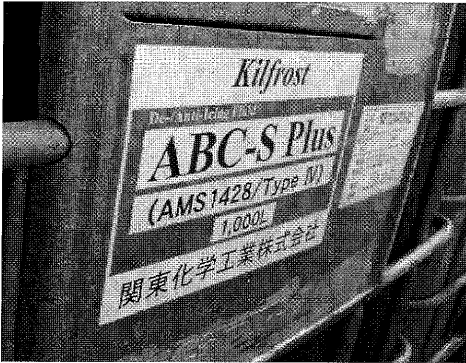
圖 6- 停機坪旁停放除防冰劑噴灑用車