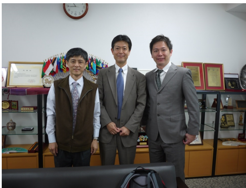
清水國際交流長、鄭主任與本人一同合照