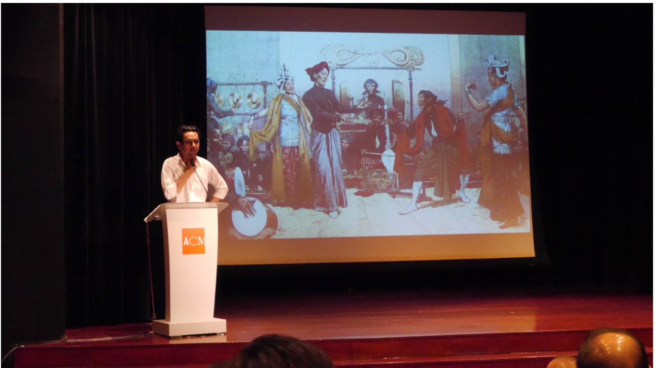
法里希·艾·諾爾演講