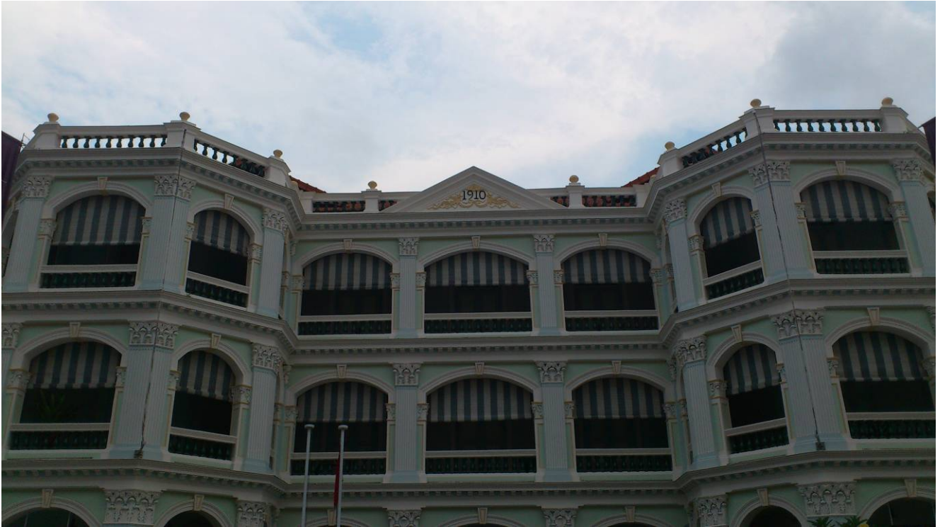
土生華人博物館建築外觀