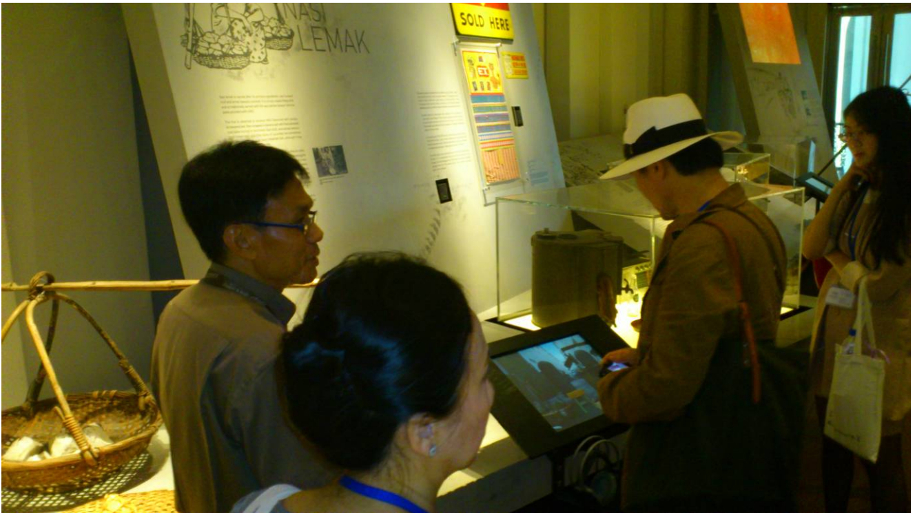
參訪新加坡國家博物館