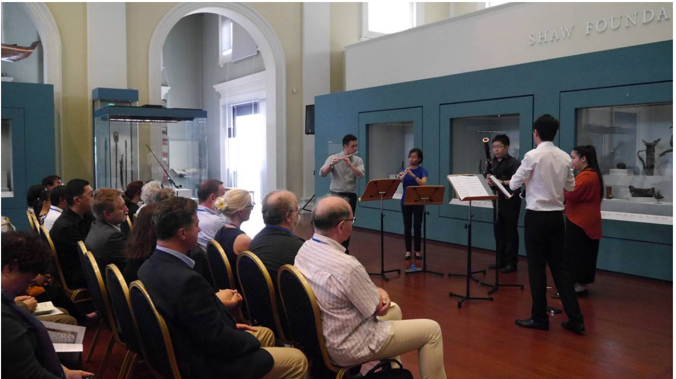
參訪亞洲文明博物館主辦單位安排之小型演奏會