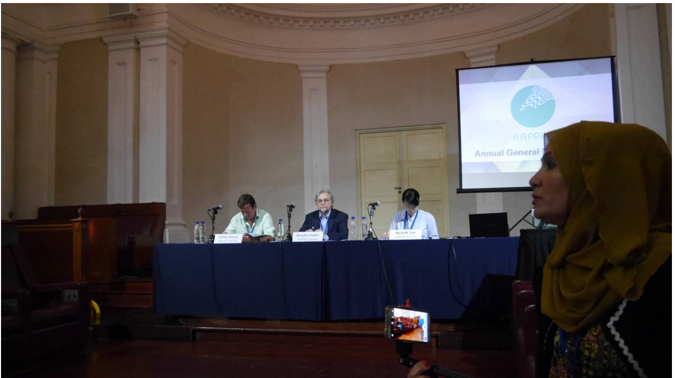
亞太表演藝術中心協會 2014 年會大會