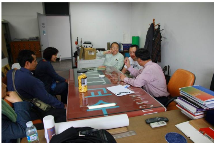
雙邊教學與學習討論交流