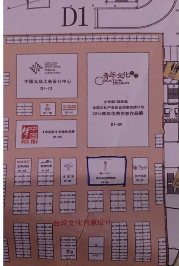
圖二十一、二十二：本院全銜載示情形(交易會參觀指南之封面及內頁)