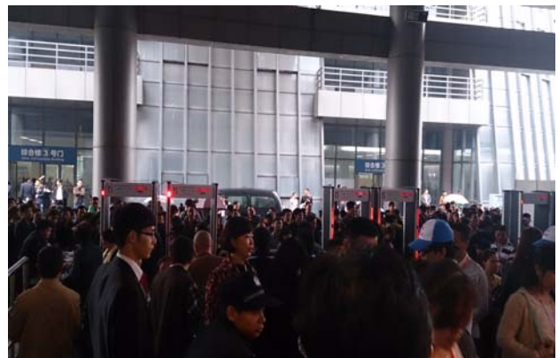
圖十一、十二：4月27日開幕，民眾入場參觀文化產品交易會情形