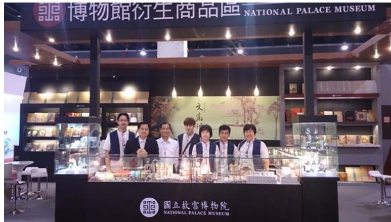
圖十九~二十：本院全銜載示情形(參展證、展位)