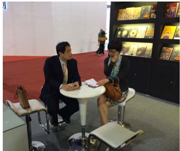
圖二十七~三十：本院同仁接受媒體採訪照片