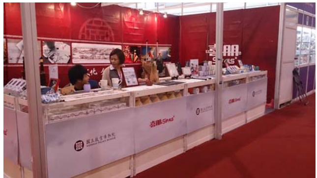
圖三十七~四十：交易會現場本院品牌授權合作廠商之全銜載示情形