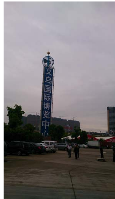
圖一~三：第9屆中國(義烏)文化產品交易會舉辦地點—義烏國際博覽中心