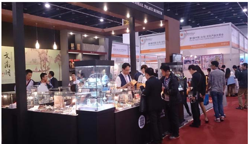
圖十三~十六：民眾參觀本院展區情形