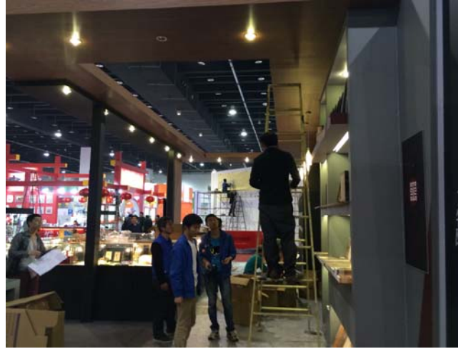
圖七~十：4月26日本院布置展場情形