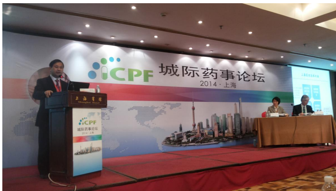
瞿介明，上海市衛生和計畫生育委員會副主任