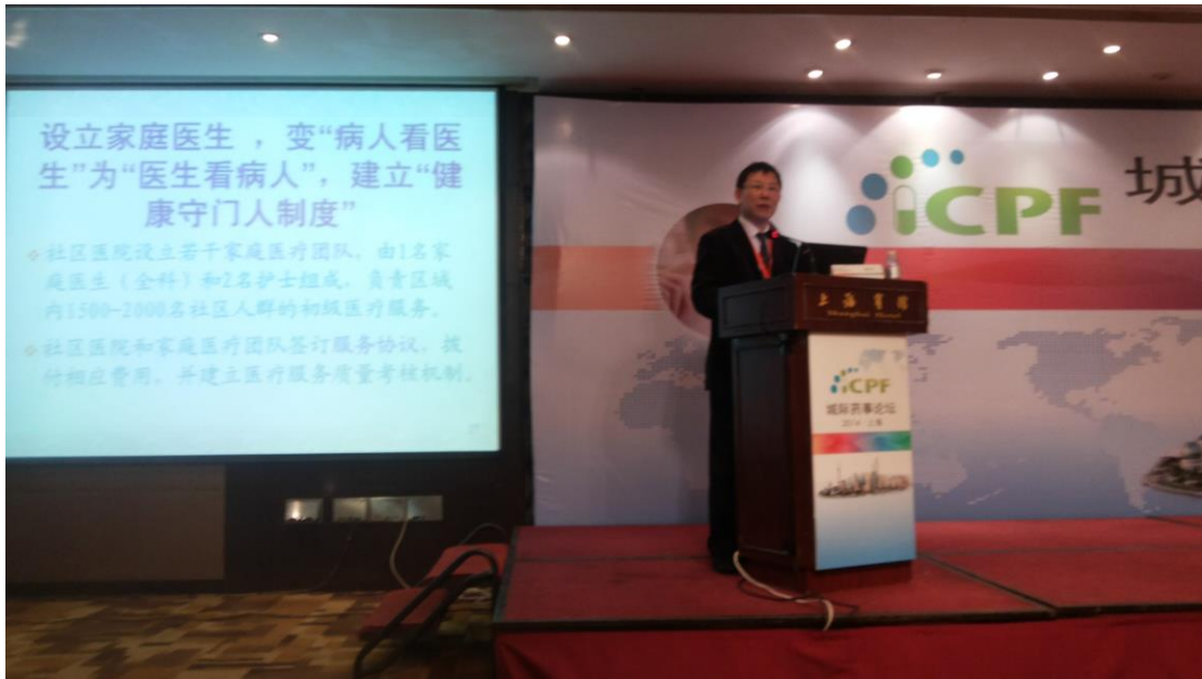
鄭樹忠，上海市人力資源和社會保障局副局長