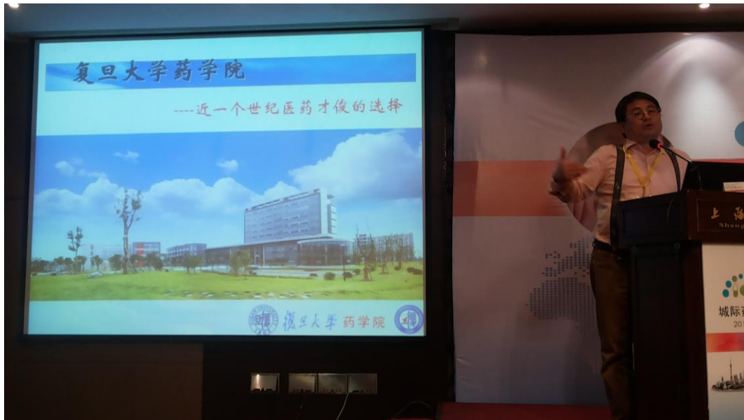
朱依諄，復旦大學藥學院院長，新加坡國立大學兼職教授。