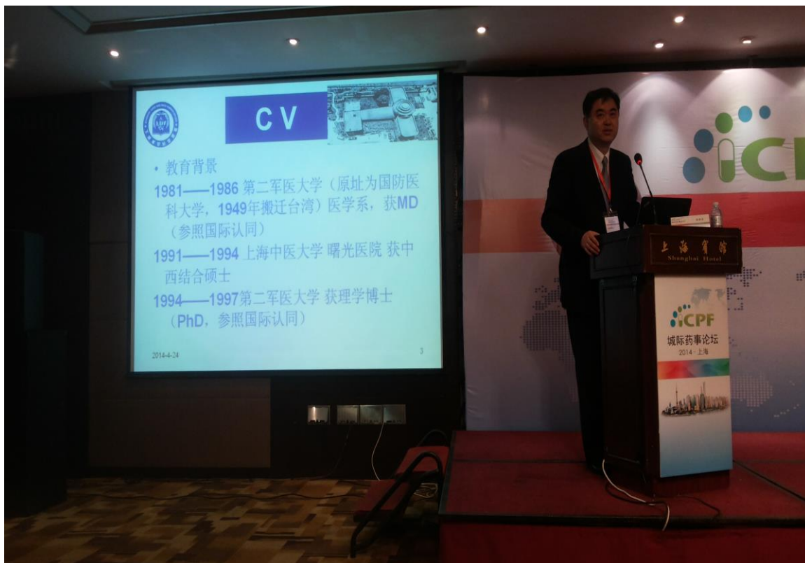
衣承東，上海市食品藥品監督管理局副局長