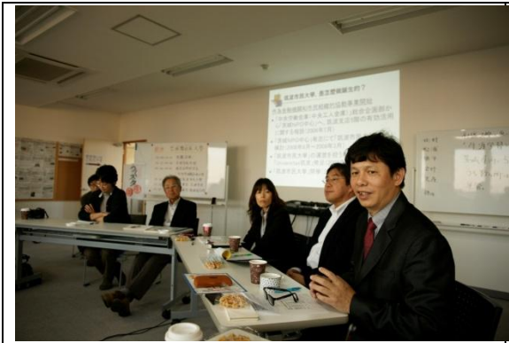
進行雲林社區教育之介紹與說明