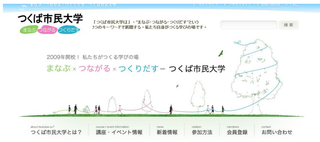
圖 2：筑波市民大學的網頁標舉出學習、連結與創出三項重點