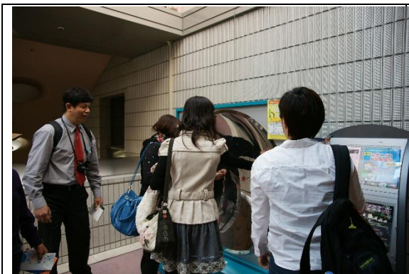
參觀博覽會會場設備與展示品