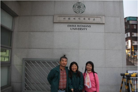
梨花女子大學參訪