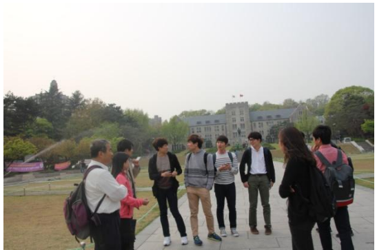
與高麗大學中文系男生交談