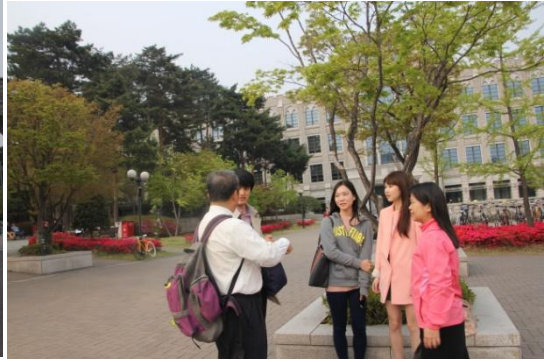
與高麗大學中文系女生交談