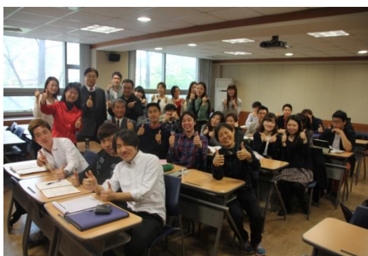
相談氣氛熱絡，大家合影留念