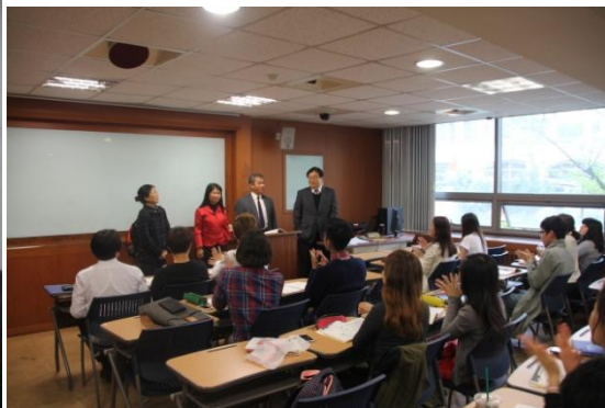
至中文系2年級教室行銷臺灣與本校