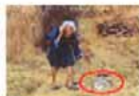
六旬老太产下通灵白蛇