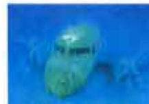
丐航海成“位置”终于确定