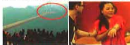
湘西惊爆冥界结婚事件 洞房夜丈母娘强行指导