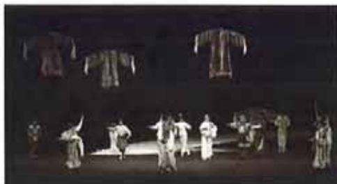
《水袖与胭脂》剧照

2014-04-21 08:10:48 来源: 东方早报(上海) 有0人参与 分享到