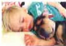
宝宝与前案亲密照