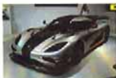
北京车展亿元豪车售罄