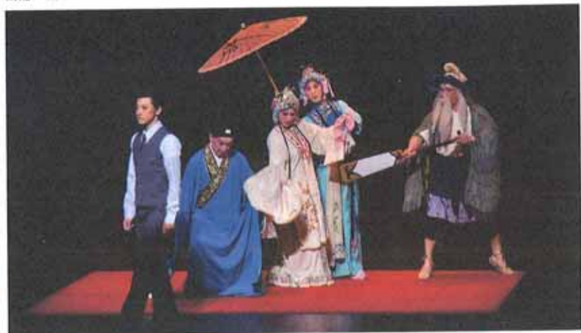
▲《百年戲樓》以劇演繹京劇百年史。

觀眾坦承，台灣京劇演員與師資拼不過大陸，因此「必須揚長避短突破困境，將京劇重新定位。」