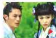
独家热播-金玉良缘

我个人非常喜欢，我看了《水袖与胭脂》，跟蔡老师想法一样，他们剧团，魏海敏当然没话讲，魏姐和唐文华，其他四梁四柱不是特别硬，但是他们是抱团的，能看到他们的理想是“在一起”。王安祈、魏海敏和李小平（“三部曲”导演），三个人是中心，所有人围着他们的理想。