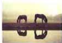
宁静低调的绝美风景