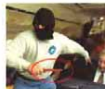
马航最后一张照片被发现