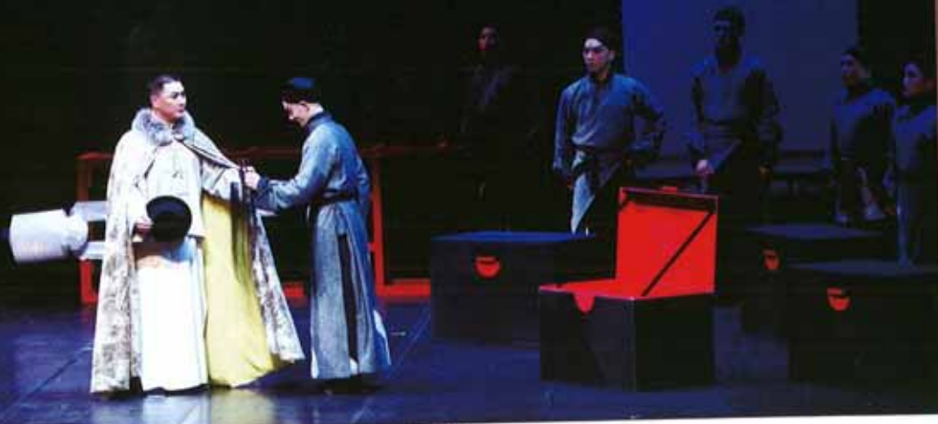
《百年戲樓》讓京劇人自述身世，講述京劇近百年來的歷史

劇唱腔身段結合之後，下一步將再開發那些文學筆法？」但大陸觀眾能接受嗎？習慣正統京劇觀念、看過各色好角兒的大陸戲迷，能理解我們的心嗎？