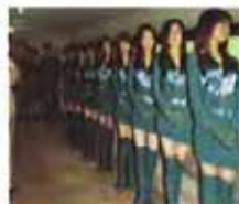
女子监狱不为人知的秘密