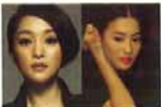
失恋后自暴自弃10大女星