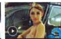
靓丽车模就是这个范儿