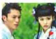
独家热播-金玉良缘