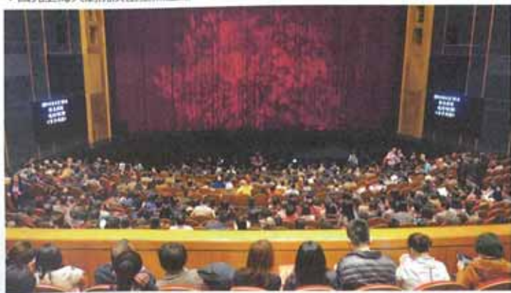
▼國光上海大劇院演出坐無虛席。