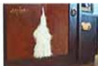
揭秘丽江茶马古道文化