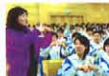
3步巧解数理化难题(图)