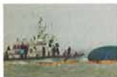
韩建捕失事客轮4船员