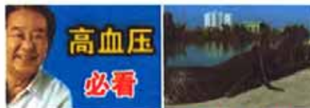
高血压发病根源大揭秘 动物园抓获百米巨蟒