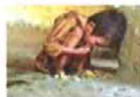
35张世界最惊人的照片