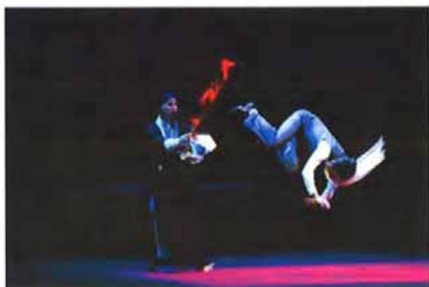
《百年戏楼》为“伶人三部曲”圆满收官【保存到相册】

新闻晨报讯 昨晚(4月19日),台湾国光剧团为上海观众带来的系列新编京剧“伶人三部曲”(《孟小冬》、《水袖与胭脂》、《百年戏楼》)在上海大剧院落幕。一周来的六场演出,谢幕时涌向台前的人浪,一场高过一场,观众中有老戏迷,有年轻人,更有一场不落的大陆同行们。