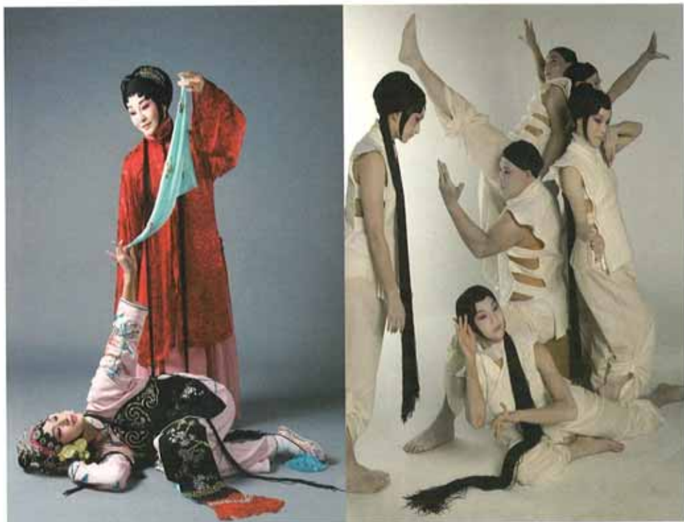
■ 《水袖与胭脂》宣传照

想和全团一起携手让京剧从剧坛挺进文坛。希望国光每一部创作都能成为当代文坛值得讨论的文学作品，活生生的、动态的当代文学作品。”