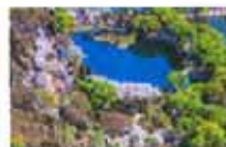
玉渊潭樱花盛开的时候