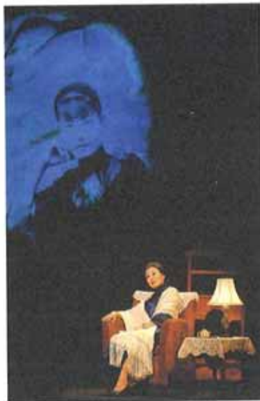
◀《孟小冬》敘述京劇名伶孟小冬追尋老生唱腔藝術的一生。