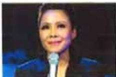
田馥钰退出歌坛揭娱乐圈幕