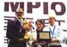
上海选手荣获国际冰...