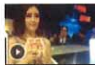
车模明星酷炫炫艺