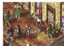
有集昔日兄弟攻城