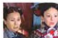
热播-宫锁连城 主演：陆毅/袁姗姗/杨幂/杨蓉/高云翔