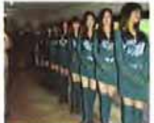
女子监狱不为人知的秘密