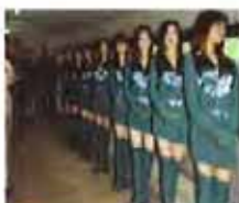
女子监狱不为人知的秘密