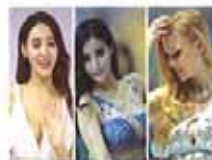
车展嫩模挤沟秀性感