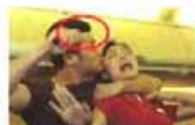
马航最后一张照片被发现