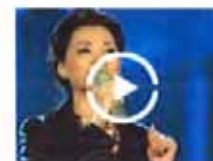
唯董卿远赴美国特产