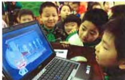
2D消防宣传动漫剧在沪首映