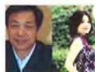
再曝与薄有染的女人