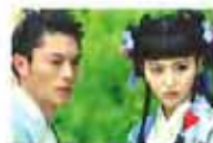
独家热播-金玉良缘 主演：霍建华/唐嫣/陈乔恩/袁米/黄明/于明

交流结束前，魏海敏深深地向到场的观众鞠了一躬，“感谢上海观众买票来看国光的戏”。对于自己所怀抱而又暂时不为大家了解的美好，艺术家表现出了最大程度的谦卑，令人动容。