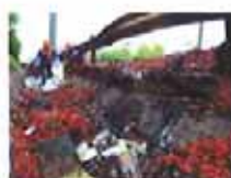
高速车祸市民抢辣椒