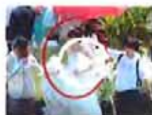
姚笛拍结婚戏尴尬