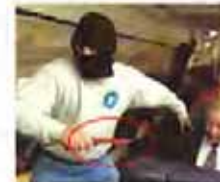
马航最后一张照片被发现