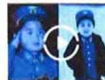
金正恩童年着军装威风