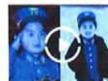
金正恩童年着军装霸气