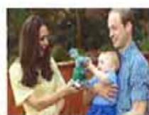
威廉一家参观动物园