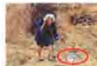
六旬老太产下通灵白蛇

我们习惯于在戏里找到答案，看情节看技巧，如果这出戏让我搞不懂，就觉得不是一个好戏，其实不是的。现在很多好的舞台剧和演出，都会让大家带着问题思考，虽然这个不是京剧的欣赏习惯，京剧都要讲清楚的。显然，“水袖”已经打破观剧习惯了。我意外的是，观众里