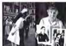
“胜利之吻”男主角病逝