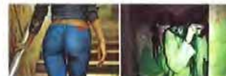
美女电梯上的惊魂一幕 女子地窖因禁10年曝光