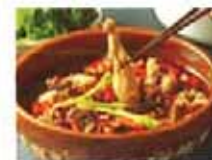
牛蛙寄生虫多 还敢吃吗