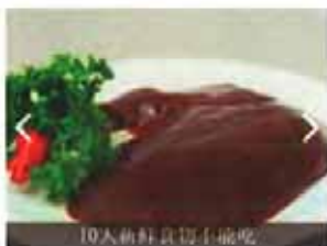
10大新鲜食品不能吃