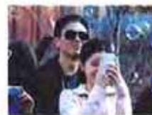
恋情引众“小天”扮躺枪