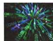
高速宽带何时能实至名归