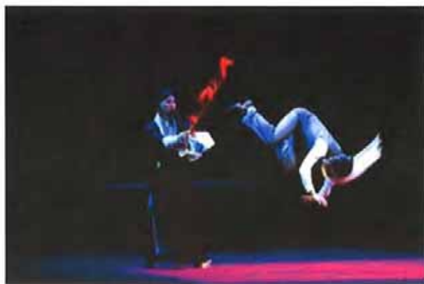
昨晚的《百年戏楼》为“伶人三部曲”圆满收官