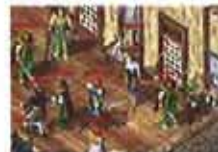
召集昔日兄弟攻城