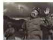
外国神剧中的中国军人