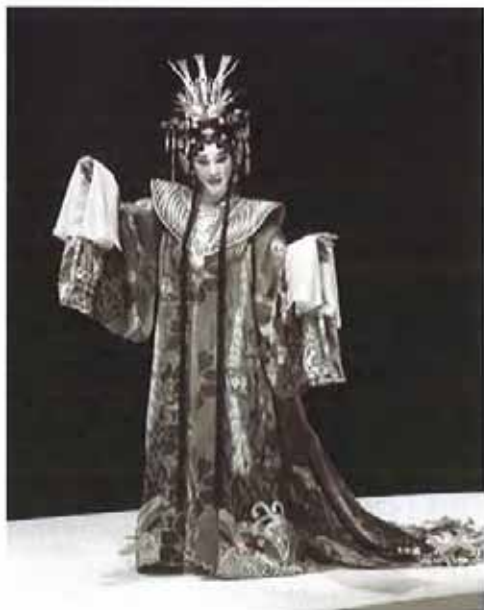
《水袖与胭脂》现场演出照。