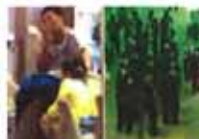
深圳发生恶性砍人事件