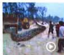
辽宁修路挖出140岁蛇精