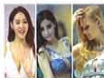
车展嫩模挤沟秀性感