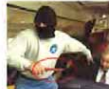
马航最后一张照片被发现