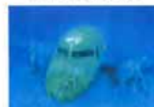
马航失联“位置”终于确定