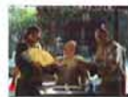
纪晓岚的男女纵欲

秦全耀：毛时代我们吃的真不如今天的猪狗狗粮 宋林家世起底：非出身豪门 宋林安排3人为情妇服务 望江亭：毛泽东曾几度亲自领唱、指挥的军歌 曹操惩治贪官污吏的奇绝手法：一视同仁不分亲疏 【博客视听】日本人眼中的中国什么样