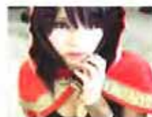
日本美女性感自拍狂潮