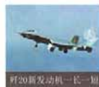
歼20新发动机一长一短