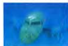
马航海底“位置”终于确定