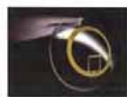
隐形眼镜内置摄像头

聚焦：谷歌苹果等科技巨头被指串通压低工资 朝鲜首次公布金正恩童年照片 螃蟹机器人下水搜人 云南一士兵持枪离队 当地悬赏 北京地铁票价将调整 网曝山西“证叔”有8个身份证 朝鲜或正准备核试验