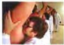
巧祛狐臭，腋下留香(图)