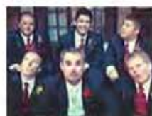
儿子讨老婆要花300万?