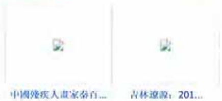
中國殘疾人畫家秦百...