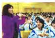
3步巧解数理化难题(图)