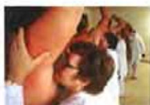
巧法驱臭，腋下留香(图)