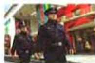
上海巡警民警佩枪巡逻 严格机制规范...