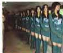
女子监狱不为人知的秘密