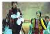
上海铁路迎来清明假期 返程客流高峰