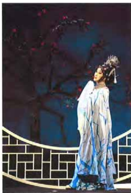
新编京剧《水袖与胭脂》剧照

上海大剧院原创戏曲品牌“京昆群英会”自2010年推出，向为梨园盛事。和国内其他戏曲展演不同的是，“京昆群英会”致力于推广两大“非遗”剧种京剧与昆剧，向观众普及中国最精致、最成熟的戏曲表演艺术。往年皆是盛邀国内各大重点院团参演，今年却由国光剧团一家从头唱到尾，将该团连续五年精心打磨的系列新编京剧“伶人三部曲”《孟小冬》、《水袖与胭脂》和《百年戏楼》完整呈现，堪称“京昆群英会”截至目前最创新、最大胆的尝试与举动。