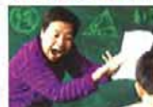
神奇3招！巧解数理化难题