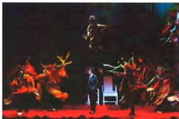
《百年戏楼》等三部先锋京剧将给中城观众带来别样感受

东方网4月12日消息:据《新闻晨报》报道,“现在真正懂戏的已经八九十岁了,而我们的观众绝不仅仅是他们,而是更广泛的艺文人口。”来自宝岛台湾的国光剧团,将从今晚起在上海大剧院,陆续为观众带来系列新编京剧“伶人三部曲”——《孟小冬》、《水袖与胭脂》、《百年戏楼》。在传统戏曲生态同样被挤压的台湾,国光走出了一条“先锋”的新路——剧目更强调文学性,形式上覆盖年轻观众的审美,逐渐培育出了一大批“既看‘云门’,赖声川和李国修,又看京剧的观众”。剧团艺术总监王安祈如是说。