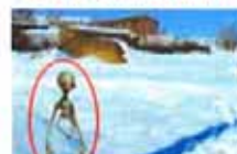
长沙市民拍到外星人(图)