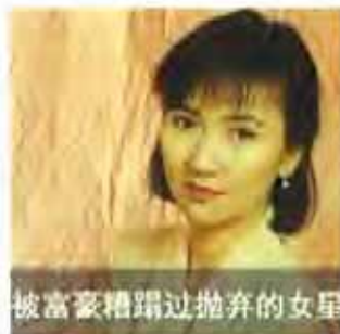
被富豪糟蹋过抛弃的女星