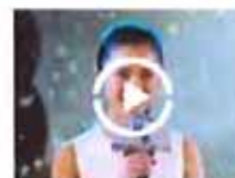
新一代“谋女郎”亮相