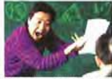
神奇3招！巧解数理化难题