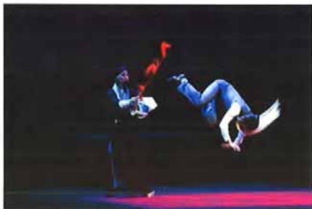
昨晚的《百年戏楼》为“伶人三部曲”圆满收官

2014-04-20 08:35:25 来源: 新闻晨报(上海) 有0人参与 分享到