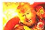
大闹天宫 主演：甄子丹/周润发/郭富城/夏梓桐/陈希思 甄子丹版美猴王震撼天庭