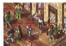
召集昔日兄弟攻城