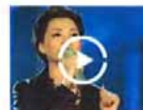
耀莹远赴美国待产