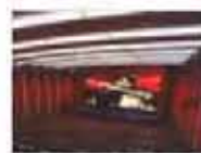
创根中国影院生财之道