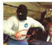
马航最后一张照片被发现