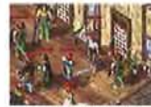
百集昔日兄弟攻城