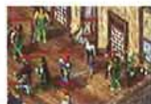
召集昔日兄弟攻城