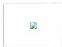
男子收集5000文胸 藏品来