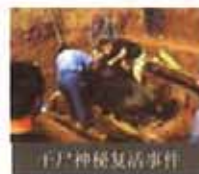
尸尸神秘复活事件