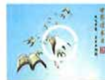
今天,我们为什么读书?