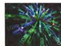
高速宽带何时能实至名归