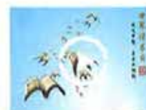
今天，我们为什么读书？