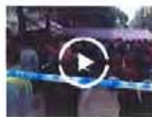
城管打死“劝架”老翁