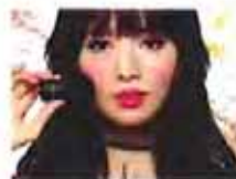
怎样正确辨别化妆品