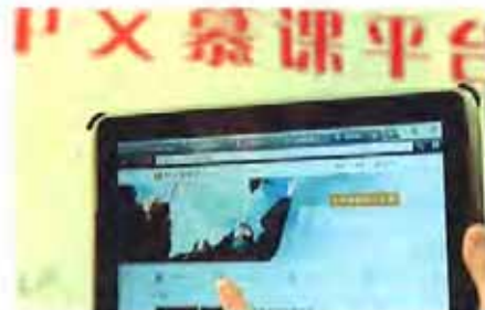
上海交大研发中文慕课平台“好大学在线”