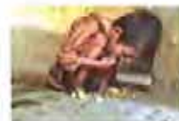
35张世界最惊人的照片