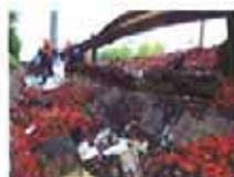
高速车祸市民抢辣椒