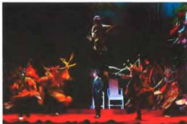
《百年戏楼》等三部先锋京剧将给申城观众带来别样感受