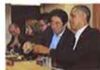
安倍请奥巴马喝清酒