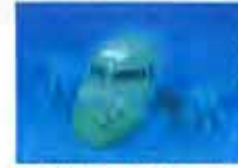
马航海底“位置”终于确定