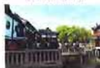
上海:清明假期游人如梭