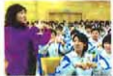
3步巧解数理化难题(图)