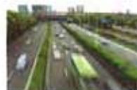
上海：车牌拍卖中标率