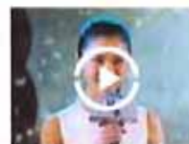
新一代“谋女郎”亮相