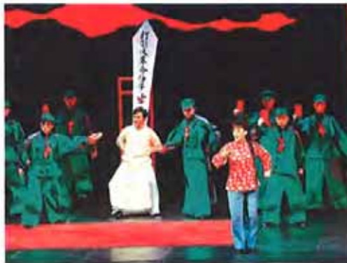
國光劇團在上海大劇院演出「百年戲樓」，其中文革段落演出當年伶人師生同被此罪「狀況」，最受上海觀眾注目。

伶人百年滄桑，由台灣劇團在大陸娓娓道來。國光劇團昨晚在上海大劇院演出「伶人三部曲」壓軸作「百年戲樓」，透過乾旦（男旦）、京派／海派京劇之爭及文革時代的伶人故事，訴說人性的背叛與和解，感動滿座上海觀眾，不少人哭著鼓掌。