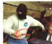
马航最后一张照片被发现