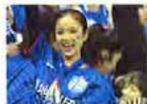
申花美女球迷围着台助威