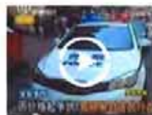
上海南京东路发生血案