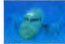
马航海底“位置”终于确定