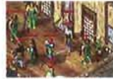
百集昔日兄弟攻城