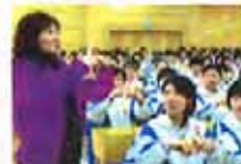
3步巧解数理化难题(图)