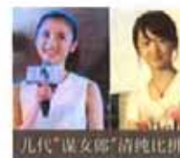
几代“谋女郎”清纯比拼