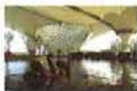
上海最大综合购物中心“世博源”即将整