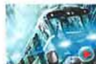
夺命地铁 主演：斯维特拉纳·库德钦科娃/谢尔盖·普斯科帕里斯/阿纳托利·比利