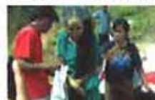
千年古墓走出活体女尸