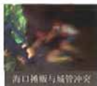
海口摊贩与城管冲突