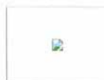
花样女神悲催前男友你知