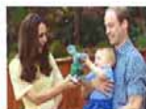
威廉一家参观动物园