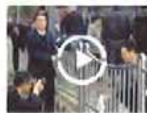
领导上街头扫除摆拍