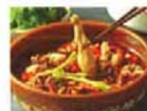
牛蛙寄生虫多 还敢吃吗