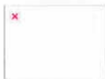
章泽天周冬雨等清纯女神