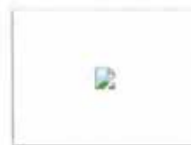
花样女神悲催的男友你知