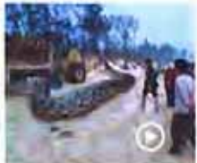
辽宁籍路挖出140岁蛇精