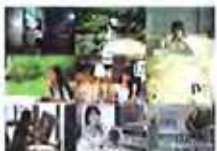
盘点西安高校校花美貌