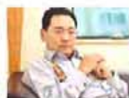
宋林后台快顶不住了