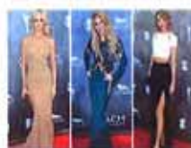
美国乡村音乐奖红毯