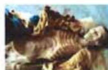
冥婚墓恐怖的开棺全程