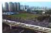
铁路清明送客709万人 同比增26%