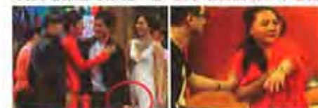
明星公开场合出糗瞬间 洞房夜丈母娘强行指导