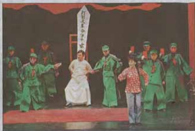
國光劇團在上海大劇院演出「百年戲樓」，其中文革段落演出當年伶人師生間彼此批鬥狀況，甚受上海觀眾注目。

【記者何定照／上海報導】伶人百年滄桑，由台灣劇團在大陸娓娓道來。國光劇團昨晚在上海大劇院演出「伶人三部曲」壓軸作「百年戲樓」，透過乾旦（男旦）、京派／海派京劇之爭及文革時代的伶人故事，訴說人性的背叛與和解，感動滿座上海觀眾，不少人哭著鼓掌。這也是文革悲情，首次在大陸傳統戲曲領域現身。上海京劇院當家青衣史依弘說，下半場以文革為背景，呈現京劇乃至整個