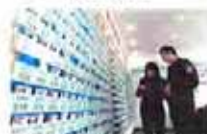
外来人员信息管理助力 平安社区