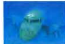
马航海底“位置”终于确定