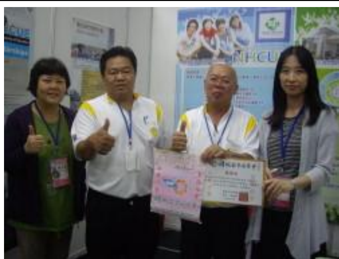
檳城留臺同學會致贈獎狀及錦旗感謝本校參加教育展