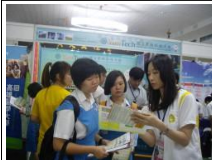
檳城教育展會場本校向詢問學生介紹本校招生系所及獎學金