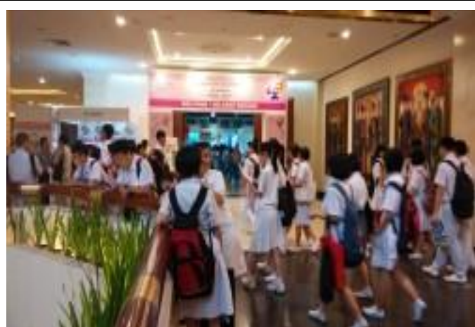
吉隆坡教育展入口及諮詢處，當地學生參與熱烈

當天下午並率領此次參訪學校的校長、副校長團拜訪了當地的馬來亞大學 (University of Malaya)。