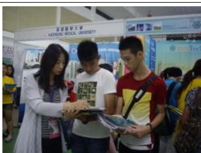
檳城教育展會場本校向詢問學生介紹本校招生系所及獎學金