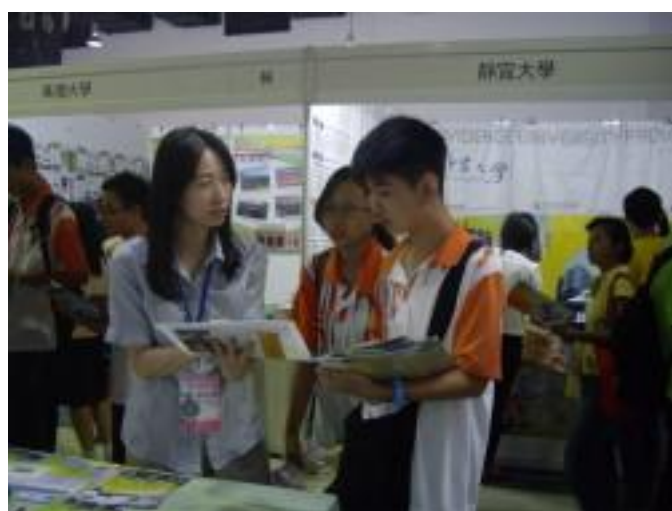
吉隆坡教育展會場本校向詢問學生介紹本校招生系所及獎學金

此次教育展招生對象除了僑生外，還包括了外國學生。展出期間本校工作人員除了介紹本校各招生系所的特色與課程、學校設施、校園環境、申請入學方式、日期、學雜費、獎助學金等外，也進一步釐清了學生對僑生與外國學生差別的疑問。此外，海外聯合招生委員會也在會場提供赴臺升學說明座談會，讓有興趣的學生及師長參加。本校除了準備學校簡介、單張文宣外，還準備了原子筆作為宣