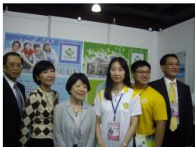
教育部黃碧端政務次長(左三)、我國駐馬來西亞臺北辦事處羅由中代表(左一)、馬來西亞留臺聯總李子松會長(右一)拜訪本校參展攤位