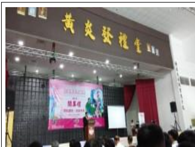
檳城教育展開幕式