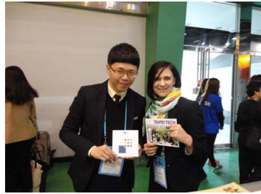
與立陶宛合作學校 VGTU 洽談後合影