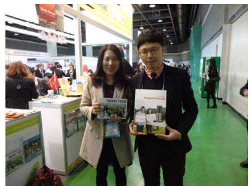
與韓國合作學校東國大學洽談後合影