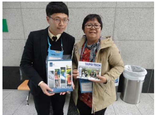
與印尼合作協議學校 ITS 洽談後合影