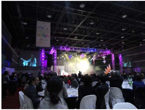
大會活動(Keynote & Gala Dinner)