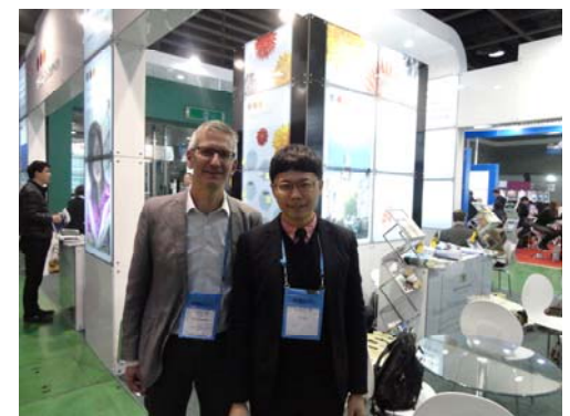
與德國合作學校 Karlsruhe 洽談後合影