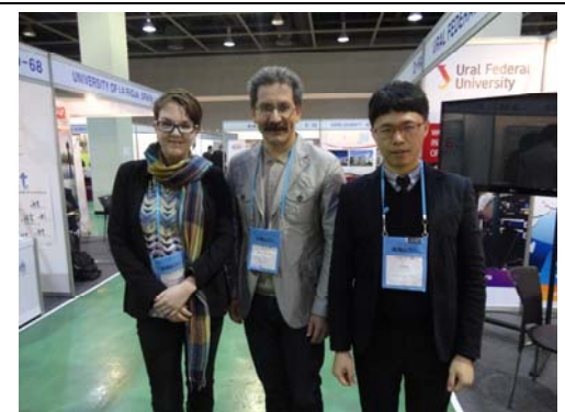
與俄羅斯合作學校 Ural 洽談後合影