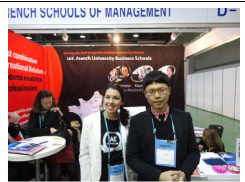
與法國合作學校 IAE 洽談後合影