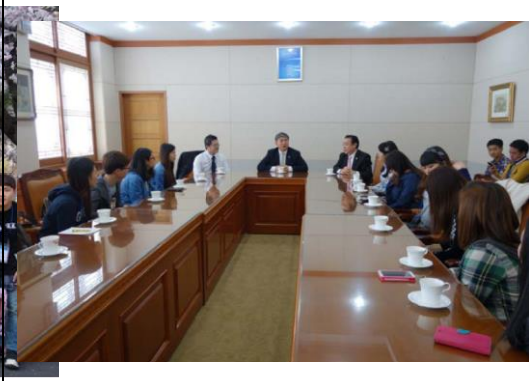
與光州教育大學校長交流會談