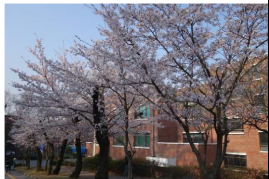
光州教育大學附小校園美景