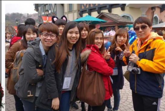
排隊搭柚木製雲霄飛車