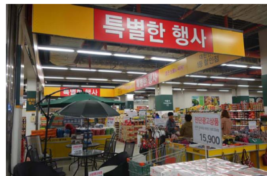
體驗韓國市場買菜