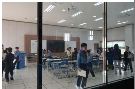
光州教育大學附小特殊教學室