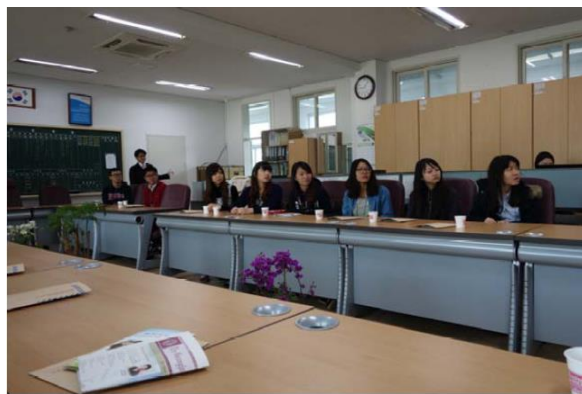
4/2 光州教育大學附小參訪