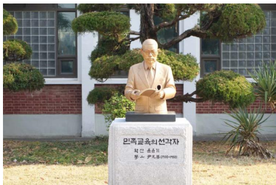
教育學院前的紀念銅像