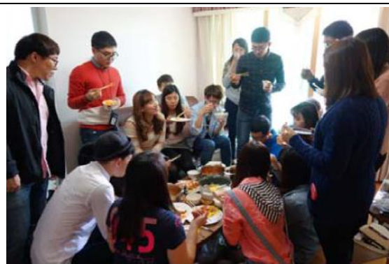
大家一起享受自製美食