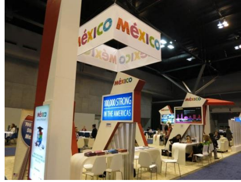
墨西哥的會場規劃