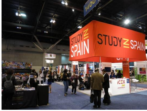
西班牙的會場規劃