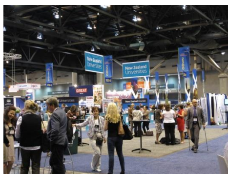
紐西蘭的會場規劃