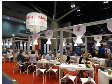
土耳其的會場規劃