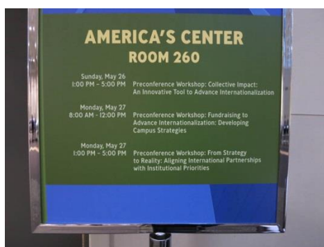
大會的研討會行程表