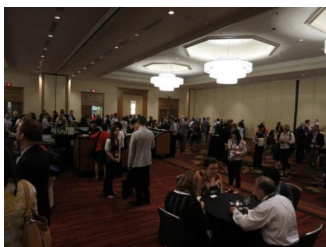
會後的自由交流時間