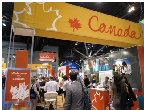
加拿大的會場規劃