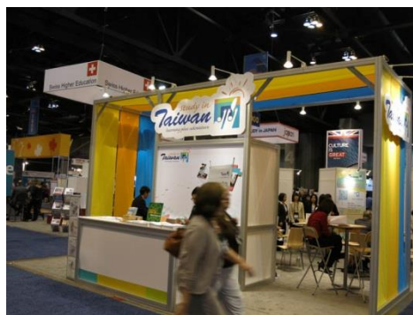
臺灣代表團的入口意象