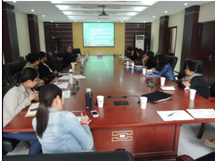
4/18 下午教師交流活動