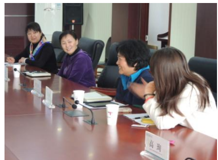
4/17 兩校交流合作業務商議