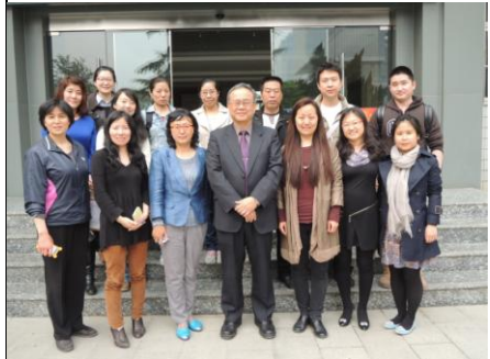
4/18 下午教師交流活動