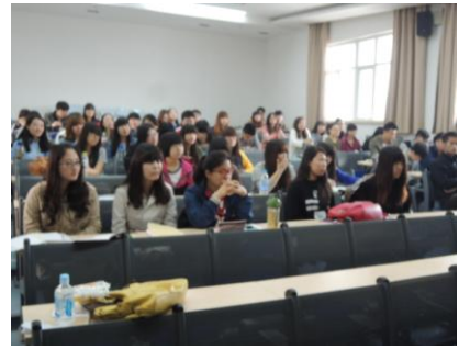
4/14 上午學生獎學活動