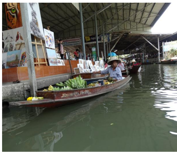
丹能莎朵水上市場