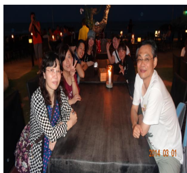
華新度假勝地海邊露天餐廳