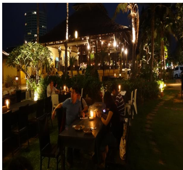
華新度假勝地海邊露天餐廳