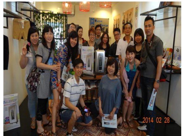
泰國曼谷莉美黛公司合影