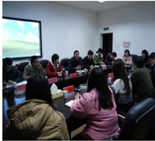
●湖南師範大學研討會