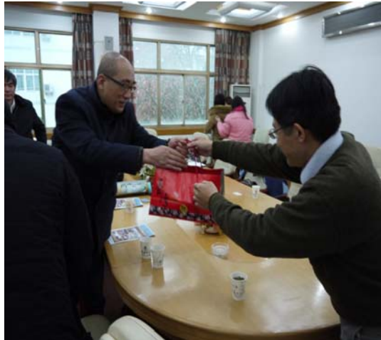
●代表我方致贈湖北大學