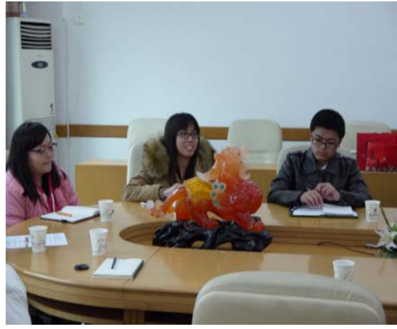
●我方學生針對其研究主題與湖北大學老師進行交流及討論