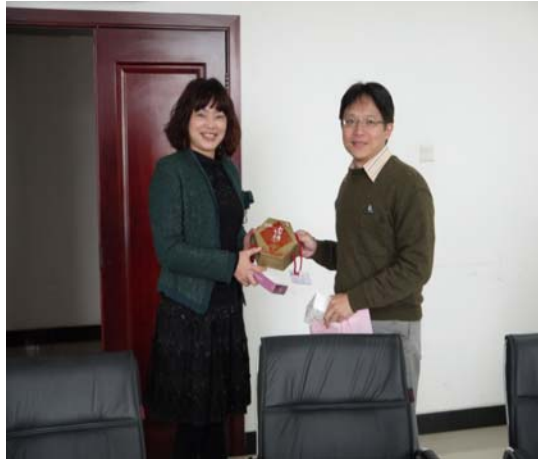
●代表我方致贈湖南財政經濟學院