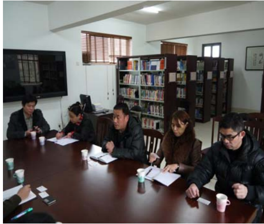
●湖南商學院研討會