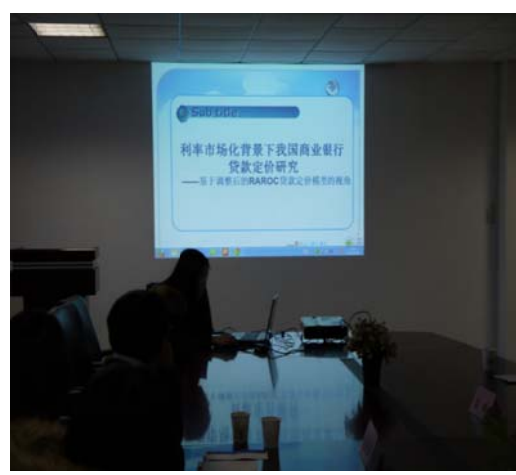
●湖北經濟學院學生報告其研究主題