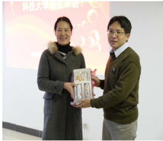
●代表我方致贈湖北經濟學院