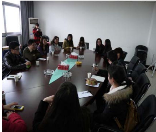
●湖南財政經濟學院座談會