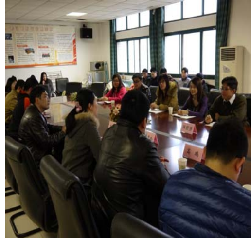
●湖北經濟學院研討會