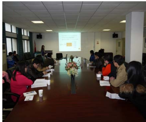
●我方學生報告其研究主題