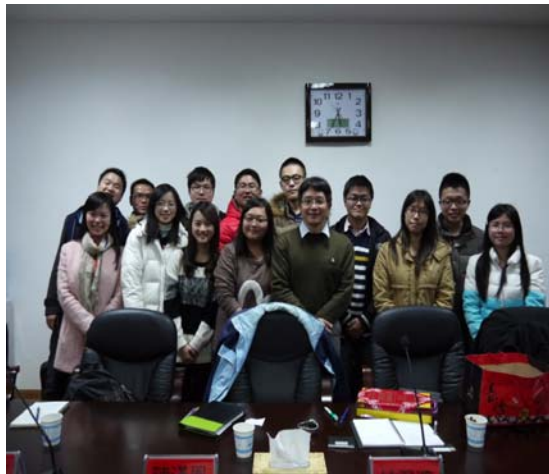
●與湖南師範大學研究生合影