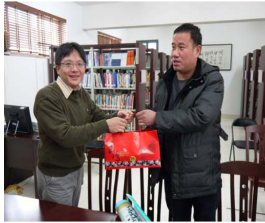
●代表我方致贈湖南商學院