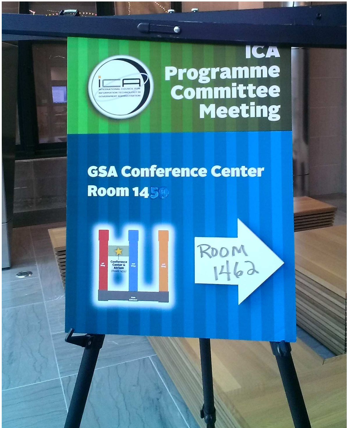
ICA 2014 年第 1 次計畫委員會會議，會場外布告內容。