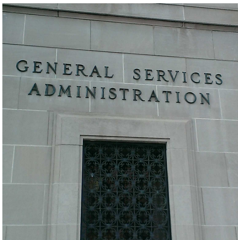
美國政府組織如上圖，本次 ICA 2014 年第 1 次計畫委員會議場地，即為美國華府 GSA(General Services Administration)。