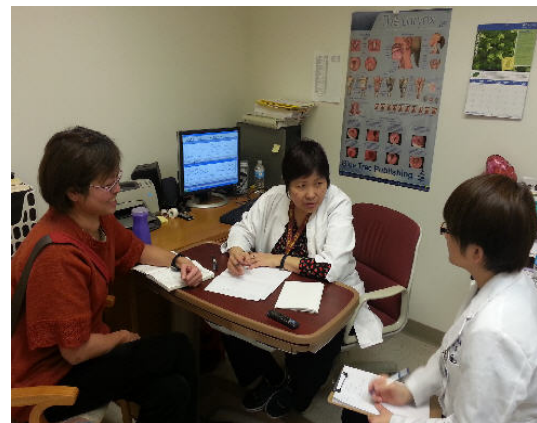
語言治療部門主任、主持人與學生