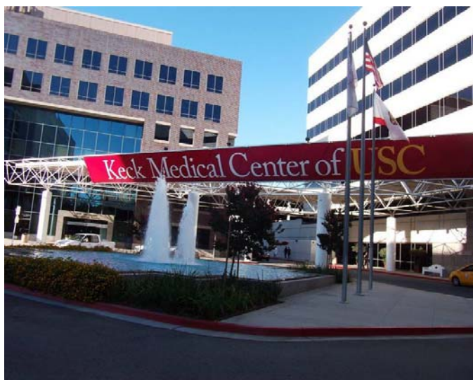
University of South California University Hospital, Keck Medical Center