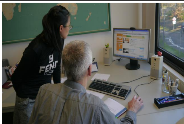
與 Karlsruhe 國際處共同研討暑期辦理營隊之細節