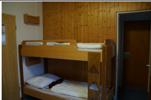
於 Karlsruhe 校區確認臺綜大國際領航員營隊之住宿環境