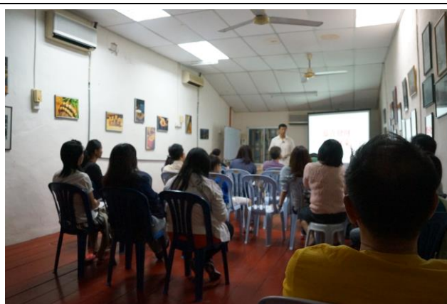
與馬來西亞馬六甲文化協會宣傳臺綜大之學位生招收