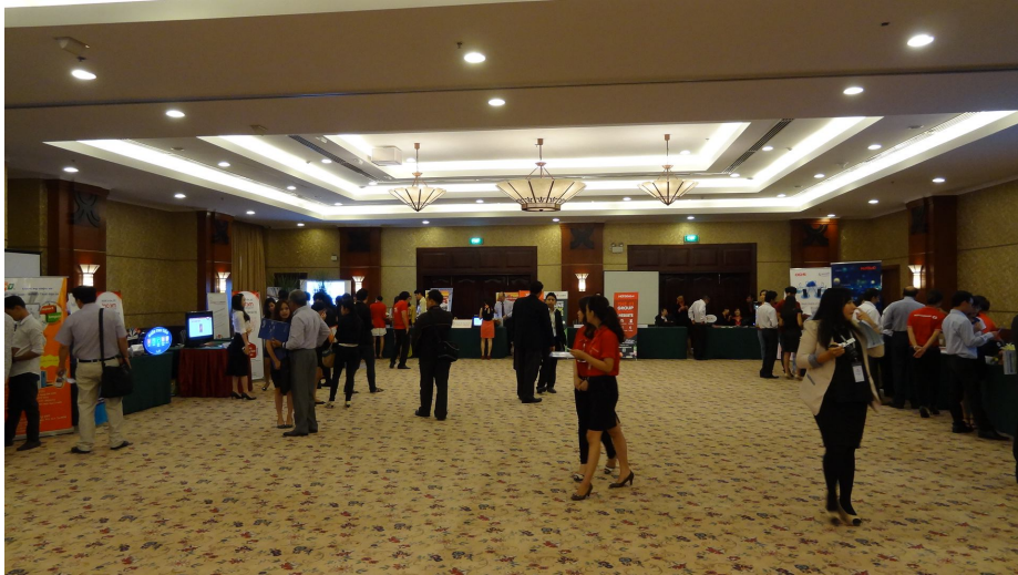
圖 5 電子商務應用實體展示(EDICOM)