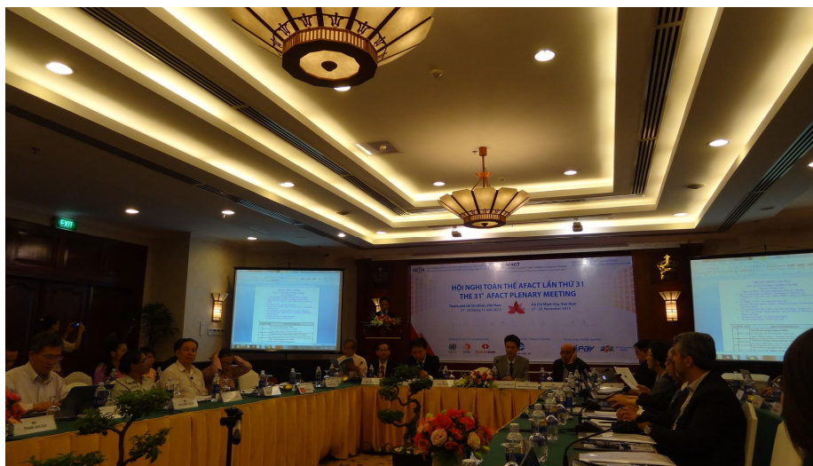
圖 4 AFACT 大會(Plenary Meeting)暨理事會(AFACT Steering Committee) 於胡志明市 Rex Hotel