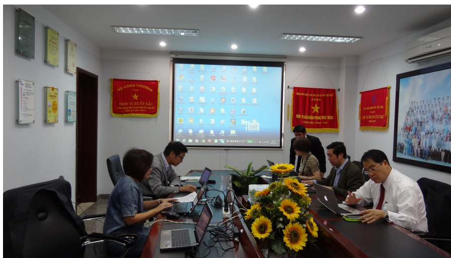
圖 3 技術方法論委員會(TMC)及社群支援委員會(CSC)聯合會議 於胡志明市 Nguyen Tat Thanh 大學