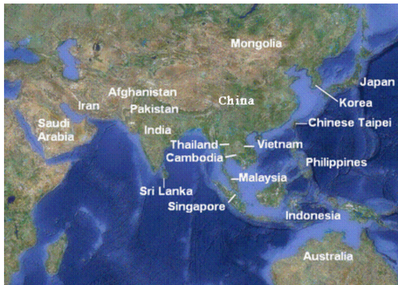
圖 2 目前 AFACT 會員國分布圖

目前會員(member)計有我國、伊朗、越南、日本、韓國、中國大陸、印度、印尼、馬來西亞、菲律賓、巴基斯坦、澳洲、新加坡、斯里蘭卡、泰國、蒙古、柬埔寨、阿富汗、沙烏地阿拉伯等 19 個國家或經濟體如圖 2 所示，另副會員(associate member)有 Pan Asian E-Commerce Alliance(PAA)1 個組織。