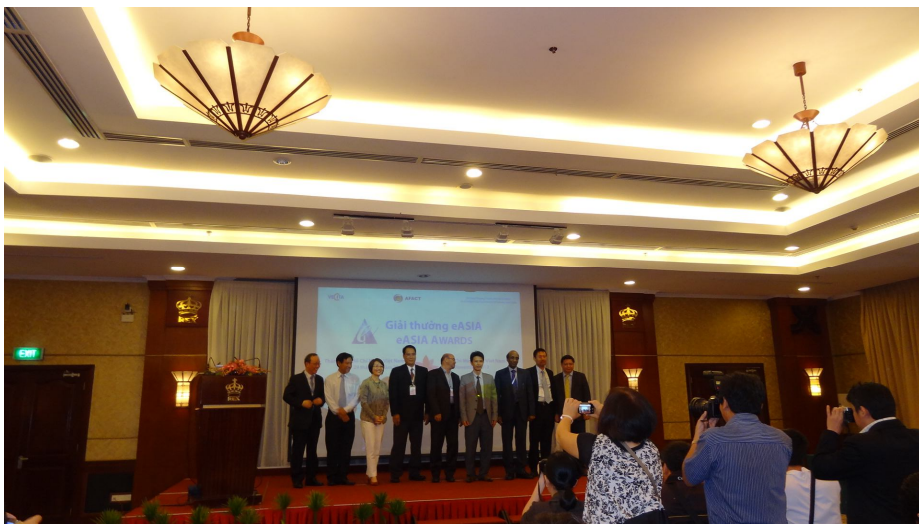
圖 6 亞太電子化成就獎(eASIA Award)頒獎典禮