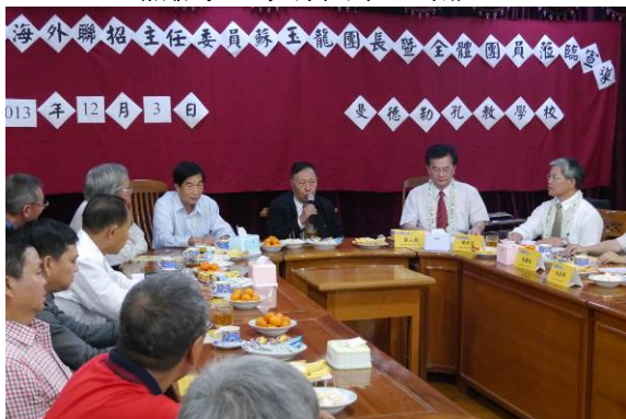
曼德勒宣導場次段必堯董事長(中)致詞