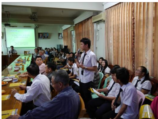
曼德勒宣導場次學生提問