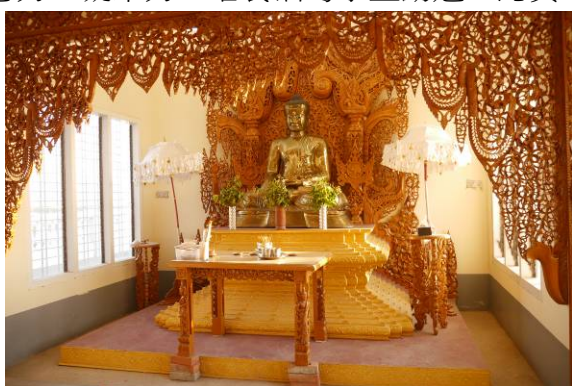
設立於孔教學校新城校區內的佛堂

藉由此次宣導活動安排，除了在宣導說明會上與同學互動，本團團員也把握時間積極與留臺校友、華校師長、緬甸聯招會相關人員等充分交換吸引緬甸學生赴臺升學的意見，並且實地參訪緬甸華文學校的教學環境。由於緬甸政府並不承認華文學校學歷，本會瞭解到在緬甸辦華文學校實屬不易，必須以宗教學校的名義設立，看到華人的孩子們從學齡開始，每天堅持 6 點上學，上完一早的華文學校再趕到緬文學校，下課後再回到華文學校繼續上課，禮拜六也必須上華校，這樣堅強的意志力，以及耆老們無私的奉獻，也因此造就緬甸華僑的向心力、凝聚力，培養緬甸學生勤勉、認真、積極的態度。