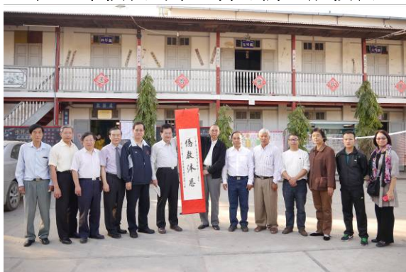
與明德學校師長合影