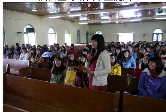
臘戍宣導場次學生提問