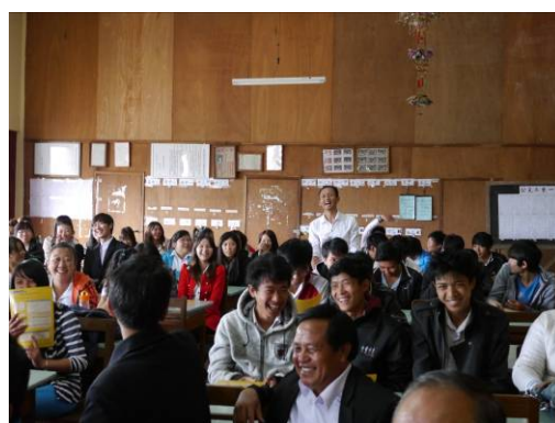
眉苗宣導場次學生提問