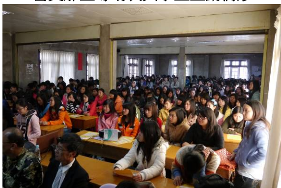
東枝宣導場次學生滿座