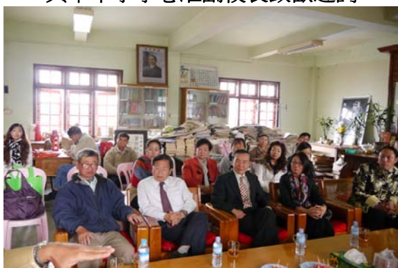
與興華中學師長交流-1