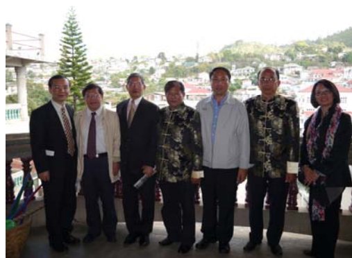
與興華中學董事們合影