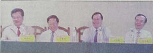
四位台灣高校負責人與學生互動熱烈。