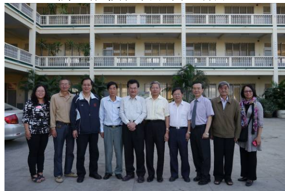
與孔教學校南區校區師長合影