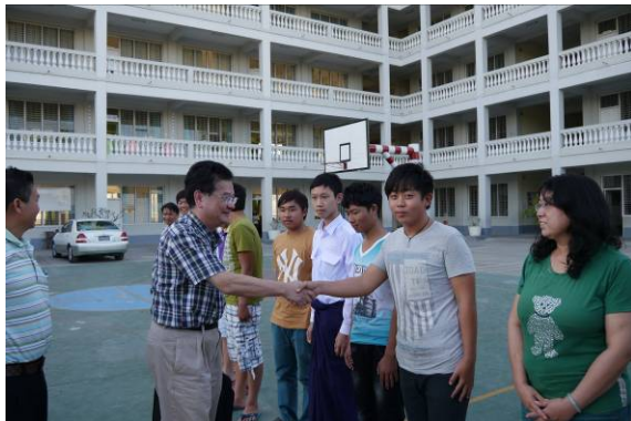
與孔教學校新城校區師長及學生合影-1