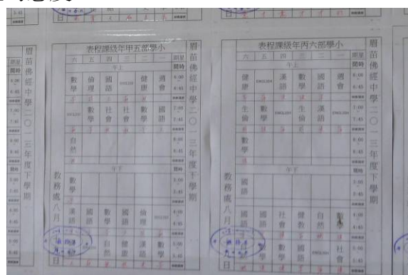
眉苗佛經學校的課表

隨著現在緬甸政府逐漸開放，經濟情況改善，使得緬甸地區相當具有發展潛力，為能提升緬甸僑生赴臺升學之意願，本次宣導所收集之各項建議如下：