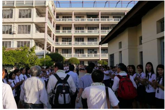
孔教學校(東區)學生列隊歡迎