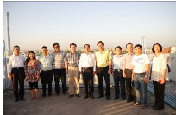
與孔教學校新城校區師長合影-2