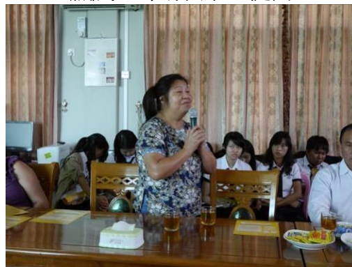
曼德勒宣導場次楊鳳女士肯定本次活動