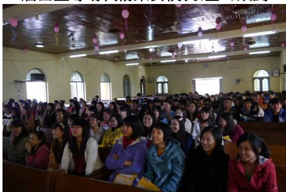
臘戍宣導場次學生滿座