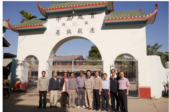
於育成學校高中部校門前合影