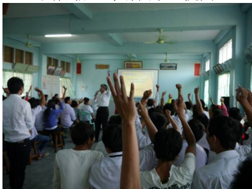
密支那宣導場次與學生互動情形