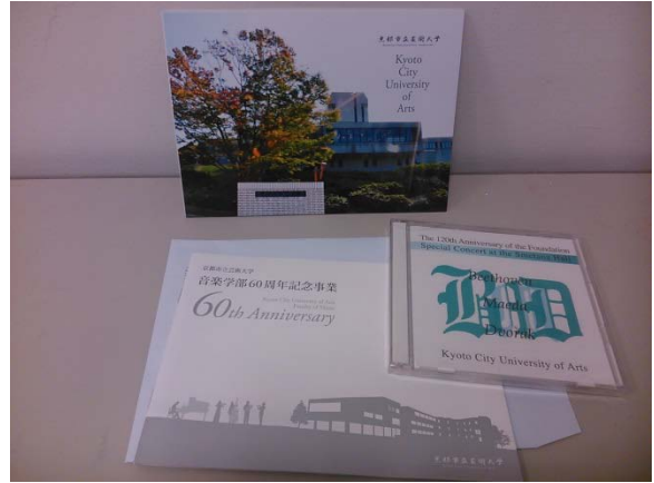
(圖 20)京都市立藝大之文宣介紹。