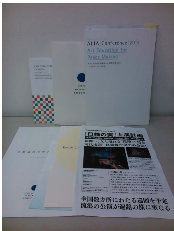
(圖 17)ALIA 會議手冊及相關資料。