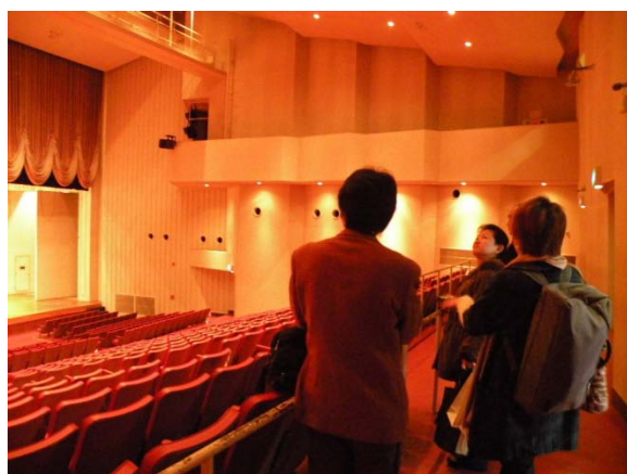
(圖 4)參觀京都市立藝術大學音樂廳。