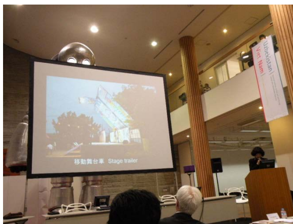
(圖 16)京都造型藝大柳美和教授宣布與北藝大的合作計畫。