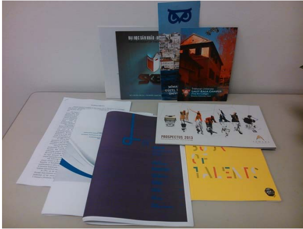
(圖 19)其他院校之文宣介紹。