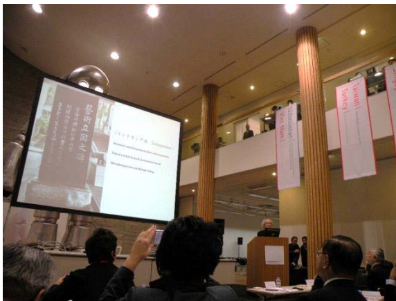
(圖 9)京都造型藝大理事長致詞。