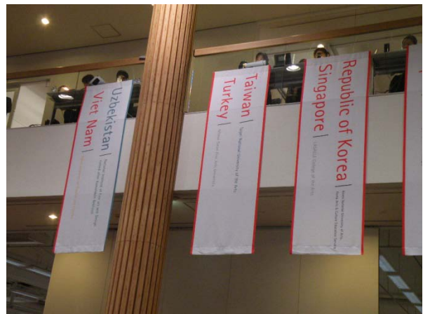
(圖 10)會場懸掛之台灣・北藝大字樣。