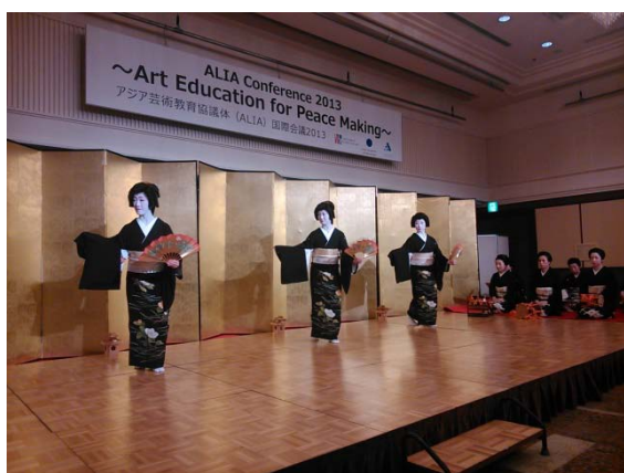
(圖 5)ALIA(亞洲藝術教育協議體)2013 京都大會歡迎晚宴之日本傳統舞蹈表演。