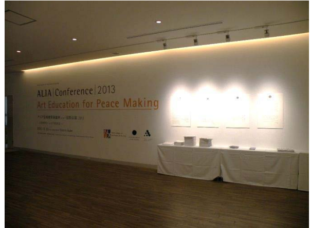
(圖 8)ALIA 會議會場入口。