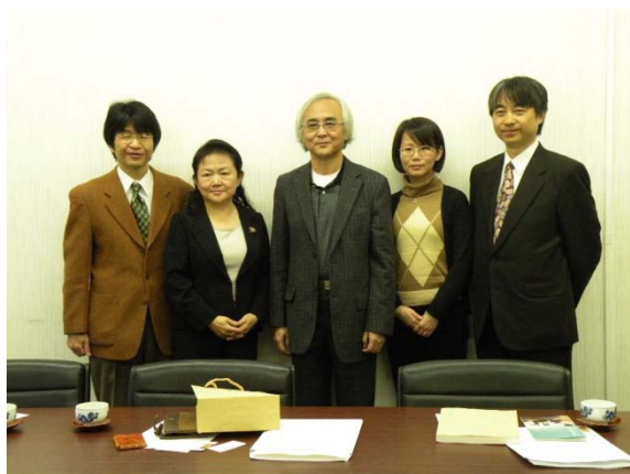
(圖 1) 京都市立藝術大學簽訂姊妹校。