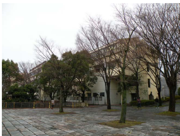
(圖 3)京都市立藝術大學校園一隅。