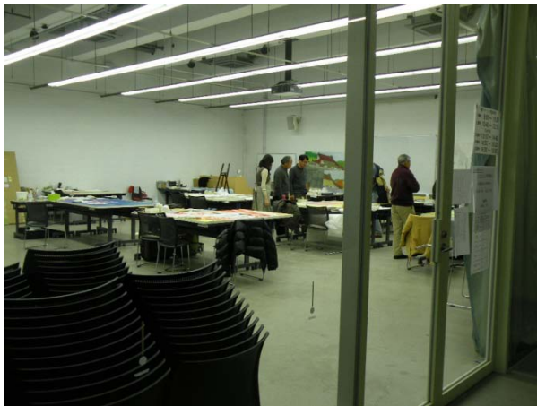
(圖 21)京都造型藝大校園參觀。