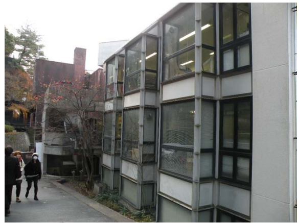
(圖 22)京都造型藝大校園參觀。