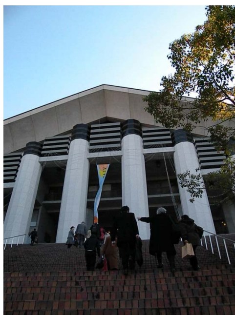
(圖 6)會場之京都造形藝術大學入口。