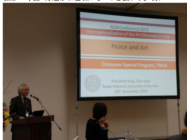
(圖 12)向各國院校及聽眾介紹北藝大之創意跨域特色課程。