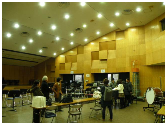
(圖 2)京都市立藝術大學參觀音樂排練。