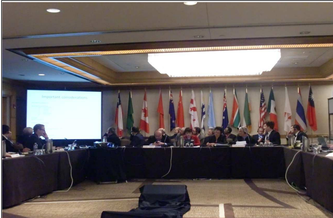
WWTG 會議議場及主辦單位所豎立與會各國國旗。