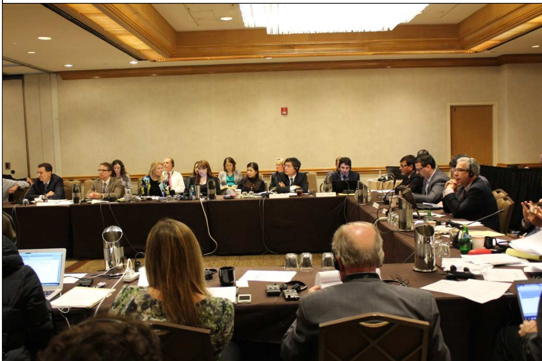
美國貿易代表署 Roger Wentzel 副助理代表（左 1）主持會議。