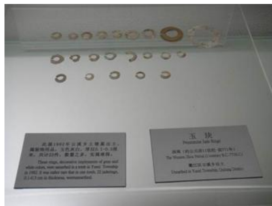
衢州博物館中展出的 衢州西山西周土墩墓出土玉玦