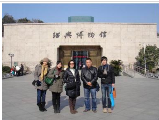
紹興博物館（市立新館）