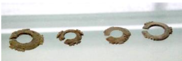
衢州西山西周土墩墓出土的帶突玉玦