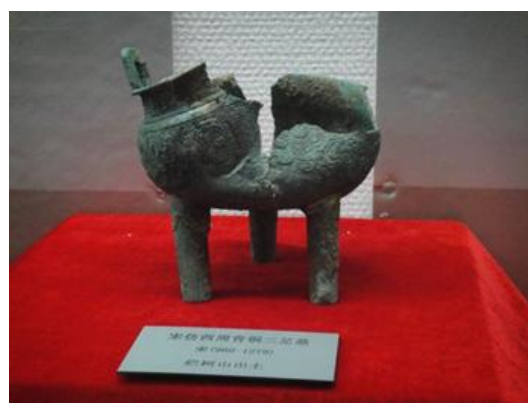
衢州博物館中展出的 爛柯山出土宋代仿古三足鼎